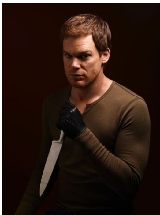
Obr. č. 10 - Dexter Morgan

Dexter neumí cítit emoce, a tak se je musí naučit správně napodobovat. Naučí se to tak dobře, že si tak získá i přízeň jeho (poté) manželky a spoluzaměstnanců. Seriál nám ukazuje postavu Dextera v pozitivním světle. Dokonce natolik, že Dexterovi fandíme a přejeme si, aby konal toto „dobro“ nadále. Není to ale zvrácené? Nakolik nás seriál ovlivnil, ovlivnil naše vnímání a pohled na sériového vraha, abychom s ním dokonce sympatizovali?