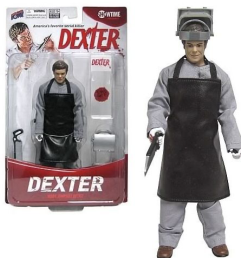
Obr. č. 1 - Panenka Dextera

Dětské hračky, které mohou být prostředkem násilí ve světě, si můžete zakoupit v každém obchodě. Falešné zbraně, granáty, meče. Co ale, když svému dítěti můžeme koupit postavičku sériového vraha? Na obrázku č. 2 můžete vidět panenku Dextera, který se připravuje na rozřezání oběti. Když tento seriál inspiroval děti k tomu, aby chtěly po svých rodičích koupit tyto panenky, jak moc mohl inspirovat dospělé? Bylo hned několik odpůrců, ale i zastánců, tohoto seriálu. A dokonce i několik napodobitelů, kteří vraždili v masce postavy Dextera, či vraždili stejným způsobem.