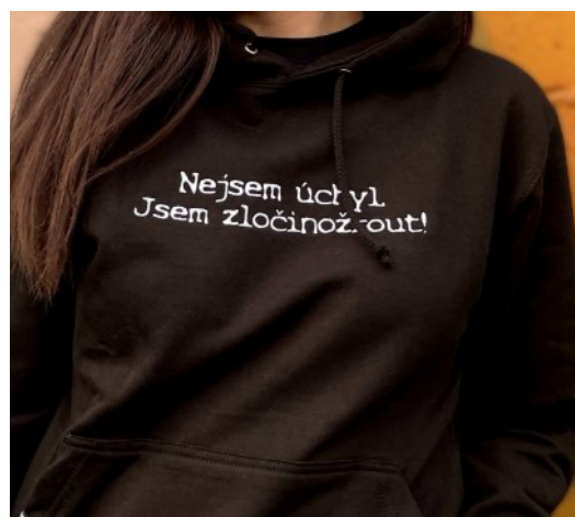
Obr. č. 7 - Mikina (zlocinozrouti, online)

Číslo posluchačů a sledujících na sociálních sítích také mluví o popularitě tohoto podcastu. Na platformě Youradio je přes 4000 posluchačů, na Instagramu přes 85,3 tisíc sledujících a na Spotify má hodnocení s 4,9 hvězd (hodnotilo přes 5,8 tisíc posluchačů) (data sesbírána 11.04.2022). Na platformě Youtube je přes 60,3 tisíc odběratelů, a jejich videa mají průměrně 80 tisíc zhlédnutí (data sesbírána 11.04.2022). Tento podcast má svou vlastní webovou stránku s e-shopem. Zde si posluchač může zakoupit jejich merch v podobě mikin a trik. Podcast Opravdové zločiny má také svou komunitu fanoušků. Název si fanoušci sami vybrali a přezdívací si Zločinožrouti. Podle toho také podcast utvořil na stránkách vlastní Klub zločinožroutů, kde mají posluchači jisté výhody.