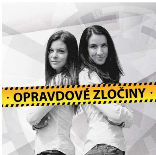
Obr. č. 6 - Podcast Opravdové zločiny (spotify, online)

Tento podcast získal v roce 2021 hned několik ocenění. V soutěži Podcast roku vyhrál v kategorii Autorský podcast první místo s 11,5 % odevzdaných hlasů, na druhém místě byl podcast se 7,9 %. Opravdové zločiny měly oproti druhému místu tedy výrazný náskok. V tomto roce také získaly dvakrát druhé místo v soutěži Křišťálová lupa v kategoriích Podcast roku a Cena popularity.