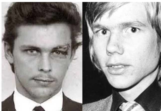
Obr. č. 20 - vlevo Clark Olofsson, vpravo Jan-Erik Olsson, (truecrimeedition, online)

A tak se od té doby pozitivní citová vazba oběti k pachateli označuje jako Stockholmský syndrom . Toto pouto se nejčastěji rozvine, když má pachatel život oběti „ve svých rukou“, ale rozhodne se ji neusmrtit. Dle Voňkové (2003 in Úlehlová, 2009, s. 67) jsou k rozvinutí Stockholmského syndromu nutné tyto podmínky: život oběti musí být v ohrožení, oběť si musí být jista, že nemůže pachateli uniknout, zároveň je izolována od společnosti, a tak následně pociťuje náklonnost, sympatie k pachateli. Rizikovou osobou k podlehnutí tomuto syndromu může být oběť domácího násilí a sexuálního zneužívání.