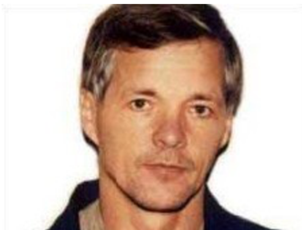
Obr. č. 19 - Jack Johann Unterweger ( bostiberbiaas, online )

První vraždu spáchal v roce 1974, ve věku 24 let, kdy brutálně usmrtil vídeňskou prostitutku. Po této vraždě byl zatčen a odsouzen na doživotí. Nakonec byl ale po 16. letech puštěn na svobodu. Během doby strávené ve vězení se dal Unterweger do psaní, kdy napsal slavnou knihu Očistec aneb cesta do kriminálu (1994). Tato kniha je biografií Unterwegera a je z pohledu týraného chlapce, který postrádá mateřský cit a lásku a je vychováván dědečkem. Kniha se stala naprostým bestsellerem. Díky tomu byl pro jeho čtenáře a obdivovatele jakýmsi obrazem „napraveného zločince“, a tak pod nátlakem jeho obdivovatelů byl roku 1990 propuštěn (Bechynková, Krčmová, 2020b, online). Bohužel díky tomuto propuštění začal znovu, téměř okamžitě, vraždit. Jen za pouhých prvních pár měsíců po propuštění Unterweger zabil 6 prostitutek. Během dvou let, než byl znovu dopaden, prý zabil více jak 9 obětí, odsouzen byl ale pouze za 9 dokázaných vražd. Dokonce zabil i jednu prostitutku v Praze, v tehdejší Československu. Díky tomuto případu byl posléze spojen s vraždami. Po odsouzení se roku 1992 zavraždil v cele (některé zdroje uvádějí rok úmrtí 1994) (Drbohlav, 2013, s 424–425).