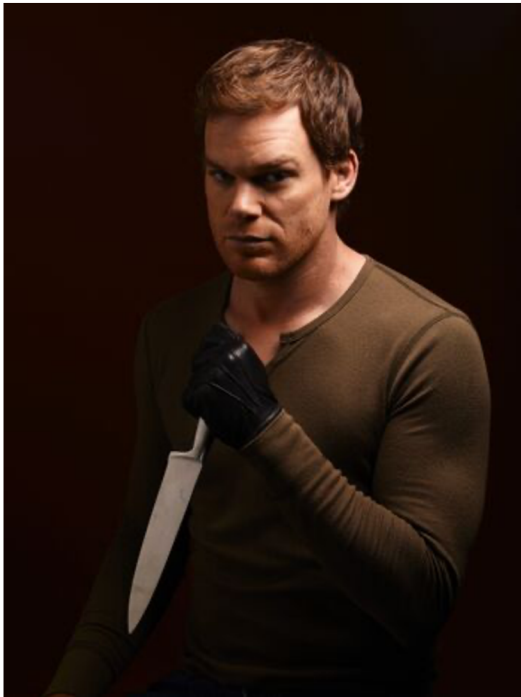
Obr. č. 10 - Dexter Morgan

Dexter neumí cítit emoce, a tak se je musí naučit správně napodobovat. Naučí se to tak dobře, že si tak získá i přízeň jeho (poté) manželky a spoluzaměstnanců. Seriál nám ukazuje postavu Dextera v pozitivním světle. Dokonce natolik, že Dexterovi fandíme a přejeme si, aby konal toto „dobro“ nadále. Není to ale zvrácené? Nakolik nás seriál ovlivnil, ovlivnil naše vnímání a pohled na sériového vraha, abychom s ním dokonce sympatizovali?