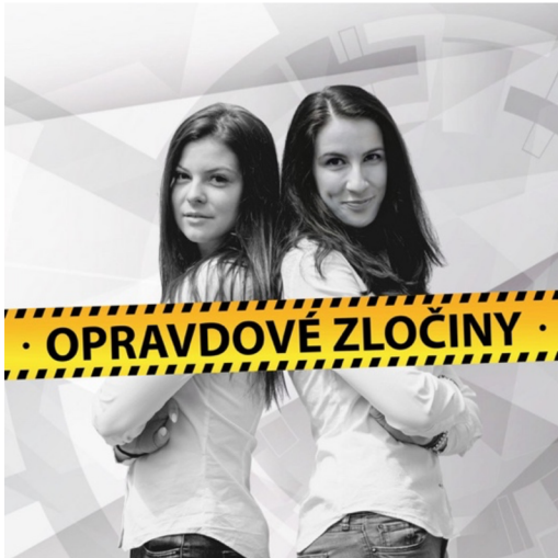
Obr. č. 6 - Podcast Opravdové zločiny (spotify, online)

Tento podcast získal v roce 2021 hned několik ocenění. V soutěži Podcast roku vyhrál v kategorii Autorský podcast první místo s 11,5 % odevzdaných hlasů, na druhém místě byl podcast se 7,9 %. Opravdové zločiny měly oproti druhému místu tedy výrazný náskok. V tomto roce také získaly dvakrát druhé místo v soutěži Křišťálová lupa v kategoriích Podcast roku a Cena popularity.