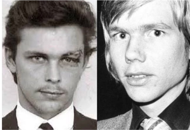
Obr. č. 20 - vlevo Clark Olofsson, vpravo Jan-Erik Olsson, (truecrimeedition, online)

A tak se od té doby pozitivní citová vazba oběti k pachateli označuje jako Stockholmský syndrom . Toto pouto se nejčastěji rozvine, když má pachatel život oběti „ve svých rukou“, ale rozhodne se ji neusmrtit. Dle Voňkové (2003 in Úlehlová, 2009, s. 67) jsou k rozvinutí Stockholmského syndromu nutné tyto podmínky: život oběti musí být v ohrožení, oběť si musí být jista, že nemůže pachateli uniknout, zároveň je izolována od společnosti, a tak následně pociťuje náklonnost, sympatie k pachateli. Rizikovou osobou k podlehnutí tomuto syndromu může být oběť domácího násilí a sexuálního zneužívání.