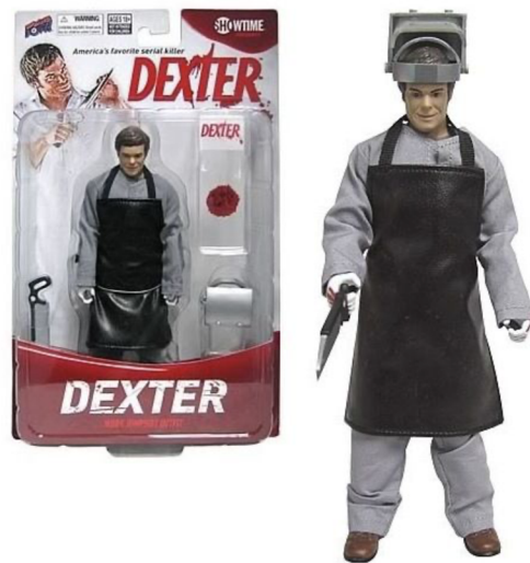
Obr. č. 1 - Panenka Dextera

Dětské hračky, které mohou být prostředkem násilí ve světě, si můžete zakoupit v každém obchodě. Falešné zbraně, granáty, meče. Co ale, když svému dítěti můžeme koupit postavičku sériového vraha? Na obrázku č. 2 můžete vidět panenku Dextera, který se připravuje na rozřezání oběti. Když tento seriál inspiroval děti k tomu, aby chtěly po svých rodičích koupit tyto panenky, jak moc mohl inspirovat dospělé? Bylo hned několik odpůrců, ale i zastánců, tohoto seriálu. A dokonce i několik napodobitelů, kteří vraždili v masce postavy Dextera, či vraždili stejným způsobem.