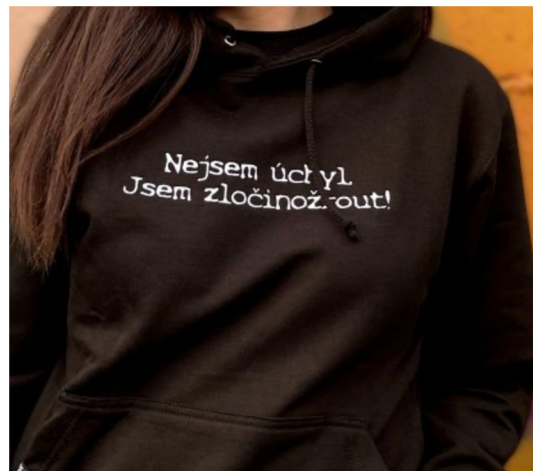
Obr. č. 7 - Mikina ( zločinožrouti , online)

Číslo posluchačů a sledujících na sociálních sítích také mluví o popularitě tohoto podcastu. Na platformě Youradio je přes 4000 posluchačů, na Instagramu přes 85,3 tisíc sledujících a na Spotify má hodnocení s 4,9 hvězd (hodnotilo přes 5,8 tisíc posluchačů) (data sesbírána 11.04.2022). Na platformě Youtube je přes 60,3 tisíc odběratelů, a jejich videa mají průměrně 80 tisíc zhlédnutí (data sesbírána 11.04.2022). Tento podcast má svou vlastní webovou stránku s e-shopem. Zde si posluchač může zakoupit jejich merch v podobě mikin a trik. Podcast Opravdové zločiny má také svou komunitu fanoušků. Název si fanoušci sami vybrali a přezdívají si Zločinožrouti . Podle toho také podcast utvořil na stránkách vlastní Klub zločinožroutů , kde mají posluchači jisté výhody.