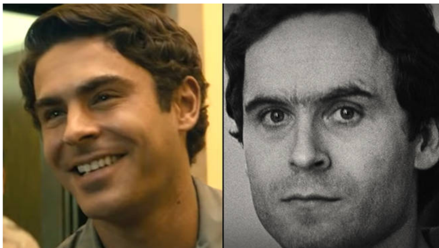
Obr. č. 5 - vlevo Zac Efron, vpravo Ted Bundy (popbuzz, online)

O Bundyho roku 2019 Netflix natočil film s názvem Extremely Wicked, Shockingly Evil and Vile (v češtině přeloženo jako Zlo s lidskou tváří ). Teda Bundyho zde hraje slavný herec Zac Efron, který je mu velmi podobný. Na IMDb (nejznámější mezinárodní on-line databáze informací o filmech, televizních pořadech, hercích, herečkách, režisérech a všem ostatním, co souvisí s filmovou tvorbou) má tento film hodnocení 6.7/10, přičemž tento film hodnotilo 91 tisíc sledujících. Tento film byl, a stále je, na Netflixu velmi populární. Může za to případ Teda Bundyho anebo atraktivní vzhled a herecký výkon herce?