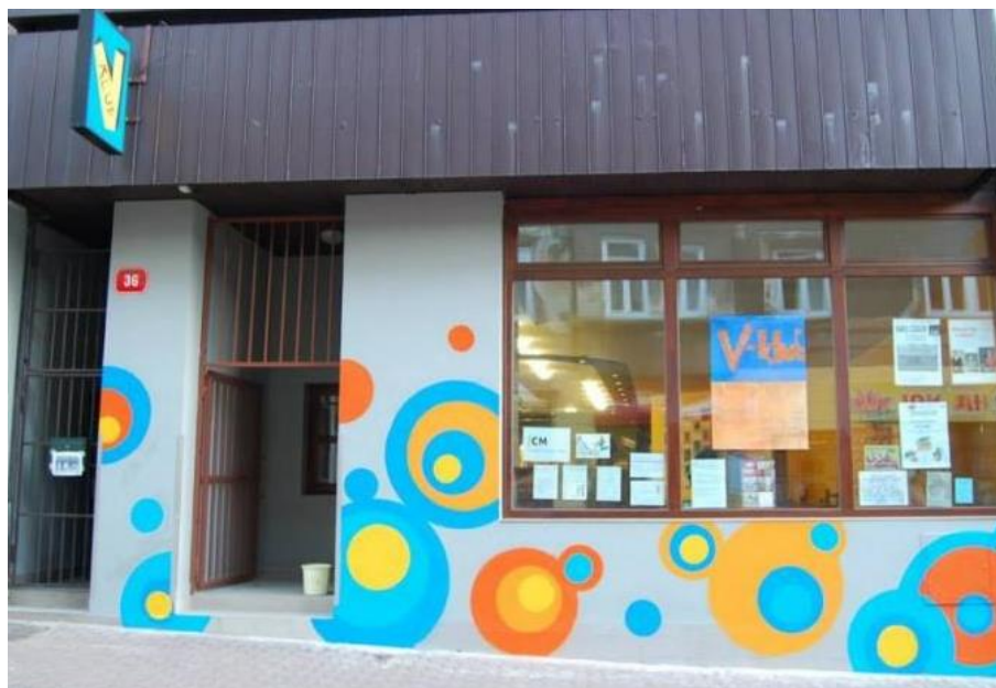
Obr. 4.2: V-klub

Pro školy V klub nabízí školení a semináře, tvůrčí dílny nebo multikulturní výchovu pod vedením zkušených lektorů. V-klub se také zabývá nespecifickou prevencí sociálně patologických jevů a snaží se stírat sociální i národnostní rozdíly. (V-Klub Liberec, 2016)