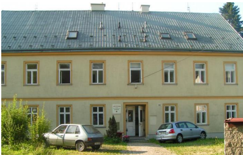
Obr. 4.3: Turistická ubytovna Domu dětí a mládeže Větrník

Celoročně zde probíhají týdenní pobyty a víkendová soustředění pro děti i dospělé. Přes letní prázdniny zde probíhají tábory pro děti. Turistickou ubytovnu je tedy možné si zamluvit na jakoukoliv část roku. (Větrník, 2016)