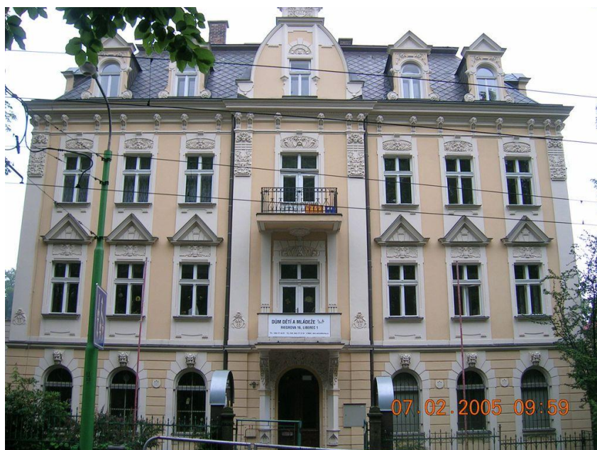
Obr. 4.1: Dům dětí a mládeže Větrník, příspěvk. Org