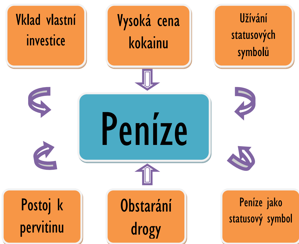
Diagram č. 3: Výsledky selektivního kódování

V rámci selektivního kódování jsem identifikovala centrální kategorii: Peníze jako statusový symbol. Otázka peněz se objevovala ve všech výpovědích, kde byl patrný i vzájemný vztah s ostatními kategoriemi. De facto jakákoli výpověď ohledně kokainu samotného se nakonec projevila v otázce peněz. Tuto kategorii právě z tohoto důvodu zvolila jako centrální.