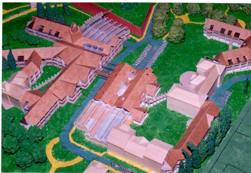
Model dostavby JÚ z roku 1990 od Vlada Miluniče

ale které v té době okupovaly nevzhledné pavilóny s kanceláři pro výstavbu obřího Paláce kultury. Další část pozemků využíval sportovní tenisový oddíl, který je tam vlastně i dnes. Do těchto prostor by byly zanořeny „tři prsty“, představující tři jednopatrové objekty (samozřejmě vybavené protipožárními venkovními evakuačními rampami pro vozíčkáře). V prvním „prstu“ umístěném v těsném sousedství vyšehradských hradeb měl být zdravotnický úsek a rehabilitace. Další „prst“ měl mít v přízemí odborné učiliště a v patře pak gymnázium. Poslední „prst“ obsahoval prostory pro základní a zvláštní školu. Objekt Na Topolce, kde jsem později vedl gymnázium, by byl podobně jako tzv. Nová budova plně integrován do nového řešení. Všechny objekty měly být nízké (patrové), vzdušné a prosvětlené a pospojované zasklenými rampami a průchody. Ústav by byl otevřený okolním lidem a dětem – nejen co se týká možnosti navštěvovat školy či rehabilitační zařízení, ale i k procházkám a využívání sportovních zařízení. V létě, v době prázdnin, navrhoval Vlado využít kapacitu ubytování jako hotel s přednostní nabídkou pro zahraniční vozíčkáře.