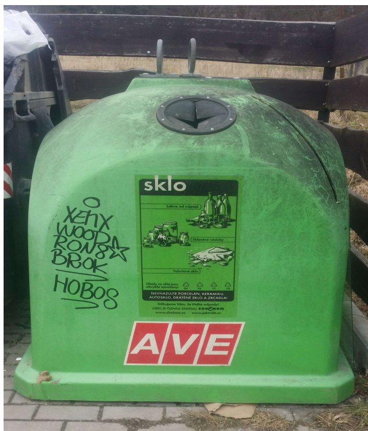
Obrázek č.8 Tříděný odpad v obci Kamenný přívoz, kontejner na sklo