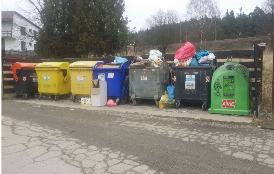
Obrázek č 5 Tříděný odpad v obci Kamenný Přívoz