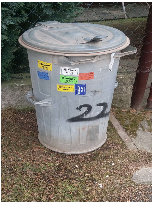
Obrázek č. 2 popelnice se štítkem na svoz komunálního odpadu v obci Kamenný Přívoz