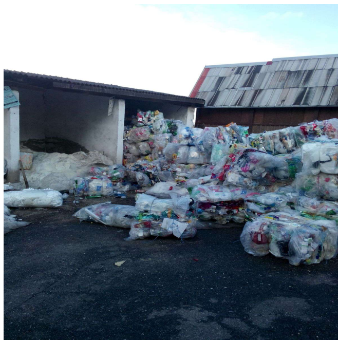
Obrázek č 11 Skládka tříděného odpadu za městským úřadem Hoře Sv. Kateřiny Pozn: zdroj:vlastní zpracování autorem