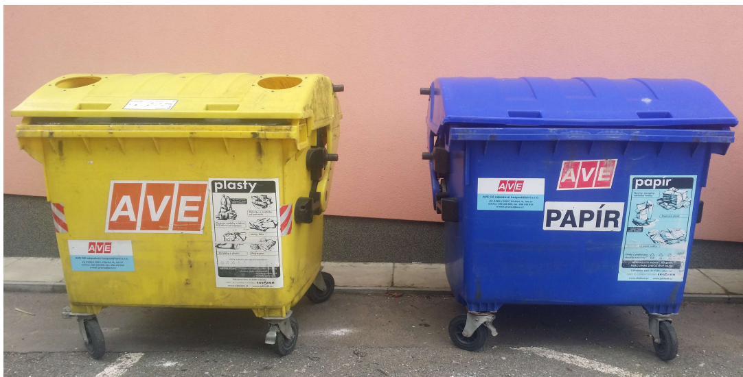
Obrázek č 7 Tříděný odpad v obci Kamenný Přívoz, kontejner na plasty a papír