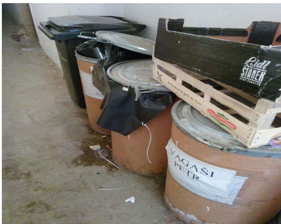
Obrázek č 12 Dřevěné soudky s odpadem v obytném domě č.p. 367 v Hoře Sv. Kateřiny