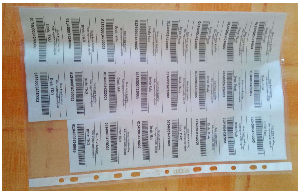
Obrázek č 3 Nalepovací kódy na komunální odpad a tříděný v Hoře Sv. Kateřiny na rok 2017

Ve městě Hora Sv. Kateřiny se platí jednou ročně 500 Kč na obyvatele, platit se může hotově, kartou přímo na Městském úřadě, nebo také je zde i možnost převod na bankovní účet města, kdy občan zadá variabilní symbol své rodné číslo. V roce 2003 byl ve městě zaveden také systém tříděného odpadu a to do pytlů, kdy za každý vytríděný odpad (vyseparovaný pytel) je vrácena částka 10,- Kč zpět a je následně odečtena na konci kalendářního roku z částky 500,- Kč. Občané obdrží po zaplacení poplatku za svoz odpadů nalepovací kódy obrázek č. 3, které pak lepí na pytle s komunálním odpadem a také s tříděným odpadem aby se také lépe evidovala částka 10,- Kč, která bude následně odečtena na konci roku. Osvobozen je poplatník, který je držitelem průkazu ZTP a poplatník, který dovršil věku 75 let. Kalendář svozů odpadů obrázek č. 4 je každému občanovi města doručováno do schránky a je i vyvěšen na úřední desce.