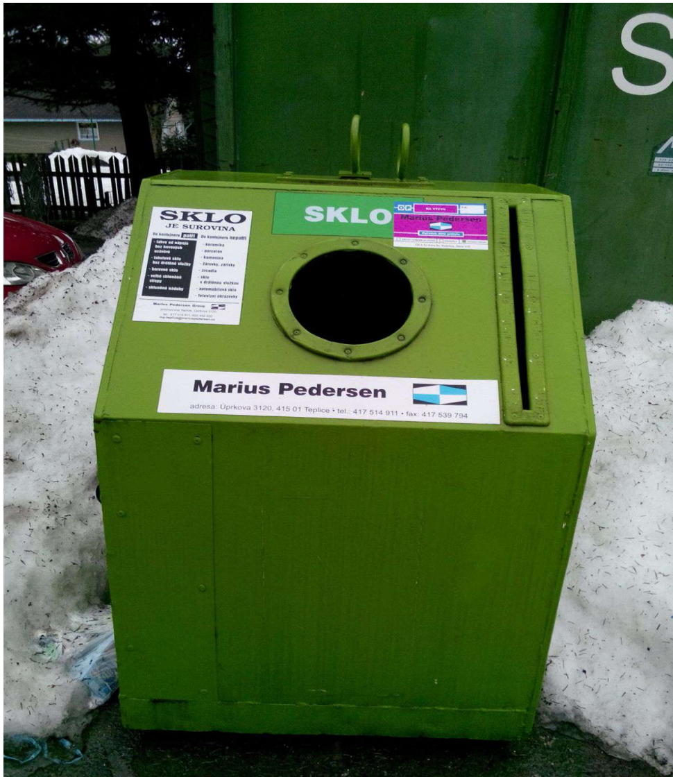
Obrázek č 13 Tříděný odpad, kontejner na sklo v dětském domově v Hoře Sv. Kateřiny