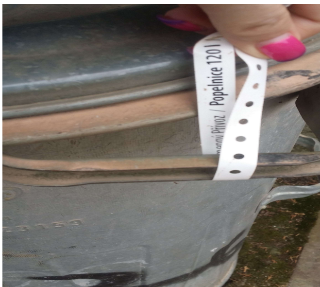
Obrázek č. 1 štítek na popelnici pro svoz komunálního odpadu vratnému pro proplacení firmy AWE na obci Kamenný Přívoz