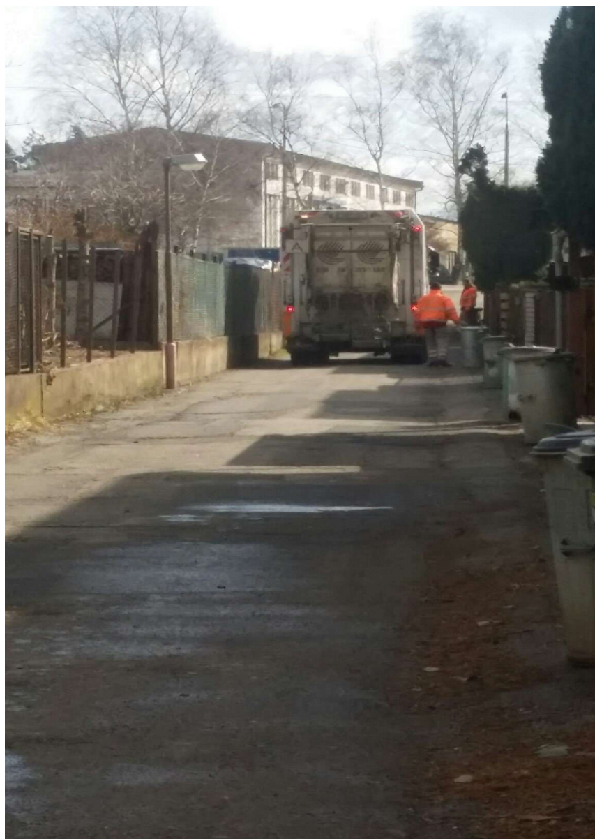
Obrázek č 9 svoz komunálního odpadu v kamenném Přívozu firmou AVE

Svoz komunálního odpadu v Kamenném přívozu provádí firma AVE obrázek číslo 9 a dle smluvních závazků sváží z obce směsný komunální odpad, ambulantní svozy nebezpečných odpadů, objemného odpadu a smluvně i bio popelnice 120 nebo 240 litrů - si obec zprostředkuje, platí si občané sami a zpětný odběr elektroodpadu firmě ELEKTROWIN ale obec má i smlouvu s další firmou na odvoz elektroodpadu a to s REMA SYSTÉM, která zdarma zajišťuje odvoz a zároveň i ekologickou likvidaci elektroodpadu ze sběrného boxu, která je umístěn vedle Obecního úřadu v Kamenném Přívozu (zde sem mohou občané zdarma odpad odvézt).