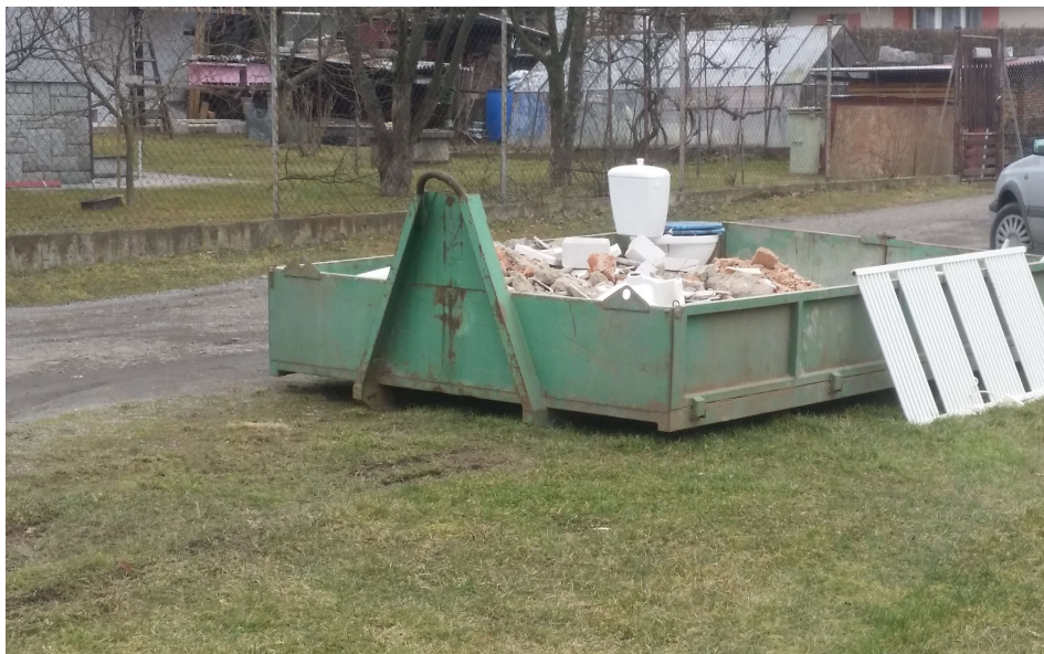
Obrázek č 6 Tříděný odpad v obci Kamenný Přívoz, stavební materiál