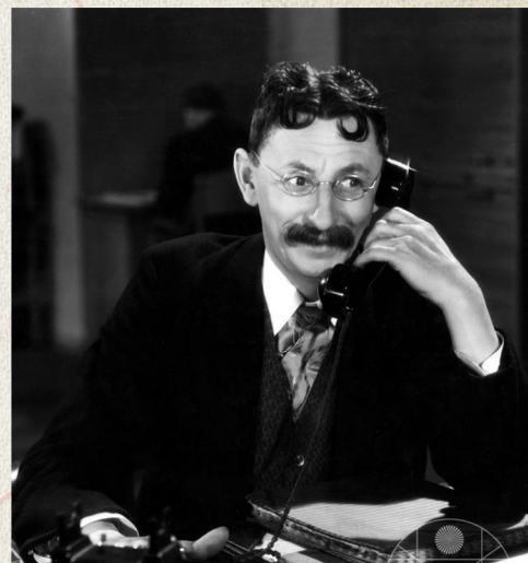
Vlasta Burian, z filmu Ducháček to zařídí , r. 1938

Počátek 30. let přináší do kinematografie zvuk. Už na začátku roku 1930 bylo v Čechách a na Moravě 10 zvukových kin, na konci stejného roku se počet zvýšil na 40 biografů. 7 Prvním čistě českým zvukovým filmem 8 byl snímek Když struny lkají (F. Fehér, 1930). Většinu repertoáru v této době obstarávaly snímky ze zámoří.