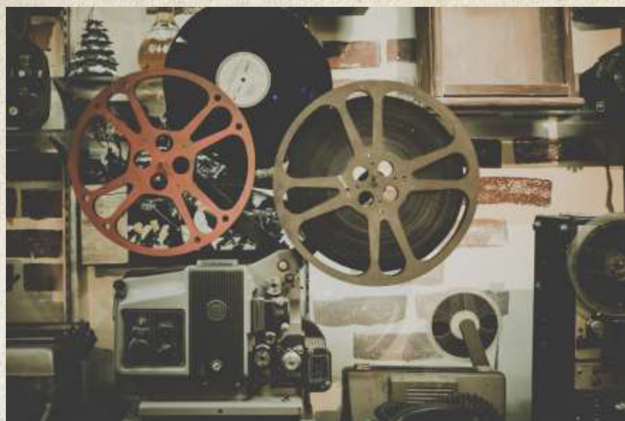
Ilustrační obrázek – filmové pásky

„Filmový přepis literární předlohy je pak sémiologicky vykládán jako intersémiologický překlad – překlad významů