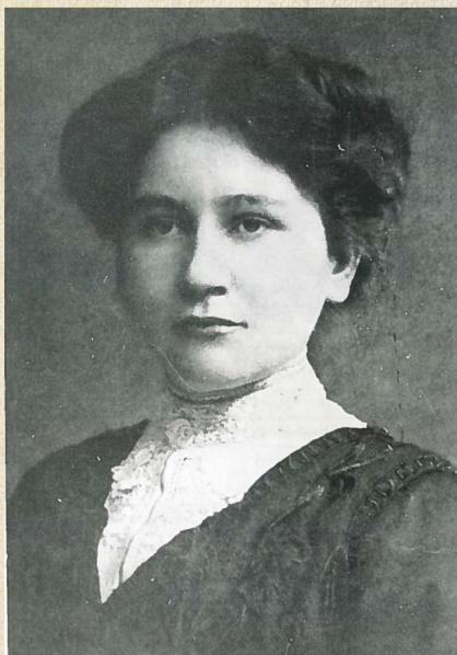
Božena Benešová, rok 1910