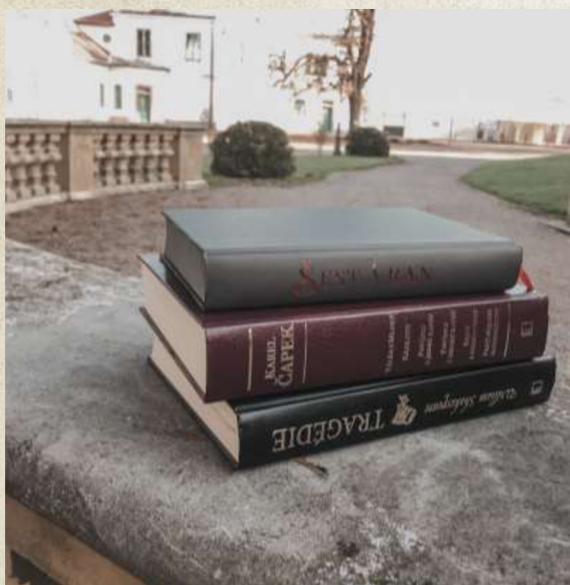
Ilustrační obrázek – literární díla

Marie Mravcová ve své knize Literatura ve filmu říká: „Četné a trvající kontakty filmu s literaturou způsobila, umožnila a podporuje zejména jedna jejich společná vloha – vloha vyprávět příběh. Vyprávět příběh pak neznámá nic více a nic méně než zajímat se o osudy lidí, o lidské charakterity a mezilidské vztahy, o dramatické zauzlení lidských situací – ať už v časoprostoru reálném či fantastickém, současném i historickém.“ 1 Román i film