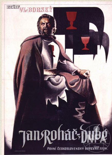
Plakát k filmu Jan Roháč z Dubě

Dne 15. března 1939 se z Československa stává Protektorát Čechy a Morava, a proto zemi opustilo mnoho nadaných tvůrců i herců. Odešel například Hugo Haas, herci Jan Werich a Jiří Voskovec, skladatel Jaroslav Ježek, režisér a scenárista Jiří Weiss a další. Po okupaci byla i v kinematografii zavedena tuhá cenzura (např. na podzim