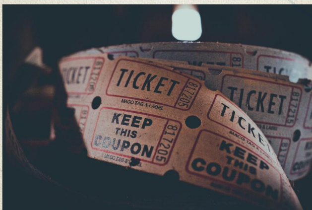
Ilustrační obrázek – listky do kina

Historie českého filmu se váže k 15. červenci roku 1896, kdy v Karlových Varech proběhla první projekce na našem území, zanedlouho následovalo promítání i v dalších městech, v Mariánských Lázních, Brně, Ústí nad Labem a v Moravské Ostravě. 1 První filmový záznam, který se natočil na české půdě, byl záznam pašijového představení v Hořicích na Šumavě z roku 1897. 2 V této době existovaly jen kočovné podniky, které promítaly filmy na různých místech ve velkých sálech, hospodách a v létě se promítalo