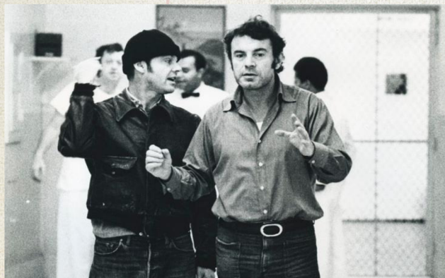
Miloš Forman při natáčení filmu Přelet nad kukaččím hnízdem

K Nové vlně 18 , která zaštiťovala osobnosti tvořící od 60. let, můžeme zařadit jména jako Miloš Forman, Věra