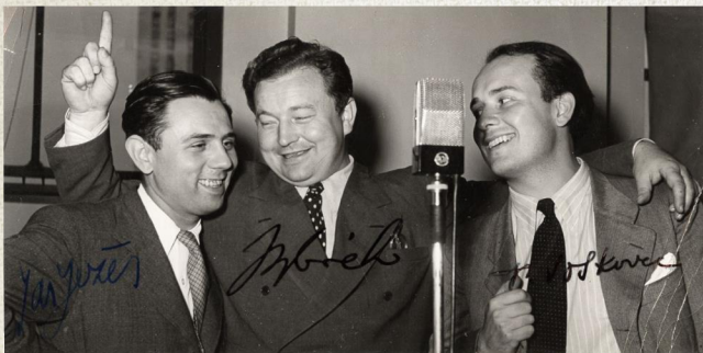
Zleva Jaroslav Ježek, Jan Werich, Jiří Voskovec

Dne 15. března 1939 se z Československa stává Protektorát Čechy a Morava, a proto zemi opustilo mnoho nadaných tvůrců i herců. Odešel například Hugo Haas, herci Jan Werich a Jiří Voskovec, skladatel Jaroslav Ježek, režisér a scenárista Jiří Weiss a další. Po okupaci byla i v kinematografii zavedena tuhá cenzura (např. na podzim