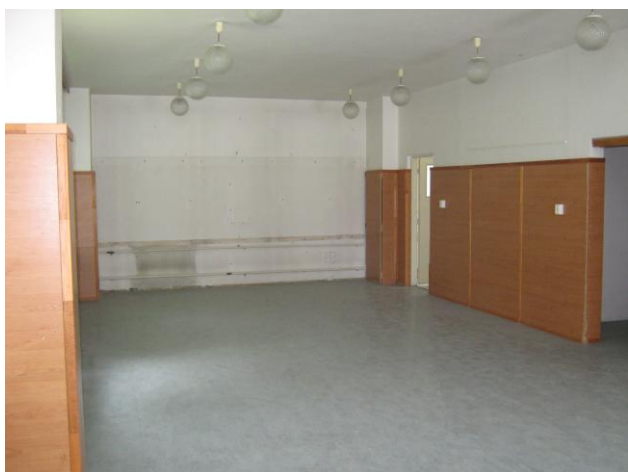
Pohled do boční místnosti s dveřmi na toalety a prostorem pro sklad