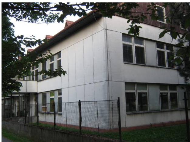
Pohled na zadní část budovy s druhým východem