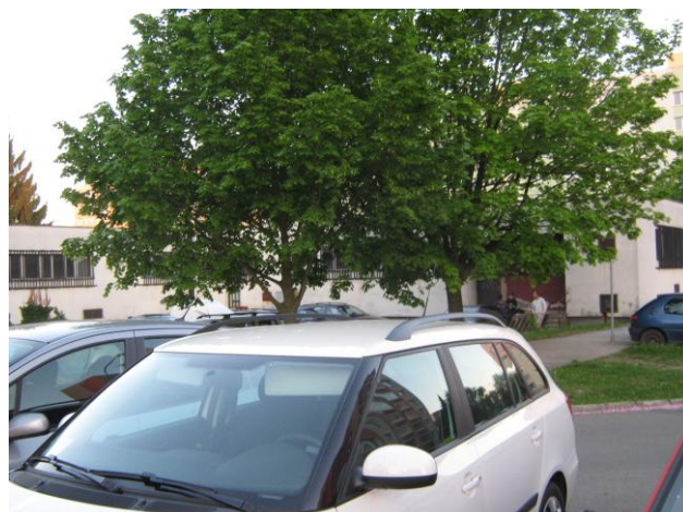
Parkoviště, které je za zahradou a pohled na skupinku mládeže na sídlišti