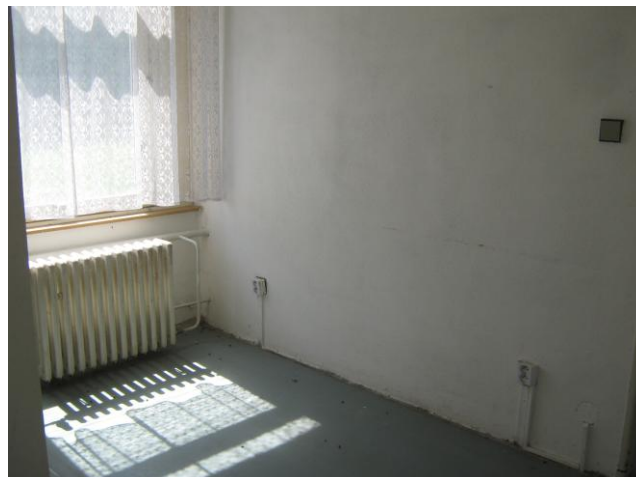
Pohled do vedlejší místnosti (budoucí šatny)