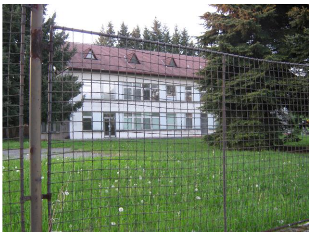
Pohled na vstupní část budovy přes plot