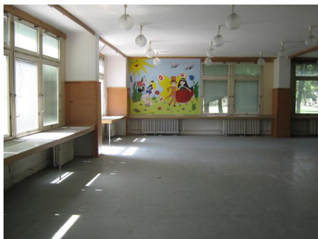
Pohled do první velké místnosti