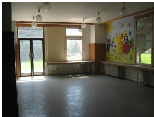
Pohled na prostor s východem na verandu