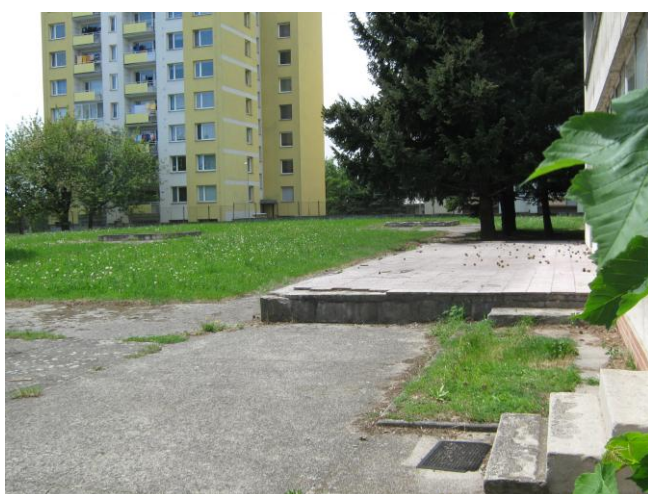
Pohled na vstup se třemi schodky a na verandu