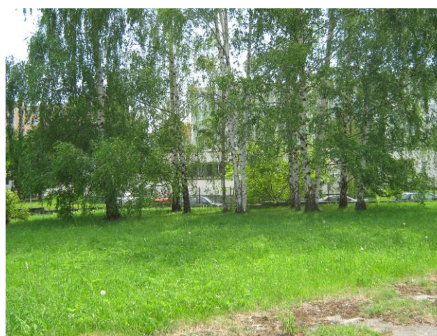
Pohled na zahradu a okolo stojící auta