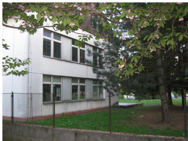
Pohled na roh budovy s rozbitým plotem, verandou a částí zahrady