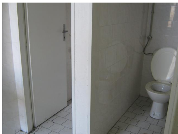
Pohled na toalety