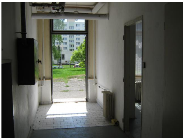
Pohled na vstupní prostory s vchodem do vedlejší místnosti