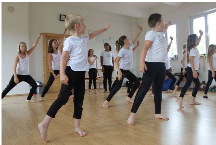
Příloha L - Muzikál