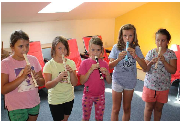
Příloha E - Hra na zobcovou flétnu