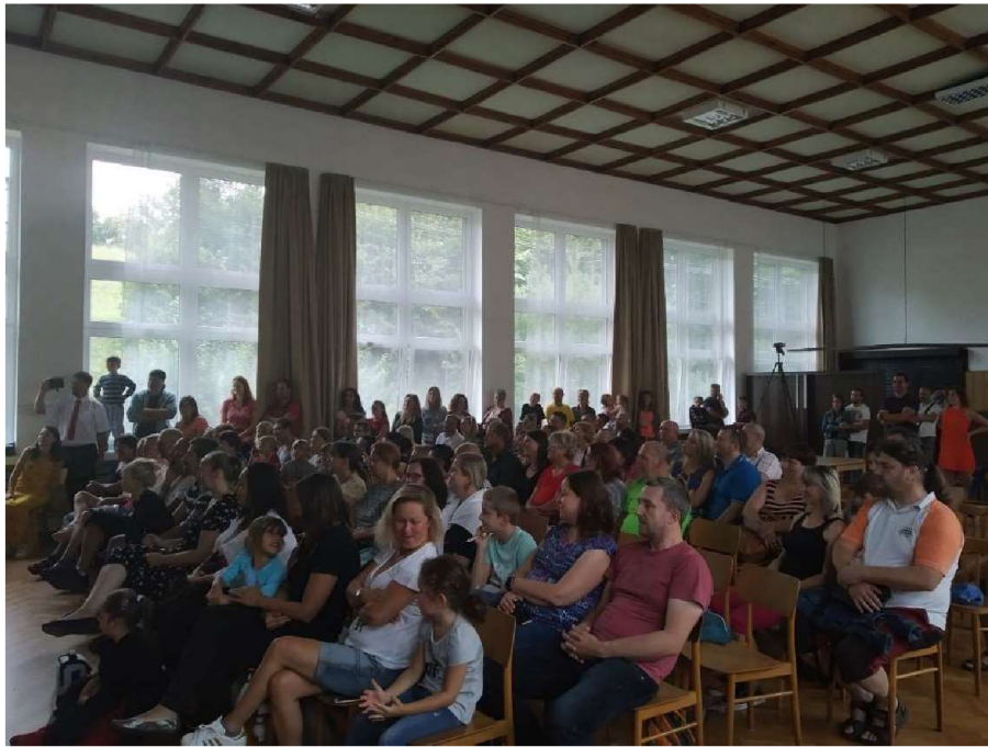
Příloha J - Závěrečné vystoupení