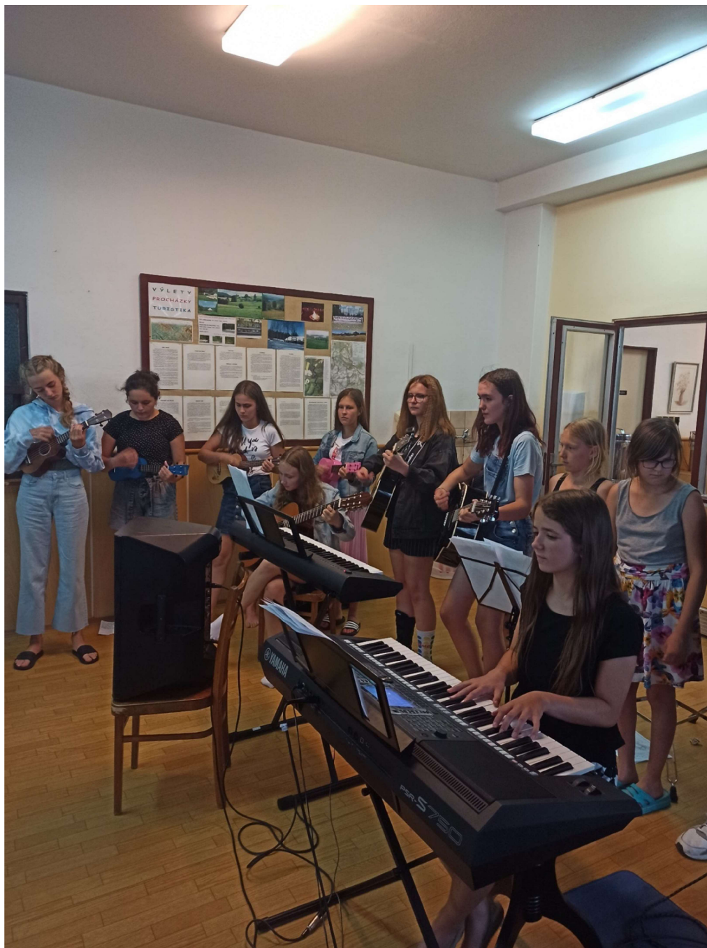
Příloha I - Hra a zpěv v kapele