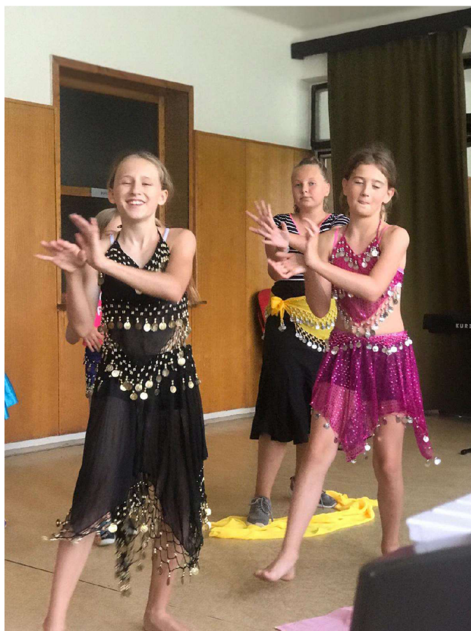
Příloha H - Orientální tance