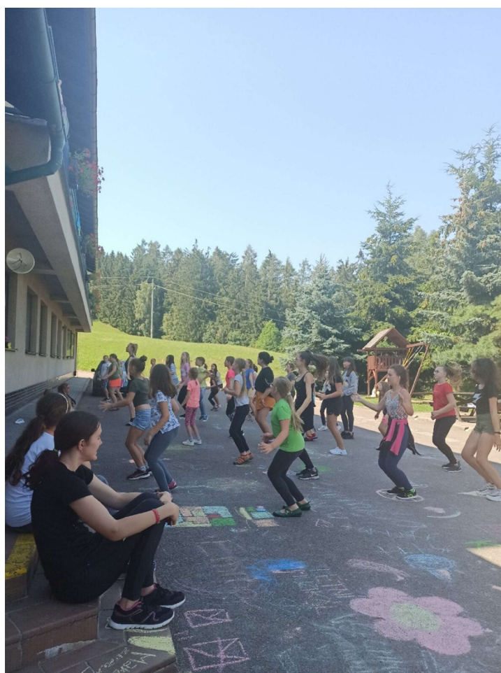
Příloha F - Skupinový tanec