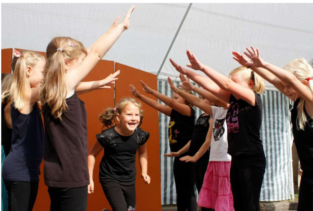
Příloha G - Muzikálové vystoupení