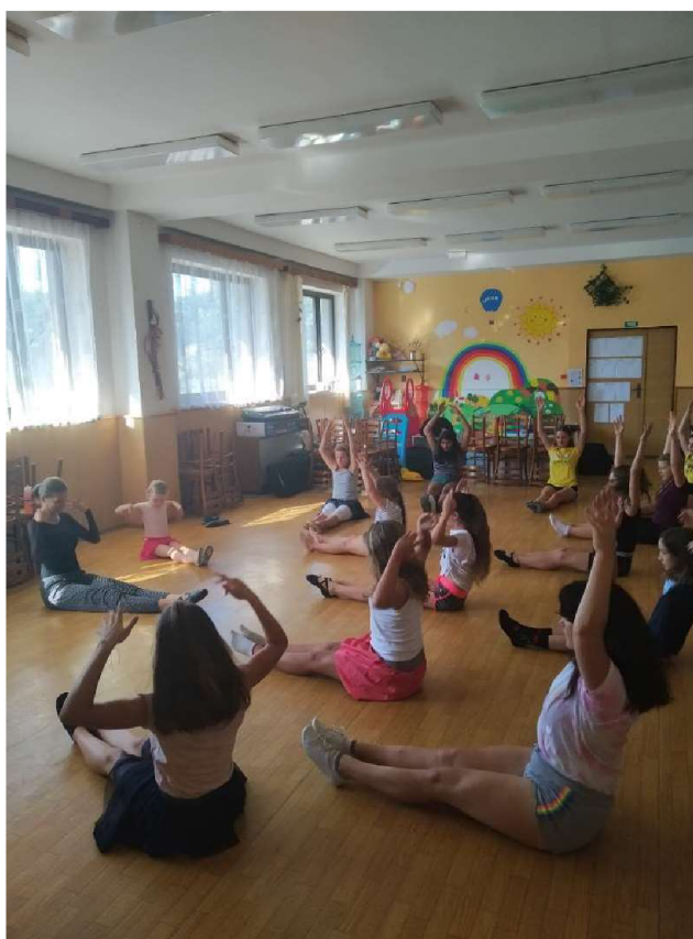
Příloha K - Balet