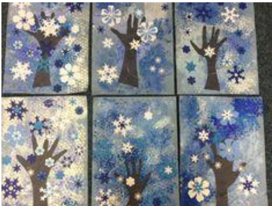
Příloha č. 20