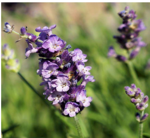
Obrázek 5: Lavandula latifolia – květ