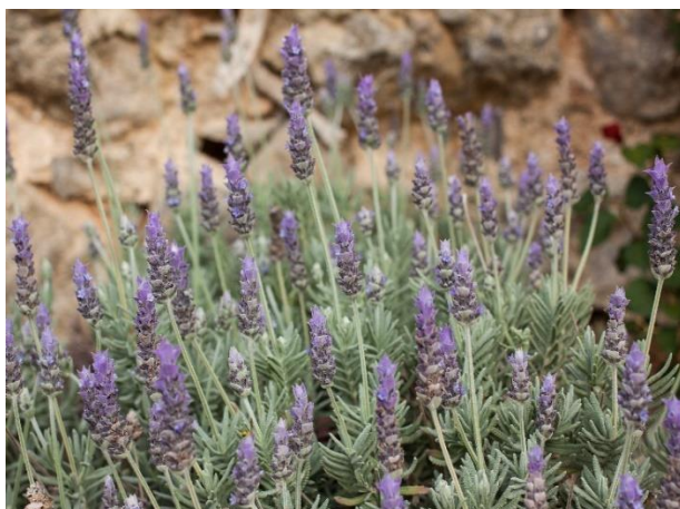
Obrázek 10: Lavandula dentata