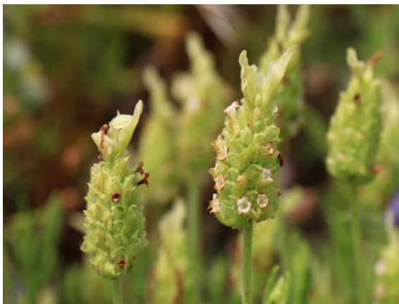
Obrázek 15: Lavandula viridis – květ