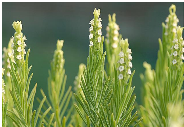
Obrázek 14: Lavandula viridis

Lavandula viridis (Obrázek 14 a 15) je snadno rozpoznatelná podle svých bílých až žlutých květů vyrůstajících ze světle zelených listenů (Bader 2012). Jedná se o vzpřímený polokeř vyrůstající do výšky 30 až 50 cm. Listy jsou zelené barvy, čárkovitého tvaru a jsou pokryty výrazným hustým žláznatým indumentem, který je lepkavý a díky vysokému obsahu kafru má vůni podobnou citrusům (Upson 2002). Kvete od konce jara do léta, preferuje lokalitu na přímém slunci nebo velmi lehký částečný stín. Snese teploty až 5 °C pod nulou (Mason 2014). Výskytem je původní v oblastech jihozápadního Španělska, jižního Portugalska a v poměrně nízkých nadmořských výškách na Madeiře (Upson 2002).