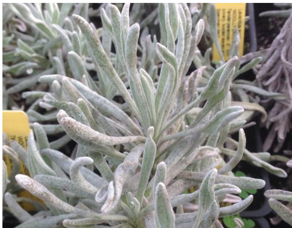
Obrázek 6: Lavandula lanata

roste na kamenitých, vápenitých a dolomitových půdách v nadmořské výšce 800 až 2000 metrů (Barrero et al. 2008).