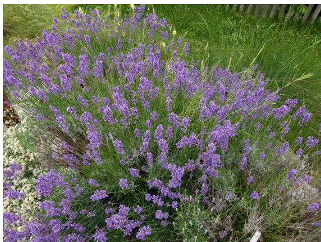
Obrázek 4: Lavandula latifolia