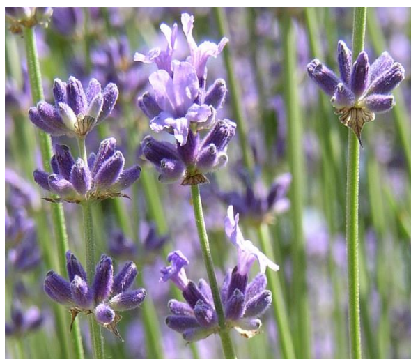
Obrázek 3: Lavandula angustifolia – květ