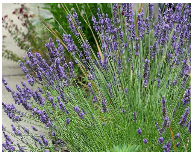
Obrázek 8: Lavandula x intermedia

Přirozený výskyt těchto mezidruhových hybridů je ve Španělsku, Francii a Itálii, kde se obě rodičovské rostliny setkávají (Upson 2002). Vzhledem k nárokům mateřských rostlin na stanoviště lze lavandin nalézt na plném slunci na suchých, dobře odvodněných, kamenitých, vápenatých půdách (Pokajewicz et al. 2023a).