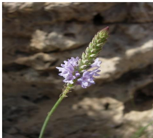
Obrázek 19: Lavandula subnuda – květ