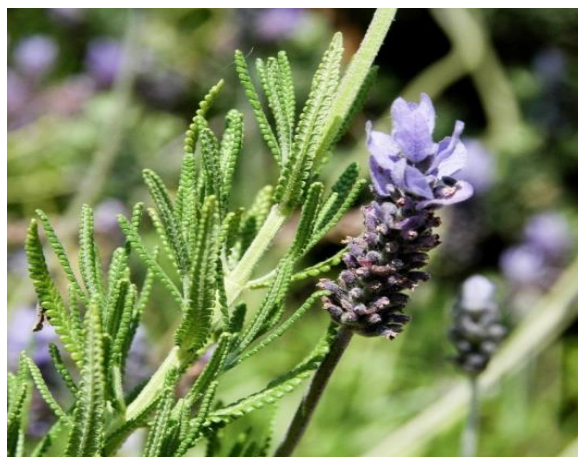
Obrázek 11: Lavandula dentata – květ