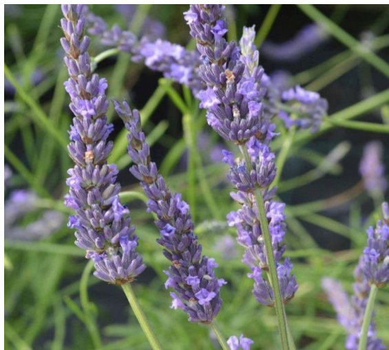
Obrázek 9: Lavandula x intermedia – květ