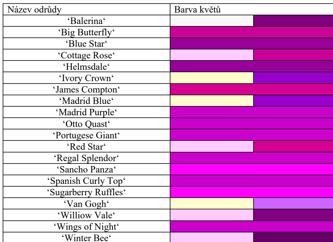
Tabulka 4: Přehled pěstovaných odrůd Lavandula stoechas . Zpracováno podle Bader (2012).

také ve vysokých teplotách (Bader 2012). Přehled pěstovaných odrůd Lavandula stoechas uvádí tabulka 4.