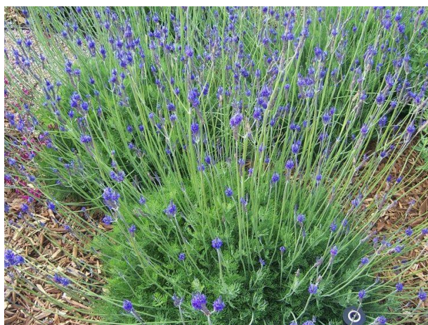
Obrázek 16: Lavandula multifida

Lavandula multifida (Obrázek 16 a 17) představuje polokeř dorůstající výšky až 70 cm, může nabývat nepravidelných tvarů (Mason 2014). Stonky jsou plstnaté s krátkými rozvětvenými a dlouhými bílými chlupy. Lodyha květenství bývá obvykle na bázi větvená, květní klas je 5-8 cm dlouhý. Listy jsou zpeřené až dvouzpeřené, 3-6 cm dlouhé. Koruna je dvoubarevná, spodní laloky přecházejí z fialové do modrofialové s tmavšími liniemi (Upson 2002).