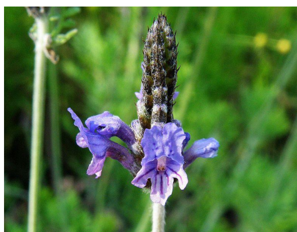
Obrázek 17: Lavandula multifida – květ