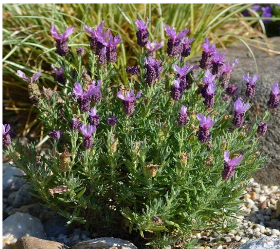
Obrázek 12: Lavandula stoechas

Levandule smilovitá je polokeř vyrůstající do výšky 40-70 cm. Listy jsou čárkovitě kopinaté, často šedě plstnaté. Květenství je husté, vrchol bývá zakončen zvětšenými obvejčitými nebo lopatkovými květními listy o délce 1-2 cm. Listeny jsou drobné, kalich je přisedlý, střední lalok je přeměněn na přívěsek. Koruna je fialové až černo fialové barvy, existují však také bílé nebo růžové varianty (Obrázek 12 a 13). Je rozšířená po celé středomořské pánvi, pěstuje se především ve Španělsku pro extrakci esenciálních olejů v malém měřítku. V některých částech Austrálie je nyní klasifikována jako invazivní plevel a její pěstování je přísně kontrolováno (Upton 2002).