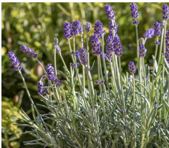
Obrázek 2: Lavandula angustifolia