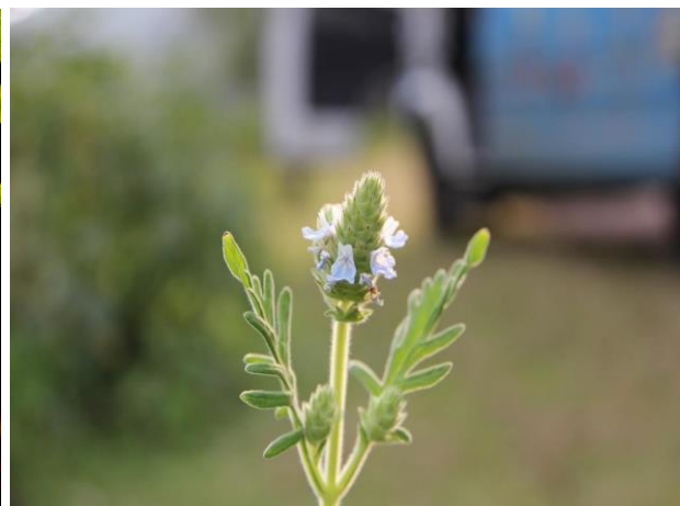
Obrázek 21: Lavandula gibsonii – květ