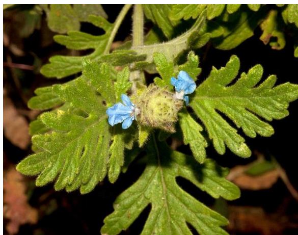
Obrázek 20: Lavandula gibsonii

Jedná se o bylinné rostliny s dužnatými stonky s dlouhými internodii. Listy jsou četné, zpeřené a obvykle velké 7-10 cm. Koruna se od ostatních druhů liší spodním středním korunním lalokem, který je zřetelně větší než postranní laloky. Tato sekce zahrnuje dva původní indické druhy, které mimo specializovaných sbírek nejsou běžně pěstované. Jedná se o velmi křehké rostliny, které obtížně přezimují (Upson 2002). Svým vzhledem skoro vůbec nepřipomínají ostatní druhy levandulí (Mason 2014). K zástupcům této sekce patří Lavandula gibsonii (Obrázek 20 a 21).