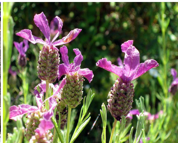
Obrázek 13: Lavandula stoechas – květ