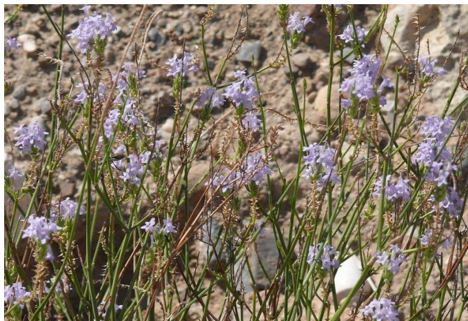
Obrázek 18: Lavandula subnuda

představují důležité centrum diverzifikace rodu (Upson 2002). K zástupcům této sekce patří Lavandula subnuda (Obrázek 18 a 19).