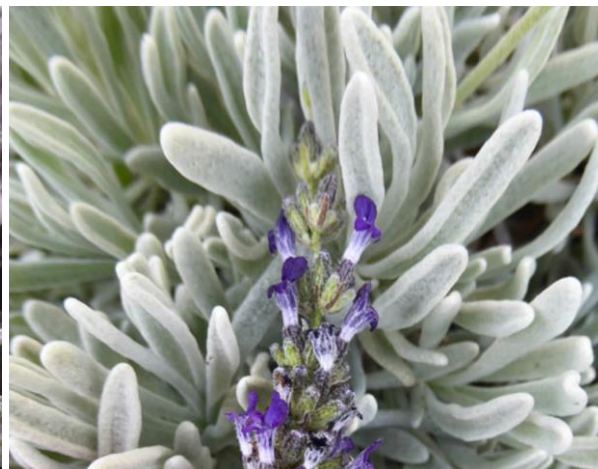
Obrázek 7: Lavandula lanata – květ