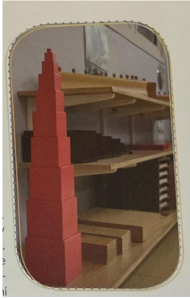
Obrázek č. 2: Aktivita pro smyslovou výchovu (Seldin, 2017)