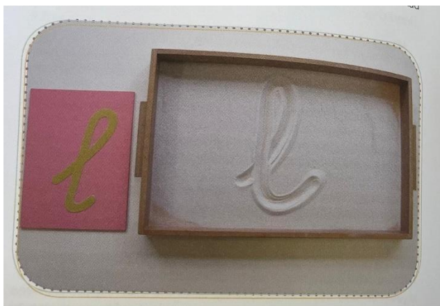
Obrázek č. 3: Aktivita pro jazykovou výchovu (Seldin, 2017)