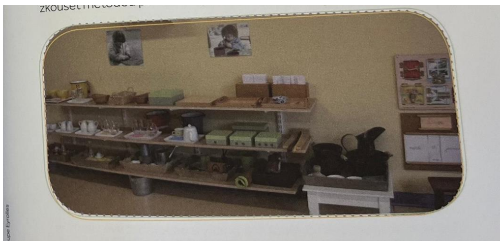
Obrázek č. 1: Aktivita pro praktický život (Seldin, 2017)