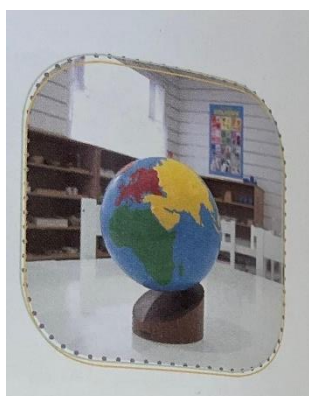
Obrázek č. 6: Pomůcka ke kosmické výchově globus (Seldin, 2017)

Prostředí by pro děti v mateřské škole mělo být podnětné, mělo by umožňovat svobodný výběr pomůcek a svobodnou volbu v tom, jakým způsobem budou pracovat – zda se jim pracuje lépe samotným nebo v přítomnosti někoho jiného. S tím souvisí uzpůsobení třídy v rámci lavic. Lavice by měly být nové, měly by být uzpůsobené jak pro více dětí u jednoho stolu, nebo samostatně stojící stoly, kde dítě má možnost pracovat samostatně, měly by být také v několika výškových rovinách, aby každé dítě mělo možnost vybrat si takové místo, kde se cítí nejlépe a nejvíce komfortně. V rámci prostoru na práci s pomůckou by měly mít děti možnost vzít si kobereček, který si mohou umístit na podlahu a pracovat na zemi, pokud jim to vyhovuje více nebo to vyžaduje sama pomůcka, se kterou pracuje. V tomto případě dítě vždy musí mít pomůcku na koberečku, nesmí se pomůcka vyskytovat mimo určené místo, protože by se zvýšilo riziko ztráty nebo zničení pomůcky. Taky to v dětech posiluje zodpovědnost a nastavená pravidla, která v tomto případě pomáhají dítěti uvědomovat si, že pokud si pomůcku vybere,