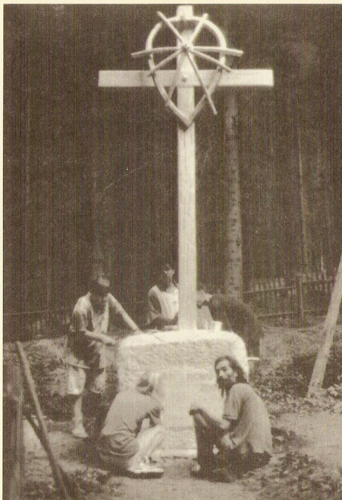
Pomník obětem cikánského tábora v Hodoníně, Eduard Oláh 1997 (Muzeum romské kultury v Brně)