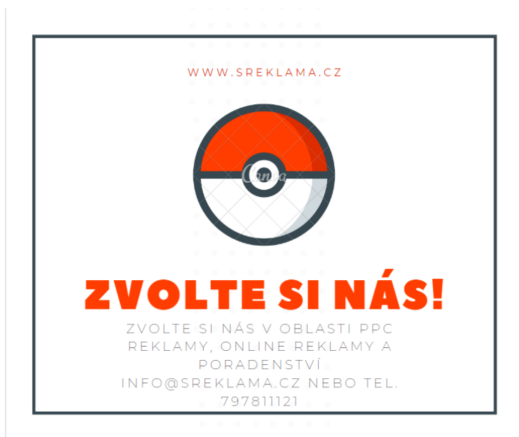
Obrázek 2 Ukázka případného příspěvku na Facebooku

Důležité je také zmínit, že by si společnost měla dát velkou práci s tím, aby příspěvek na Facebooku upoutal a vyčníval mezi ostatními reklamami. Příspěvek by měl mít především velký a poutavý nadpis, ve kterém bude jasně a stručně popsáno, co společnost nabízí, jak to nabízí a jaké jsou možnosti společnosti kontaktovat. To je klíčová část úspěchu každého příspěvku na internetu.