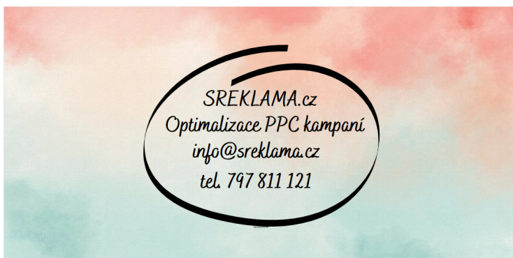
Obrázek 4 Návrh na reklamní banner na MHD dopravní prostředky