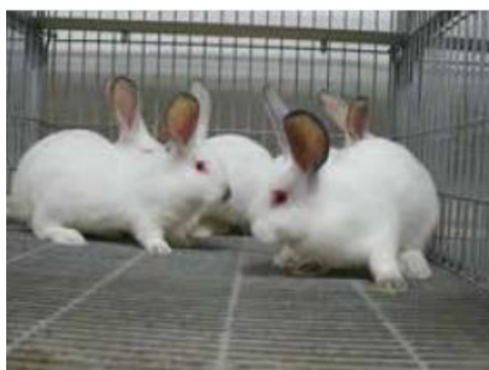
Králíci bezprostředně po odstavu

Jednopodlažní klece ( flat deck ) se osvědčily nejlépe; jejich hlavními výhodami jsou: dobrý přehled o stavu zvířat, optimální regulace výměny vzduchu, snadné udržování čistoty a hygieny chovu, snadná manipulace se zvířaty. Vícepodlažní klece se používají hlavně pro výkrm, kvůli nižší investiční náročnosti. Jejich výhodou je lepší využití stájového prostoru, nevýhodou jsou vyšší nároky na pracovní obsluhu (Lacina 1994).