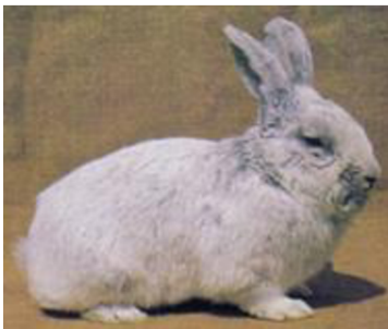
velký světlý stříbřitý

Obrázek 1: Některá masná plemena králíků (Fingerland 1991)