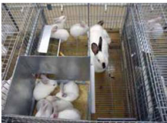
Králíci s mládřaty v době laktace