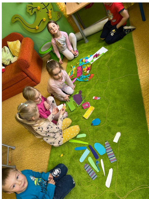
Obrázek č. 15 – Moje zahrádka