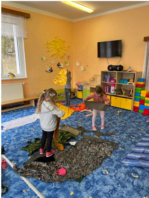
Obrázek č. 17 – Jarní krajina