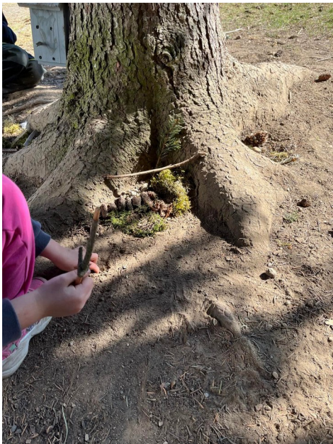
Obrázek č. 11 - Land-art – domeček pro broučky