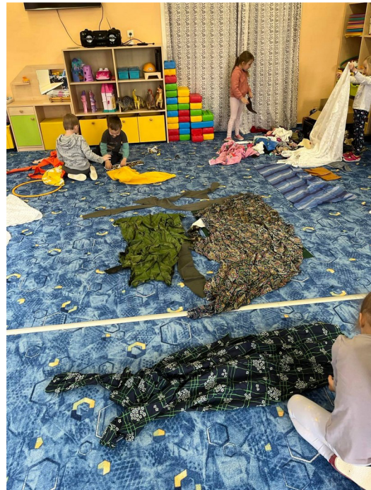
Obrázek č. 18 – Jarní krajina