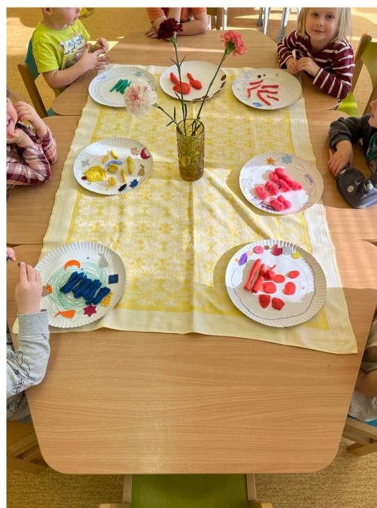
Obrázek č. 8 – Talířku, prostři se!