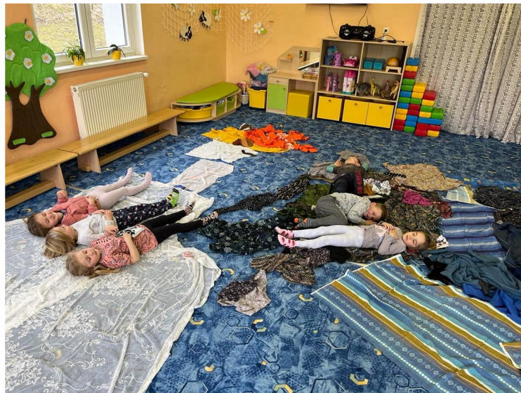
Obrázek č. 19 – Jarní krajina