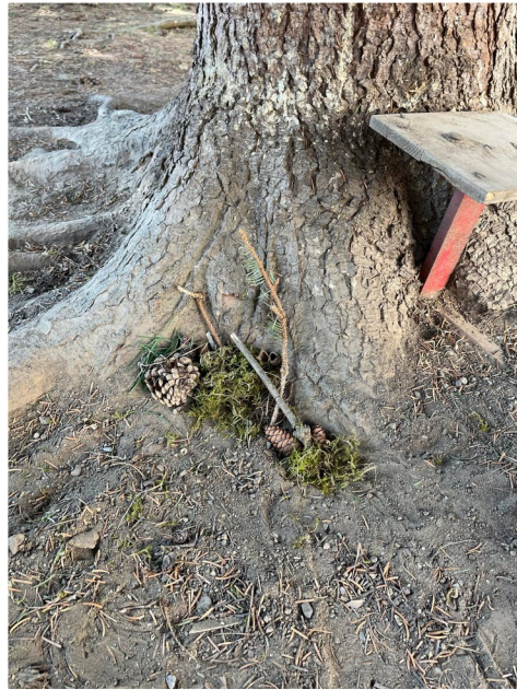
Obrázek č. 10 – Land-art – domeček pro broučky