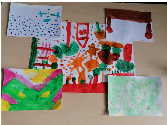
Obrázek č. 1 – 4. roční období