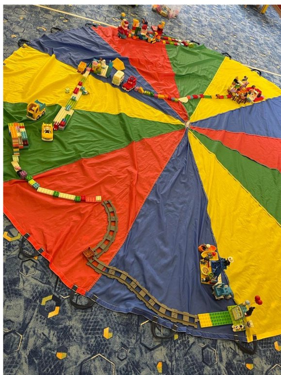
Obrázek č. 22 – Naše město