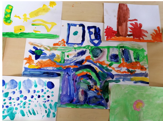
Obrázek č. 2 – 4. roční období