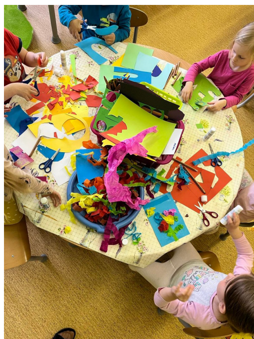
Obrázek č. 14 – Moje zahrádka