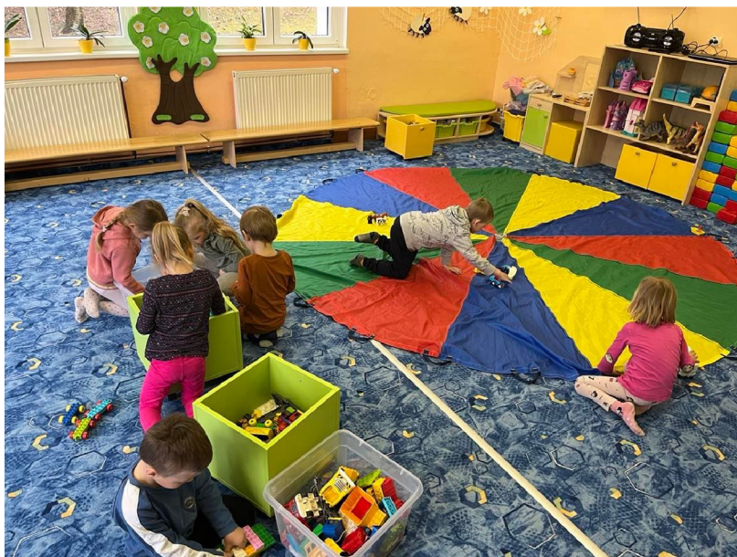
Obrázek č. 20 – Naše město