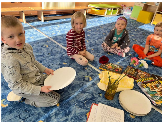
Obrázek č. 5 – Talířku, prostři se!