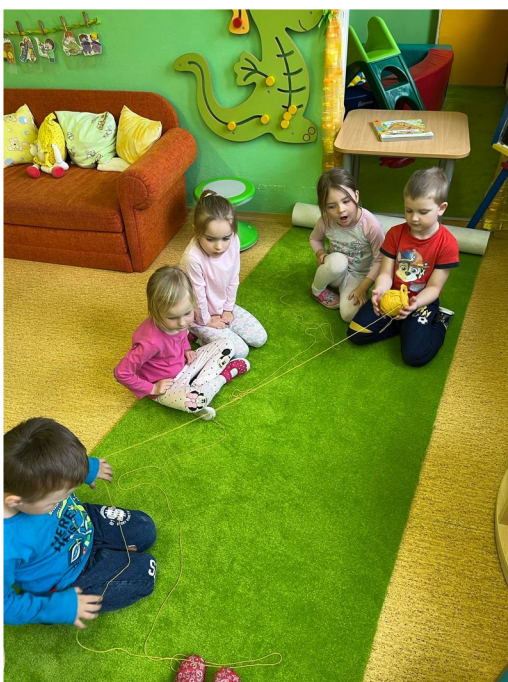
Obrázek č. 13 – Má zahrádka