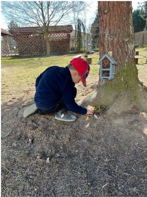
Obrázek č. 9 – Land-art – domeček pro broučky