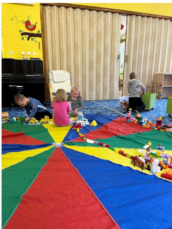
Obrázek č. 21 – Naše město