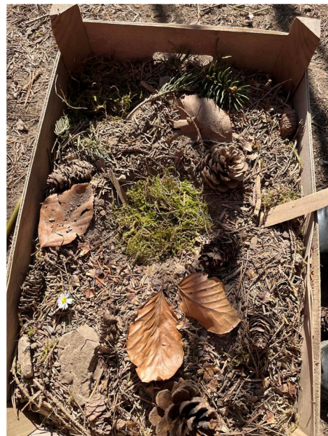
Obrázek č. 12 - Land-art – domeček pro broučky