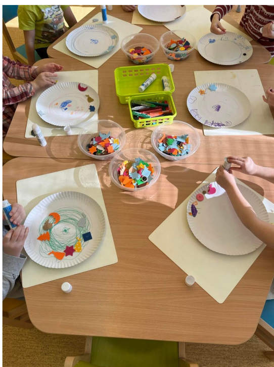
Obrázek č. 7 – Talířku, prostři se!