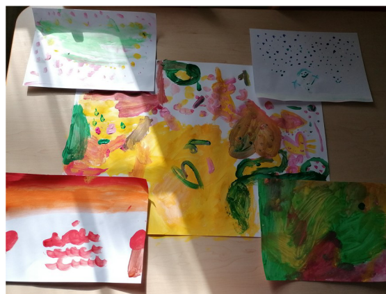
Obrázek č. 4 – 4. roční období