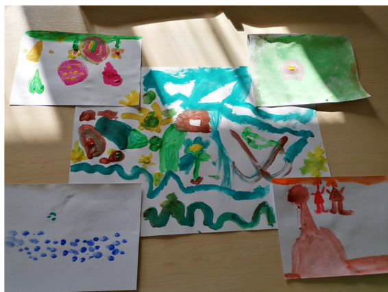
Obrázek č. 3 – 4. roční období