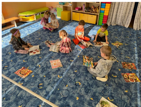
Obrázek č. 6 – Talířku, prostři se!