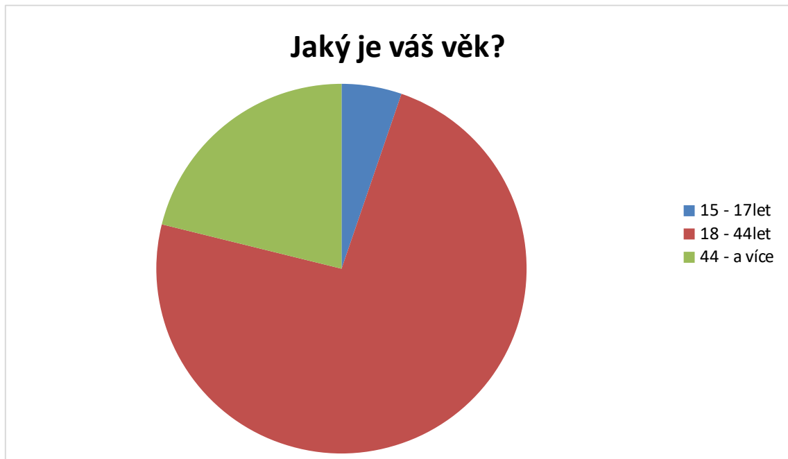
Graf 2 – Věk

Věkové skupiny byly rozděleny do třech kategorií, první kategorie je zaměřena na nezletilé osoby ve věku 15 – 17let. Dotazník vyplnilo 49 (5,6 %) jedinců tohoto věku. Dospělost byla dále rozdělena na mladší 18 – 44let a starší 45let a více. Šetření se účastnilo 616 (73,6 %) respondentů ve věku 18 – 44let a 177 (21,1 %) ve věku 45 let a více.