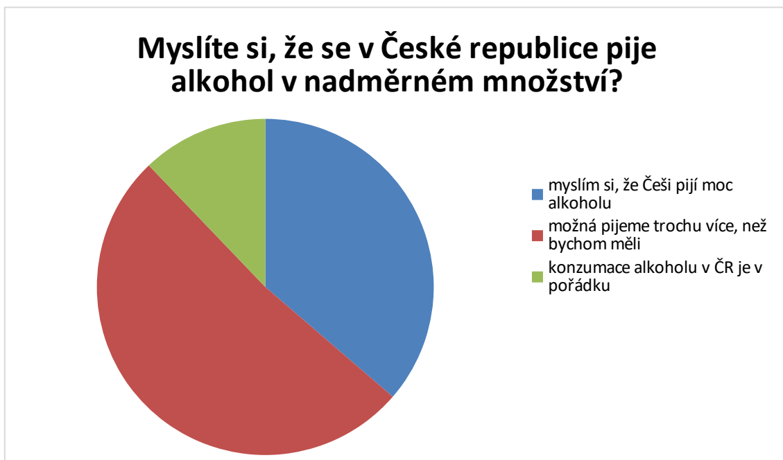
Graf 6 - Konzumace v ČR

50,9 % ji myslí, že možná pijeme trochu více alkoholu, než bychom měli. 35,9 % dotázaných se domnívá, že Češi pijí příliš alkoholu a 13,2 % si myslí, že konzumace v ČR je v pořádku.