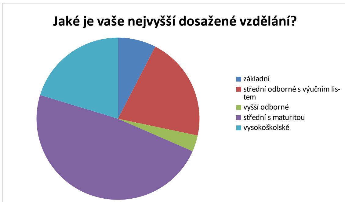
Graf 3 – Vzdělání

Z následujících výsledků vychází, že největší procento dotazovaných má střední školu s maturitou 401 (47,5 %). Druhá největší skupina má střední odbornou školu zakončenou výučním listem 173 (20,5 %) nebo vysokoškolské vzdělání 169 (20 %). Základní vzdělání má 63 jedinců (7,5 %) a vyšší odborné 27 (3,2 %).