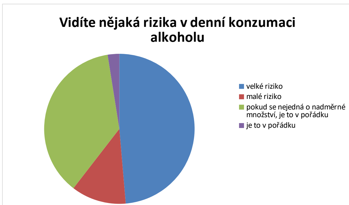
Graf 8 - Rizika v denní konzumaci

Ve srovnání s předchozí otázkou se zde již odpovědi značně lišili. V denní konzumaci vnímá velké riziko 48,6 % respondentů. Malé riziko 11,8 %. Přičemž 37 % respondentů nevnímá rizika v denní konzumaci, pokud se nejedná o nadměrné množství. Z otázky č. 4 vyplívá, že za nadměrné množství respondenti považují 2-5 sklenic, ovšem největší procento respondentů uvedlo množství 3 sklenic. 2,5 % nevnímá žádná rizika v denní konzumaci a vnímají jí, jako zcela v pořádku.