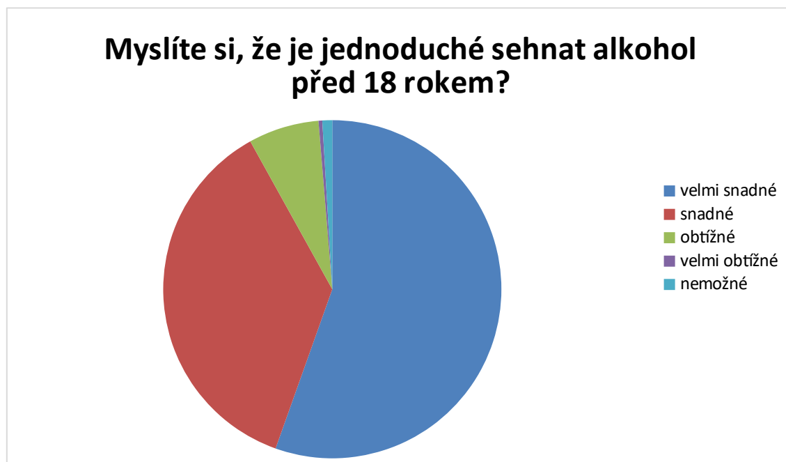
Graf 4 – Konzumace před 18 rokem

91,9 % respondentů považuje za snadné obstarat si alkohol před 18 rokem. Odpověď velmi snadné uvedlo 36,3 % a snadné 55,6 %. Za obtížné to považuje 6,7 % respondentů, velmi obtížné 0,4 % a nemožné 0,9 %.