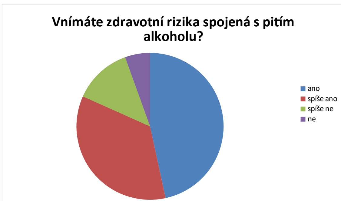
Graf 7 - Rizika

Zdravotní rizika spojení s konzumací alkoholu zcela vnímá 395 (46,6 %) respondentů. Možnost spíše ano uvedlo 297 (35,1 %). 157 (18,5 %) dotázaných nevnímá rizika spojená s konzumací alkoholu. Konkrétně 12,8% uvedlo možnost spíše ne a 5,5 % možnost ne.