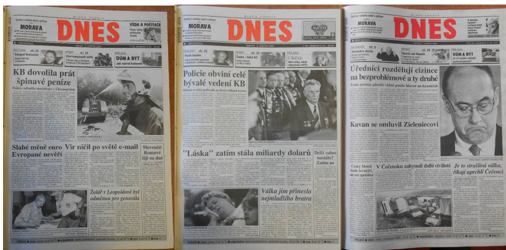
Obrázek č. 2 – Layout titulních stran v roce 2000