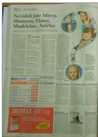
Obrázek č. 1 – Příklad specifického vizuálního prvku