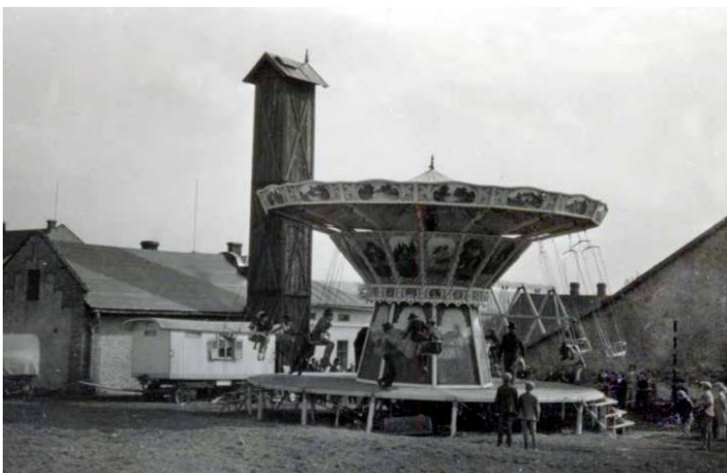
Obr. č. 4 – Řetízkový kolotoč, který býval na odpusti. Stojí vedle požární zbrojnice a hostince Horakůvka . Fotografie byla pořízena v roce 1933 (ŠINOVSKÝ, J. B.: Knižka o Šenově , s. 795).