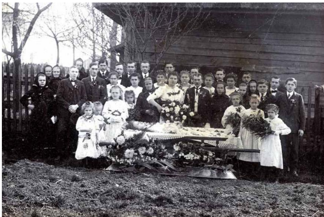
Obr. č. 1 – Pohřeb slečny Kempné ze Škrbně. Na fotografii z roku 1918 je zesnulá s celou rodinou a dalšími smutečními hosty (ŠINOVSKÝ, J. B.: Knižka o Šenově , s. 372).