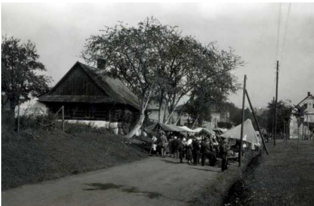
Obr. č. 3 – Pout' odpust. Hlavní cesta, kolem které jsou rozestavěné stánky. Vlevo za stromy se nachází hostinec Horakůvka , v němž se konala nejedna zábava. Fotografie je pořízena v roce 1932 (ŠINOVSKÝ, J. B.: Knižka o Šenově , s. 619).