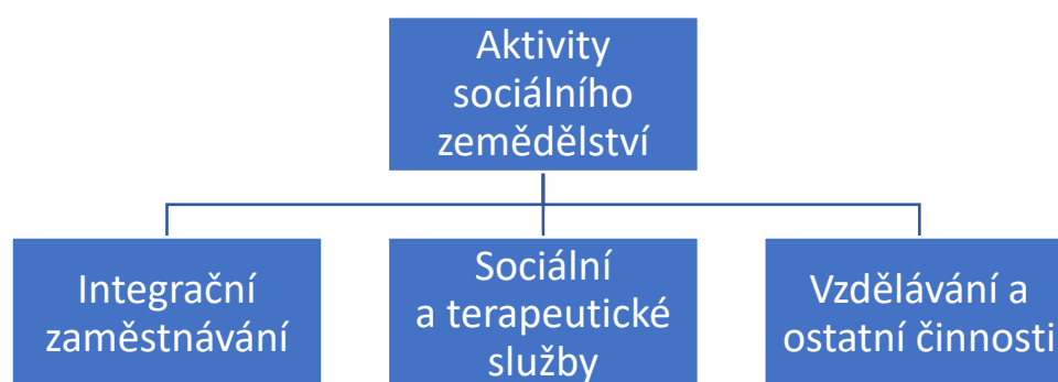
Schéma 1 – Aktivity sociálního zemědělství

Zdroj: vlastní zpracování na základě díla Chovance (2016)