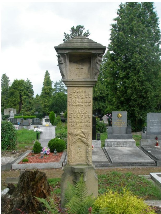
Obrázek 3 – Hrob Viktora Heegera s pomníkem na hřbitově v Opavě