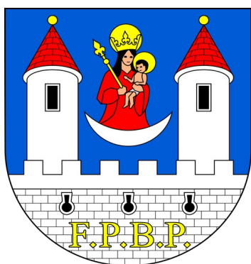
Obrázek č. 1 – Znak městyse Pecka

Městys Pecka se nachází v Královéhradeckém kraji, na severovýchodě okresu Jičín, poblíž města Nová Paka. Leží v nadmořské výšce 407 m. n. m. a jeho katastrální výměra je 2 303 ha. Taktéž se nachází nedaleko chráněné krajinné oblasti Český ráj. Součástí obce je dalších osm místních částí, jedná se o obce: Lhota u Pecky, Bělá u Pecky, Staňkov, Kal, Vidonice, Bukovina u Pecky, Arnoštov a Horní Javoří. Obec se řadí do svazku obcí Novopacko, sdružení obcí Podzvičinsko a svazku obcí Lázeňský mikroregion (městys Pecka, 2022).