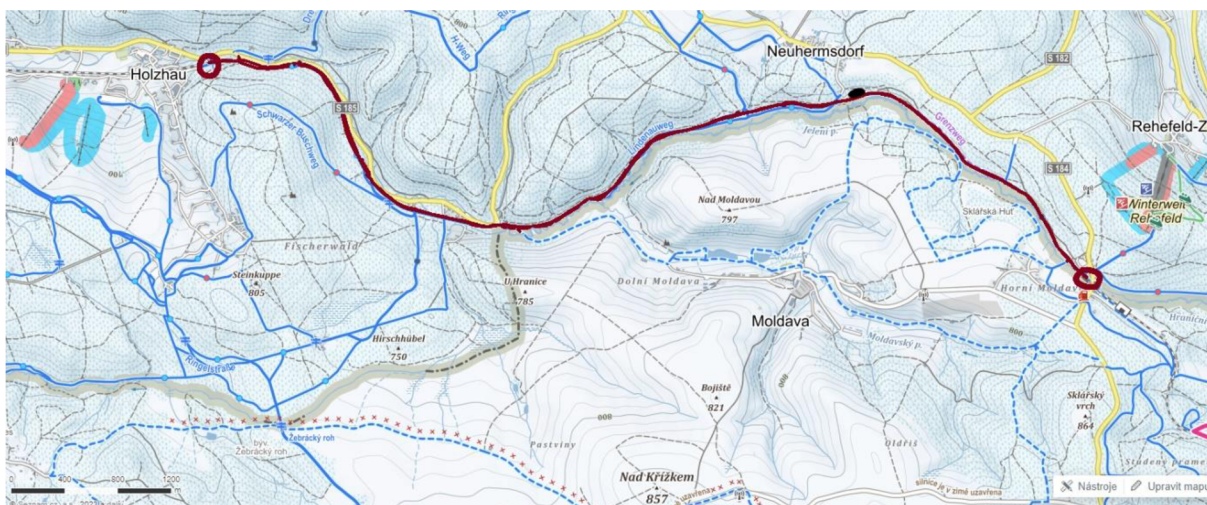
Obr. 5 – Mapa okolí Moldavy. Tmavě červenou barvou je vyznačena přibližná trasa bývalého tělesa trati spojujícího Moldavu a Holzhaus, tmavě červené kroužky označují současné konce železničních tratí na české a německé straně. Černý ovál označuje bývalé nádraží, upraveno. 54

Odhadované náklady na obnovu úseku mezi Moldavou a Holzhaus byly společností LISt odhadnuty společností LISt na 49,216 mil. € netto a 58,568 mil. € brutto, přičemž studie nepočítala s projekčními náklady. Společně se společností VCI pak konstatuje, že trať by byla v naprosté většině případů využívána ve spojení s turistickým ruchem.