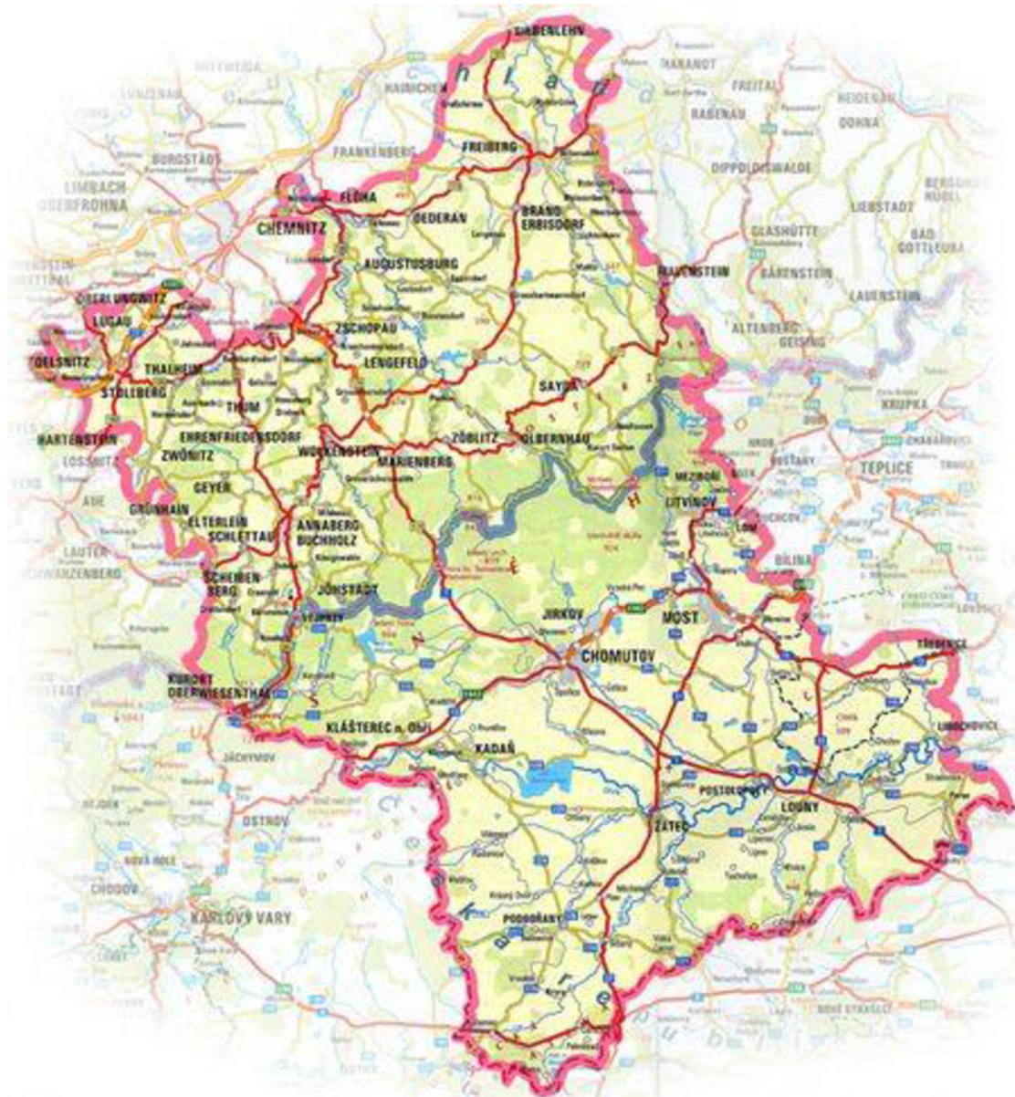
Obr. 4 – Mapa euroregionu Krušnohoří 48

euroregion do okresů Mittel-Sachsen a Erzgebirgskreis. Nejedná se o neprostupné území a je možné k euroregionu připojit, pokud o to organizace požádá. 47