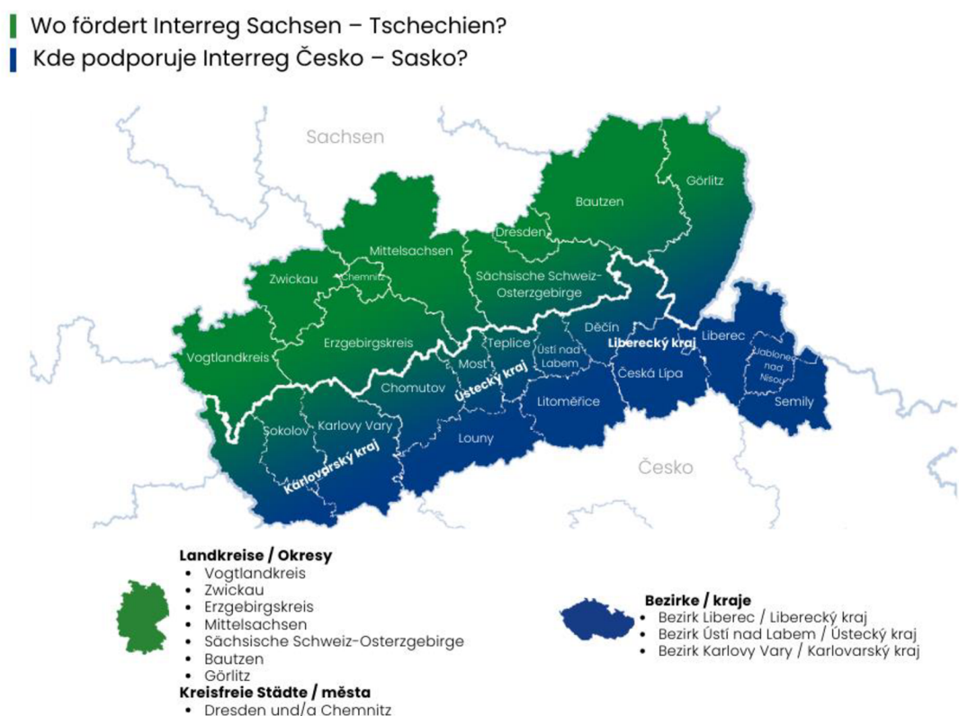
Obr. 3 – Mapa programového území Interreg Česko-Sasko 45

Program Interreg se stará o financování velkých projektů. Tyto projekty jsou charakterizovány delší dobou trvání a rozpočtem vyšším než 30 tis. €. Na financování menších projektů do 30 tis. € (maximální podpora činí 20 tis. €) jsou připraveny tzv. Euroregiony. Ty působí na území programu Interreg Česko - Sasko celkem čtyři: