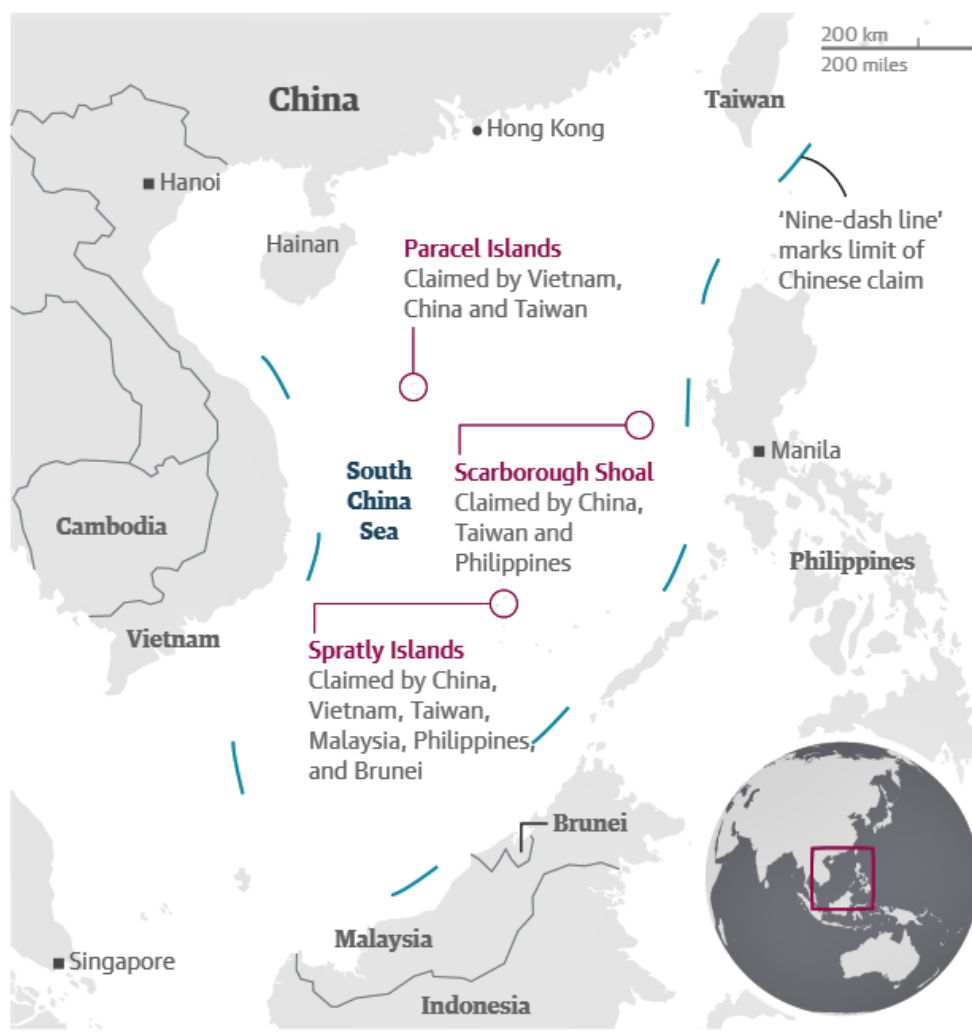
Příloha č. 2: Znárodnění nároků jednotlivých států na konkrétní soustroví