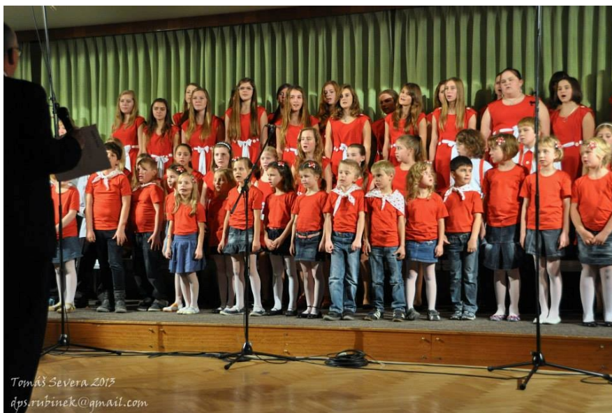
Setkání Rubínku k příležitosti 20. Výročí založení sboru