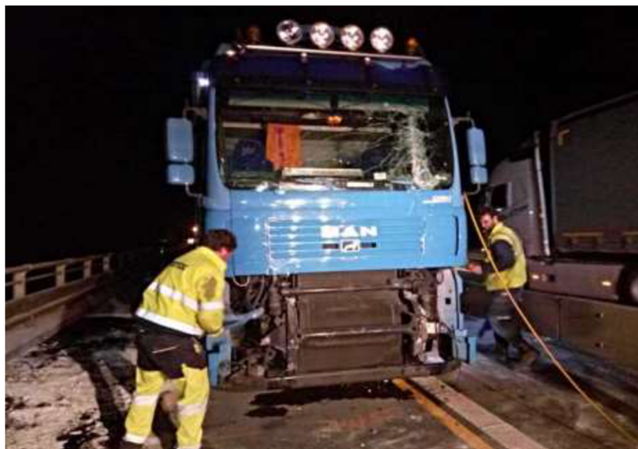
Obrázek č. 4 – Dopravní nehoda – nákladní automobil

Nehoda (1) se stala 12.5.2017 jednalo se o rumunský kamion, který převážel kyselinu fosforečnou, která se následně vylila na vozovku. Zde vybírám z fakturace úkony k ověření výpočtu cen pomocí kalkulace.