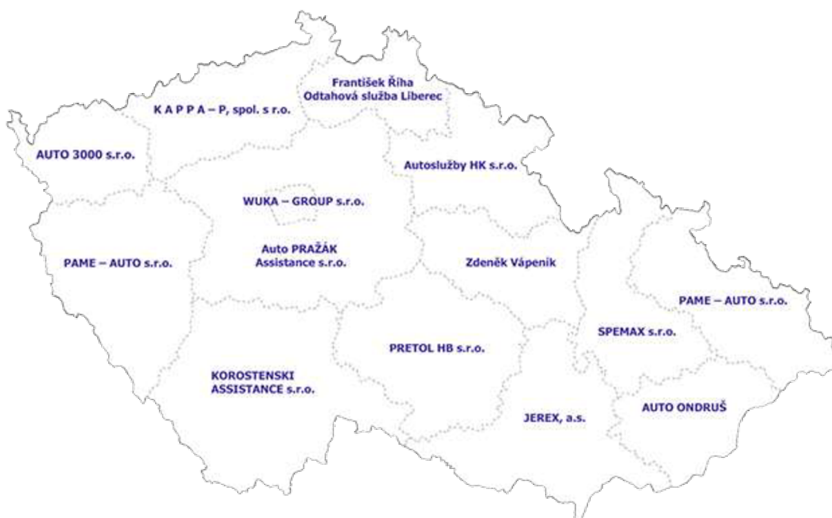
Obrázek č. 1 - Vymezené oblasti odtahových firem

Při vzniku dopravní nehody záleží na okolnostech, za kterých se nehoda stala. Pokud havarované vozidlo zablokuje celý jeden směr (všechny jízdní pruhy) je nutné