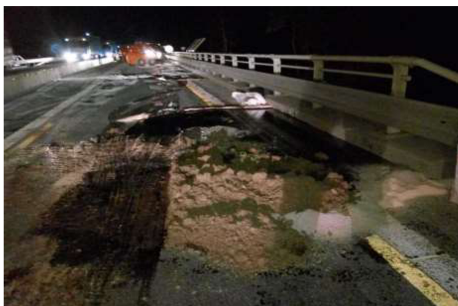
Obrázek č. 6 – Dopravní nehoda - odklizení následků