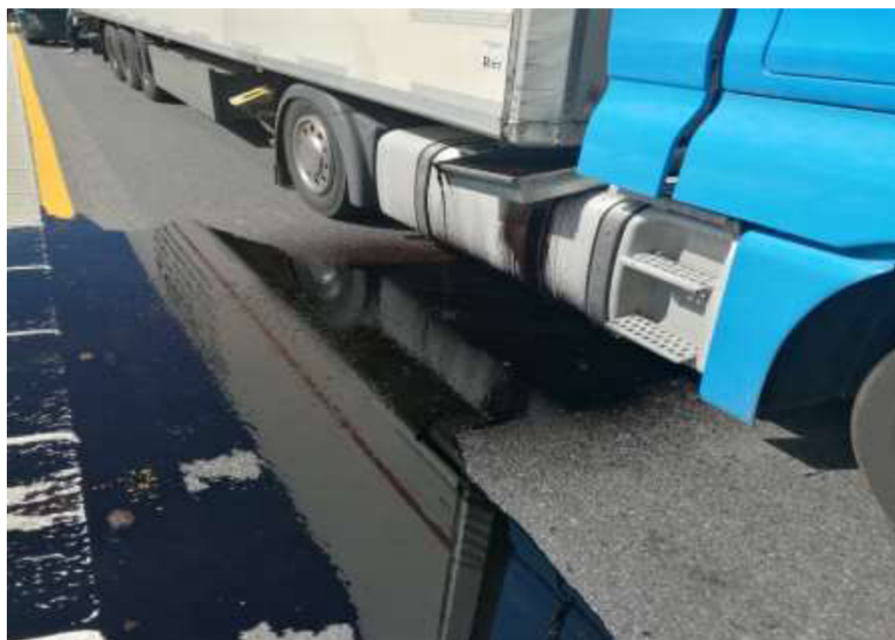
Obrázek č. 5 – Dopravní nehoda – únik provozních kapalin