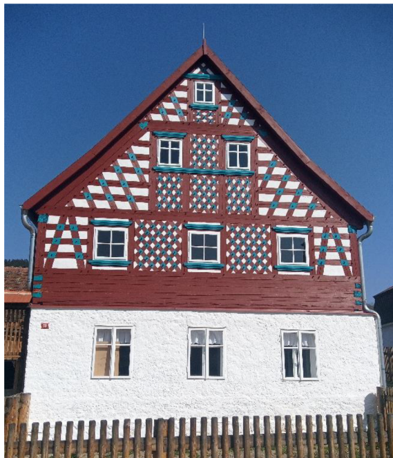
Obrázek 2: Příklad typického hrázdění v tzv. Chebském stylu, Statek Milíkov č. p. 18.