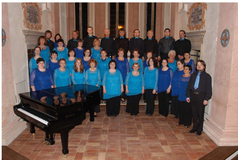
Archiv sboru Smetana