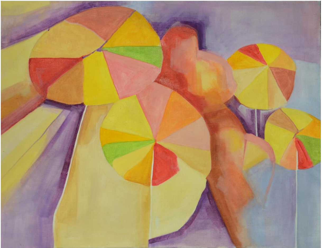
Cukrátko, olej na plátně 70x90 cm