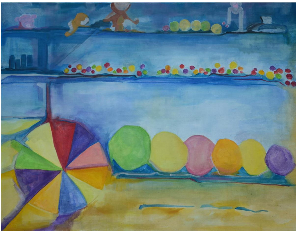
Střelnice, olej na plátně 70x90 cm