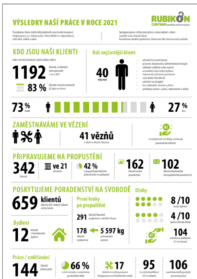
Obrázek 4 - Výsledky práce RC 2021

Ze všech klientů tvořily 27 % ženy, což je 321 klientek za rok 2021 (Rubikon Centrum, 2021).