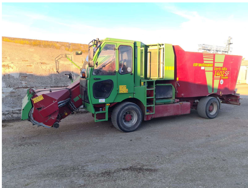
Obrázek č. 9. Krmný vůz Strautmann Verti - Mix 1402 SF Double