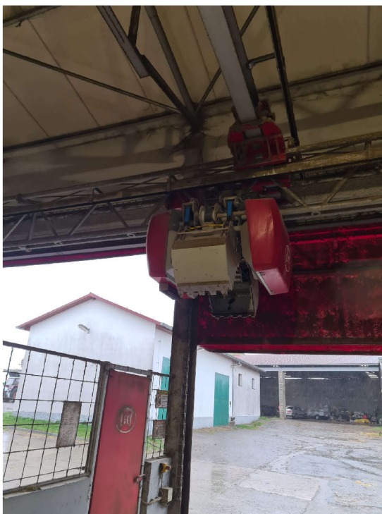
Obrázek č. 8. Nakládací portálový jeřáb krmného robota (Autor: Pavel Hron)