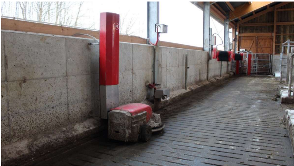
Obrázek č. 11. Čistič stáje Lely Discovery