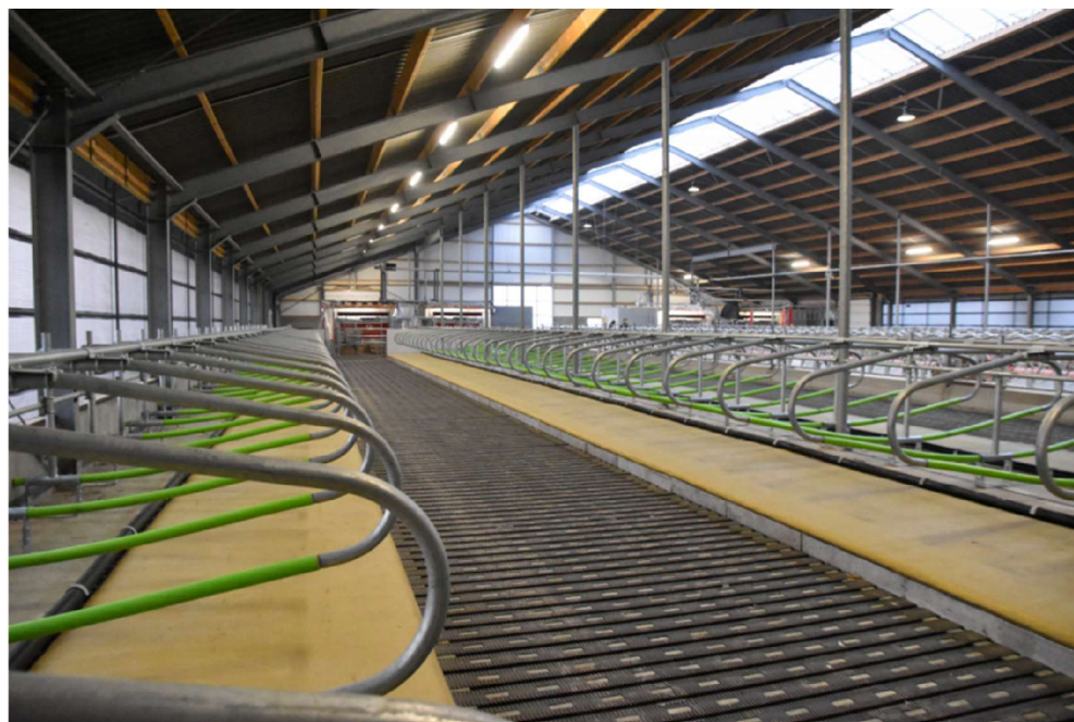
Obrázek č. 4. Vysoké boxové lože