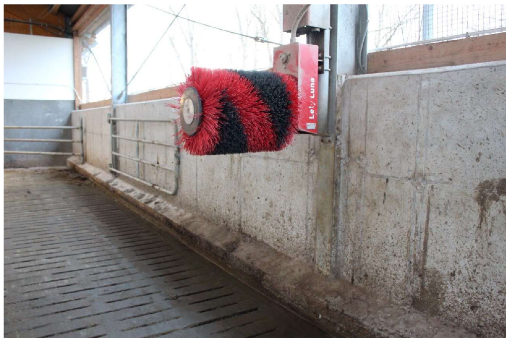
Obrázek č. 10. Automatické drbadlo Lely Luna (Autor: Pavel Hron)