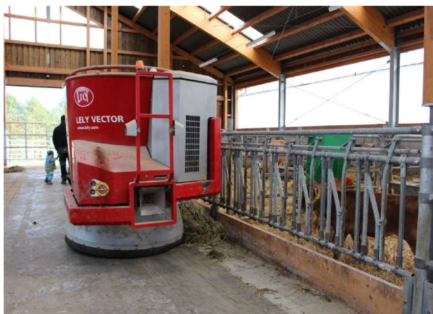
Obrázek č. 6. Automatický krmný robot Lely Vector