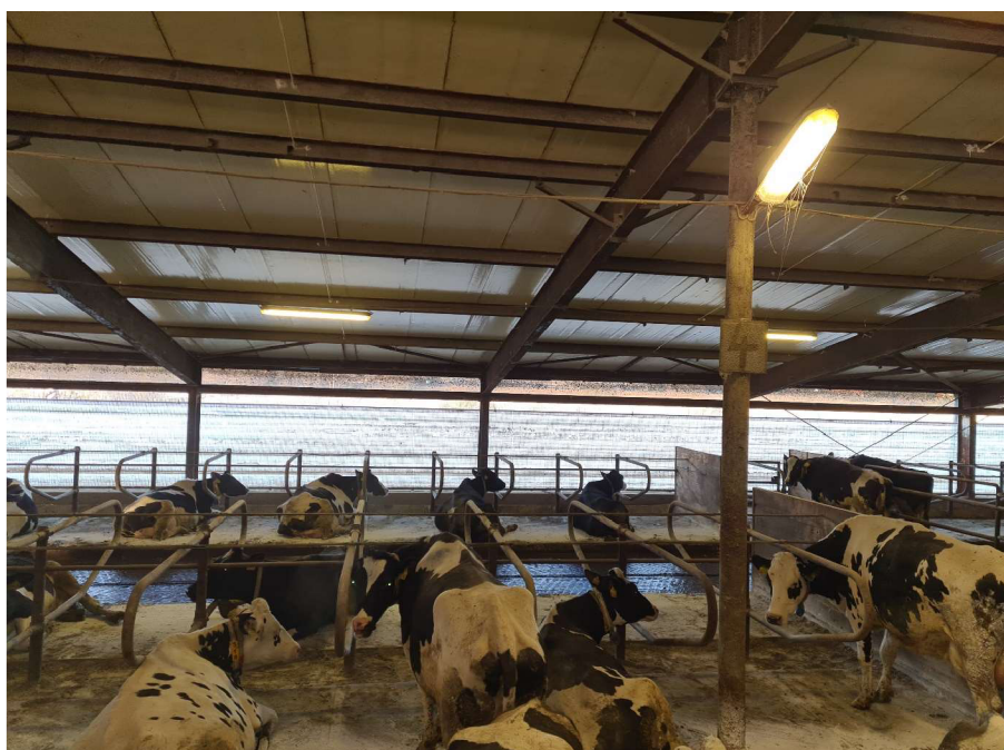
Obrázek č. 2. Volné boxové ustájení