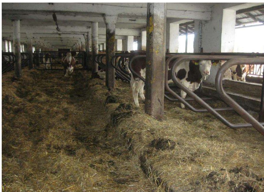
Obrázek č. 1. Kombinovaný box (Autor: Pavel Hron)