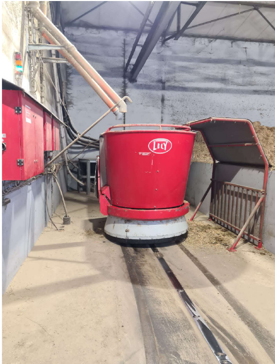
Obrázek č. 7. Automatický krmný robot Lely Vector (Autor: Pavel Hron)