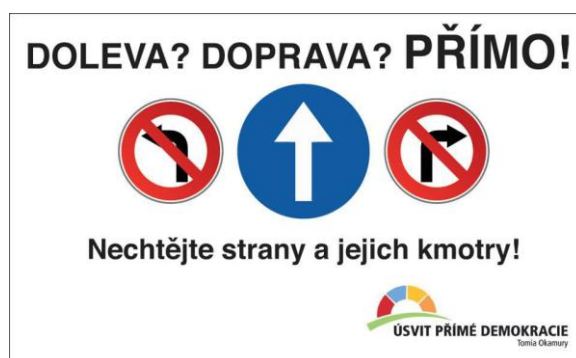
Obrázek č. 6