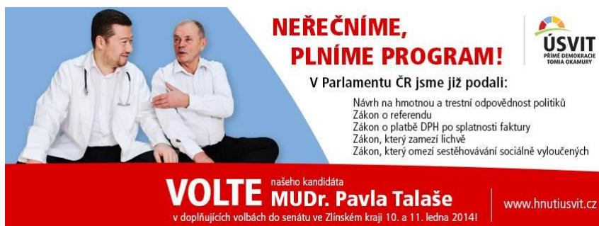
Obrázek č. 11