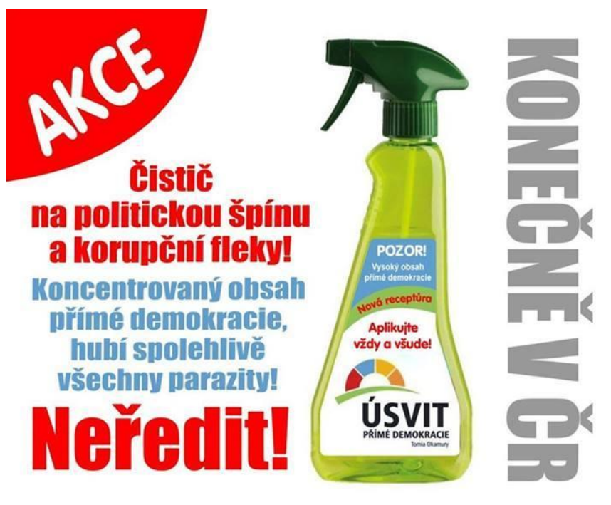
Obrázek č. 5