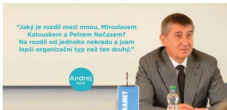
Obrázek č. 5