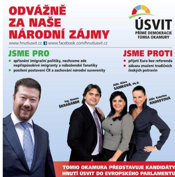
Obrázek č. 10