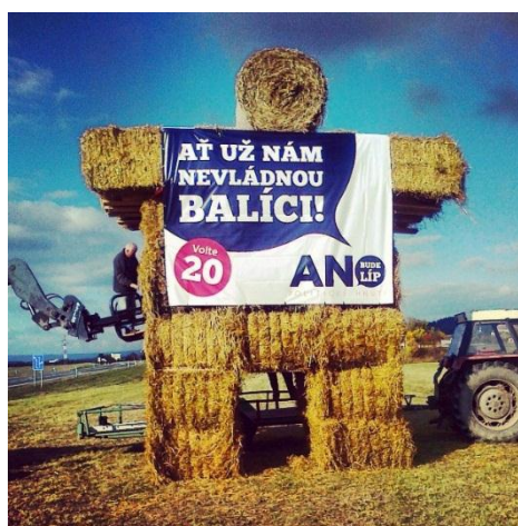
Obrázek č. 6