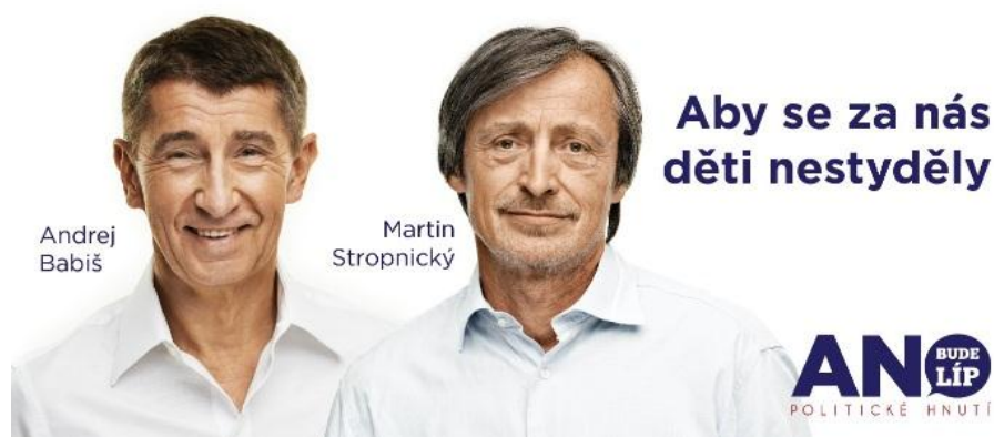
Obrázek č. 9