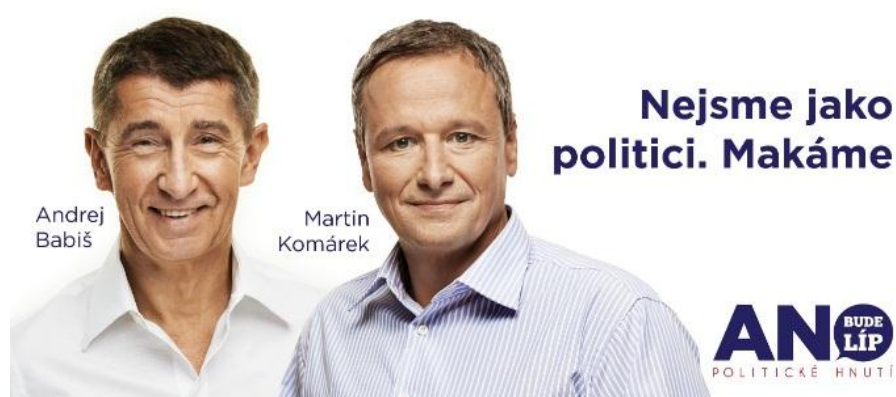
Obrázek č. 8