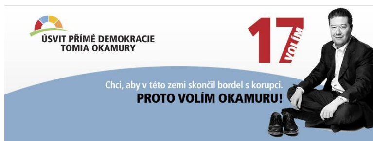
Obrázek č. 9