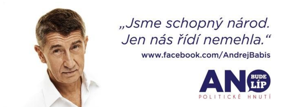
Obrázek č. 7