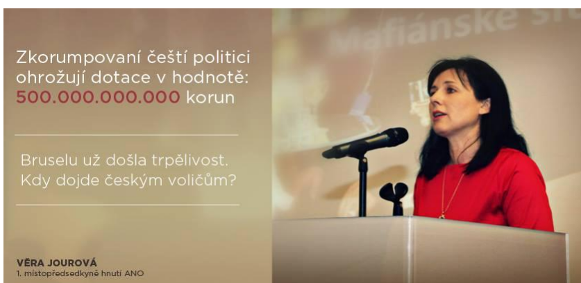
Obrázek č. 3