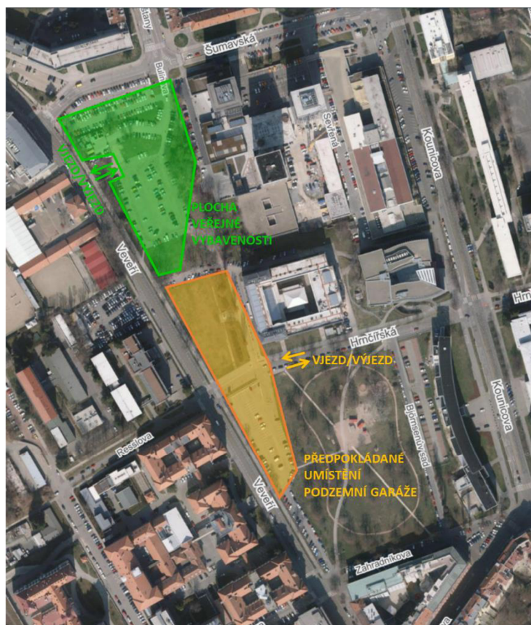
Obrázek 4: Umístění navrhaných parkovacích prostor