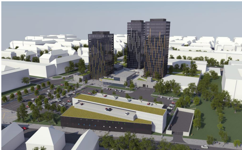
Obrázek 1: Vizualizace plánovaného parkovacího domu u výškových budov [4]

V severní části se nachází rozsáhlá, částečně nezpevněná parkovací plocha u výškových budov Šumavská. V novém územním plánu města Brna je tato plocha označena jako zastavitelná rozvojová plocha pro veřejnou vybavenost městského či nadměstského významu, po prověření zde může být umístěna výšková budova [2]. V současnosti plánuje město Brno v této oblasti postavit parkovací dům s kapacitou 411 parkovacích stání a dalších 190 parkovacích stání na přilehlém parkovišti [3].