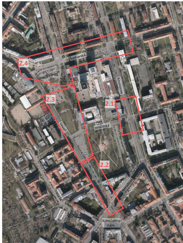
Obrázek 2: Rozdělení částí varianty 2 (mapový podklad: gis.brno.cz)