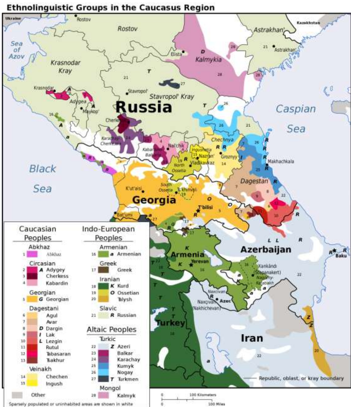
Příloha č. II: Tematická mapa etnolingvistických skupin v regionu Kavkazu