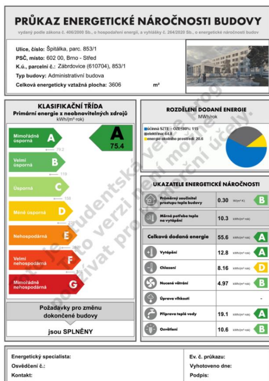
Obr. 3 Grafické znázornění průkazu energetické náročnosti budovy

Důmyslný systém měření a regulace dopomáhá objektu ku příkladu regulovat míru intenzity osvětlení objektu v průběhu denní doby. Zároveň v místech, kde není prostor využíván dokáže systém svícení zcela vypnout. Principy popsány výše mohou výrazně snížit spotřebu elektrické energie v objektu.