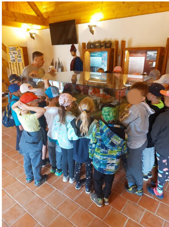
Obrázek č. 15 – výklad průvodce u repliky hradu