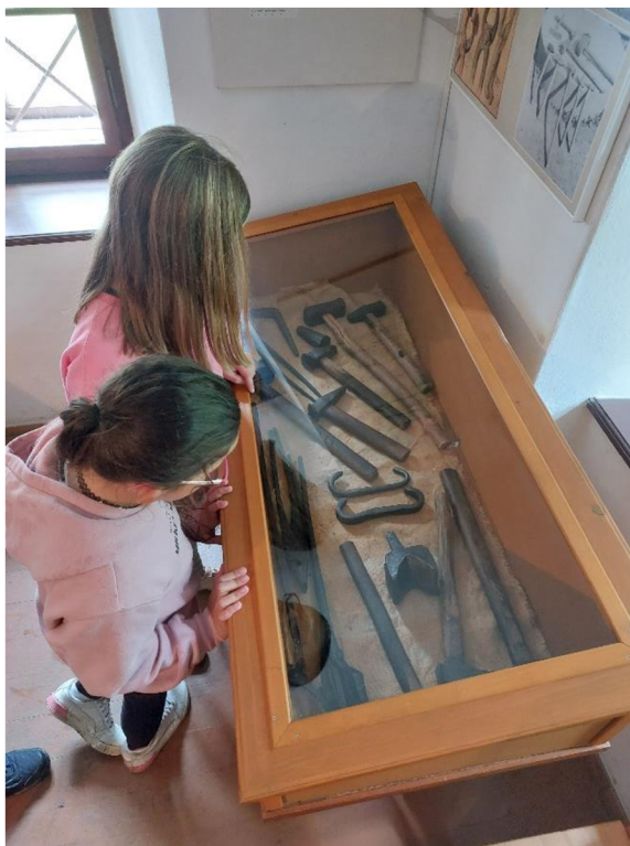
Obrázek č. 12 – dobové nářadí