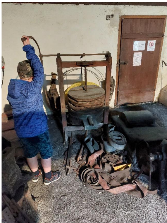
Obrázek č. 11 – dmychadlo