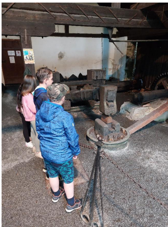
Obrázek č. 10 – dubový buchar