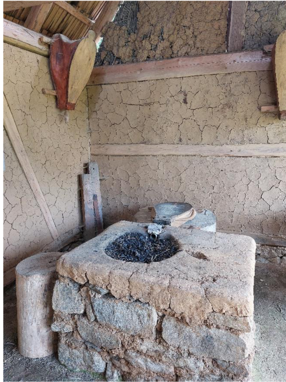
Obrázek č. 17 –výheň s dmychadlem