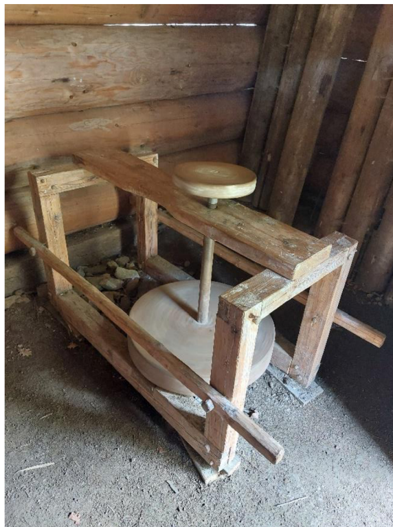
Obrázek č. 16 – kopací hrnčířský kruh