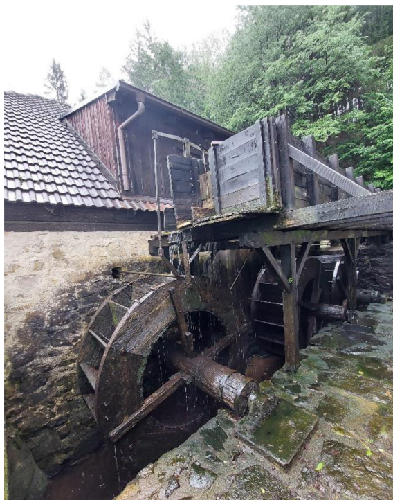
Obrázek č. 13 – vodní kola