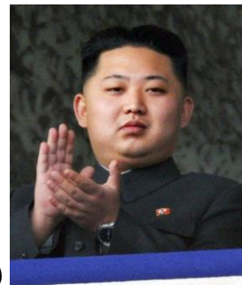
Obrázek 4. Kim Čong – un 232

Hospodářsky zaostalý stát se státem řízenou ekonomikou. Nedostatek/ nadbytek energetických zdrojů. Vysoká/ nízká životní úroveň obyvatelstva. Velké výdaje na armádu/ vzdělání/ zbraně . Rozvinutý jaderný program. Vládní stranou je komunistická Korejská strana práce, státní ideologií je Čučche/ konfucianismus .