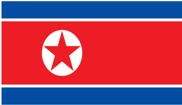
Obrázek 10. Vlajka KDR

Vlajka KDR (obrázek č. 10) je tvořena červeným pozadím, modrými a bílými pruhy a pěticípou hvězdou uprostřed. Modré pruhy zde značí suverenitu, mír a přátelství a červená reprezentuje revoluční komunismus a vlastenectví. Bílá, tedy barva úzkých pruhů, je tradiční korejskou barvou pro čistotu a kulturu korejského lidu. Červená hvězda symbolizuje komunistickou filozofii země. 238