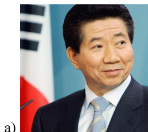
Obrázek 7. Roh Moo – hyun ( biography.com, [online]) 235