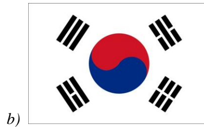
Obrázek 2. Vlajka 230