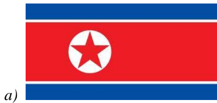
Obrázek 1. Vlajka (Vlajky světů, [online]) 229