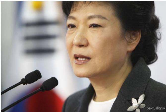
Obrázek 13. Pak Kun – hje

Kim Čong – un je nejvyšším představitelem KLR, svoji funkci zastává od 29. prosince 2011. Je již třetím v dynastii Kimů v čele totalitní Severní Koreje. 240