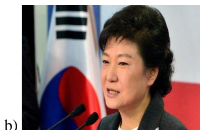
Obrázek 8. Pak Kun – hje (ct24, [online]) 236

Hospodářsky vyspělý stát s tržní ekonomikou, světově významnou. Demokratická / totalitní vláda. Patří/ nepatří mezi asijské tygry (skupiny nově industrializovaných asijských zemí s rychlým hospodářským růstem). V ekonomické oblasti Jižní Korea zaznamenala rapidní růst, co se týče politického vývoje – ten byl o poznání méně lineární. Období autoritativních/ totalitních vlád byla přerušována po dlouhou dobu neúspěšnými demokratickými vzepětími části populace. V současné době však Jižní Koreu řadíme/ neřadíme mezi demokratické státy s pluralitním parlamentním systémem.