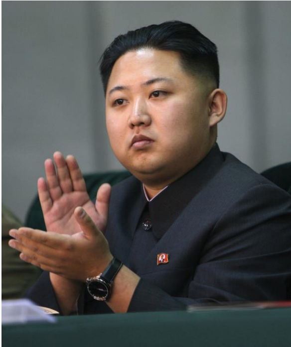
Obrázek 12. Kim Čong – un

Kim Čong – un je nejvyšším představitelem KLR, svoji funkci zastává od 29. prosince 2011. Je již třetím v dynastii Kimů v čele totalitní Severní Koreje. 240