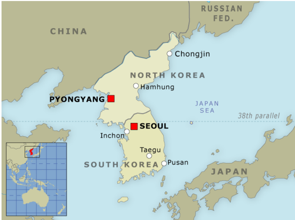
Obrázek 9. Mapa Korejského poloostrova (Socio-Economics History, [online])

Příloha číslo 1: Materiály pro výukovou jednotku č. 2 a 3