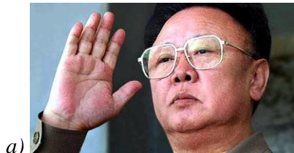
Obrázek 3. Kim Čong – il 231