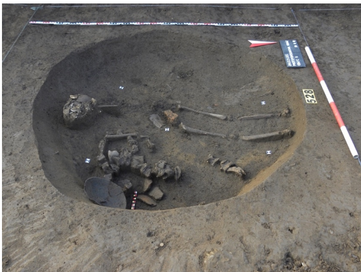
Obr. 2 Zálezlice, kostra s pohřebními milodary, foto: Archeologický ústav AV ČR