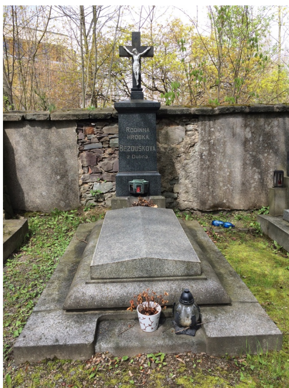
Obr. 12 Rodinná hrobka, hřbitov Přebíram