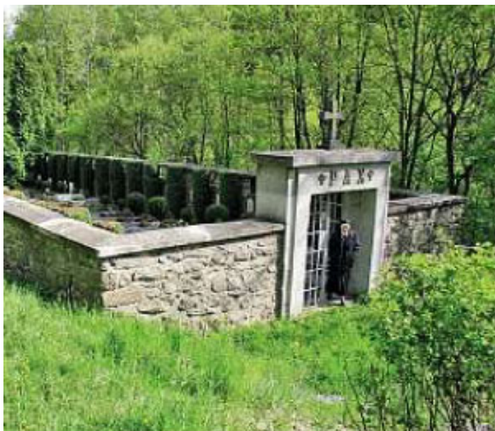
Obr. 6 Neveřejné pohřebiště