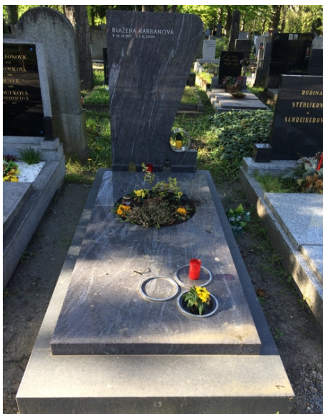
Obr. 9 Jednohrob na Olšanském hřbitově