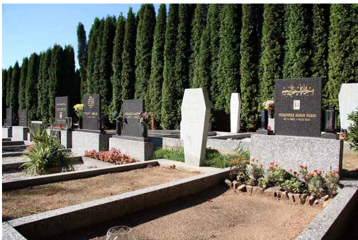
Obr. 1 Muslimský hřbitov v Třebíči, foto: T. Kotrlý