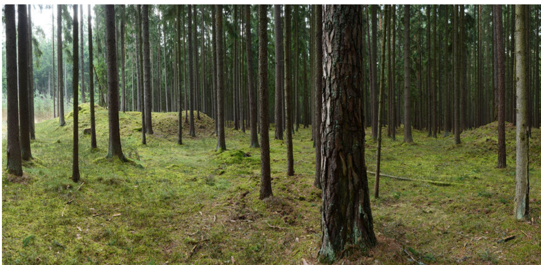
Obr. 3 Sepekov, dochované mohyly, foto: Z. Kačerová, 2014