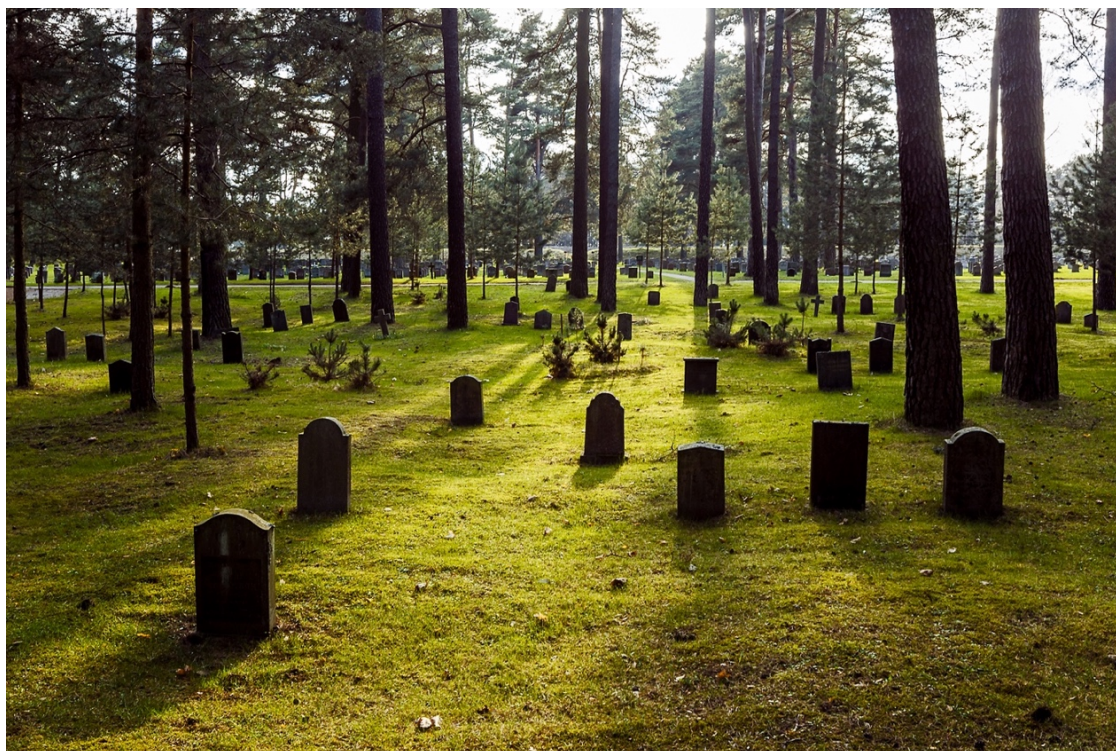
Obr. 4 Lesní hřbitov ve Stockholmu