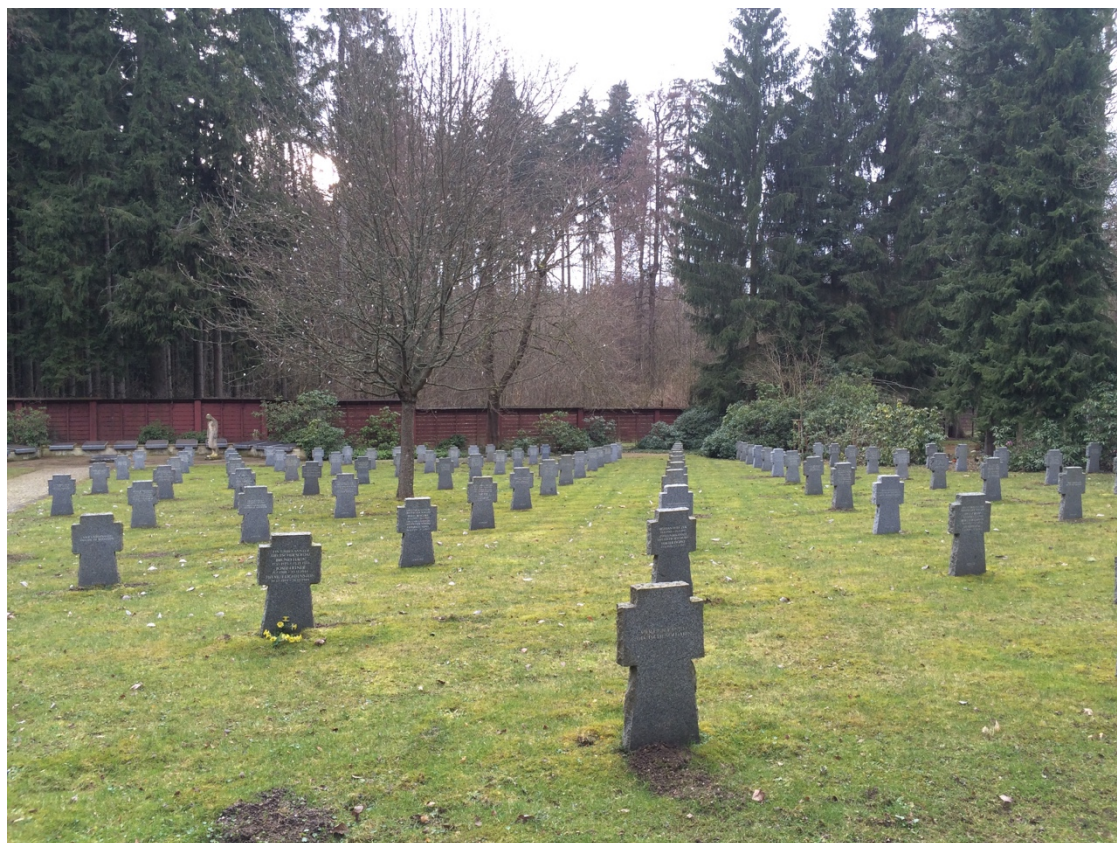
Obr. 7 Vojenský hřbitov v Mariánských lázních