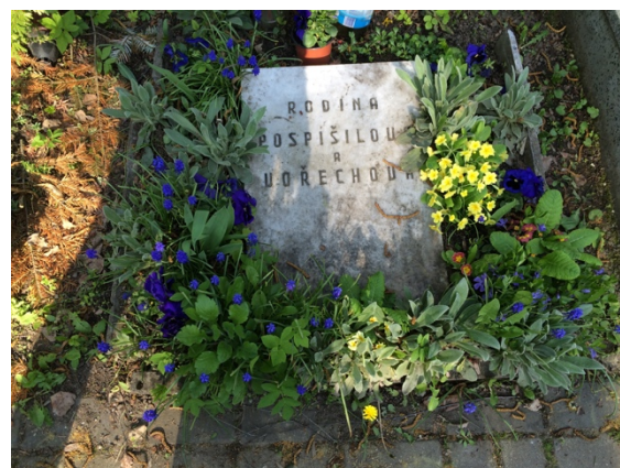
Obr. 13 Epitafní místo na Olšanském hřbitově, 21.4.2016