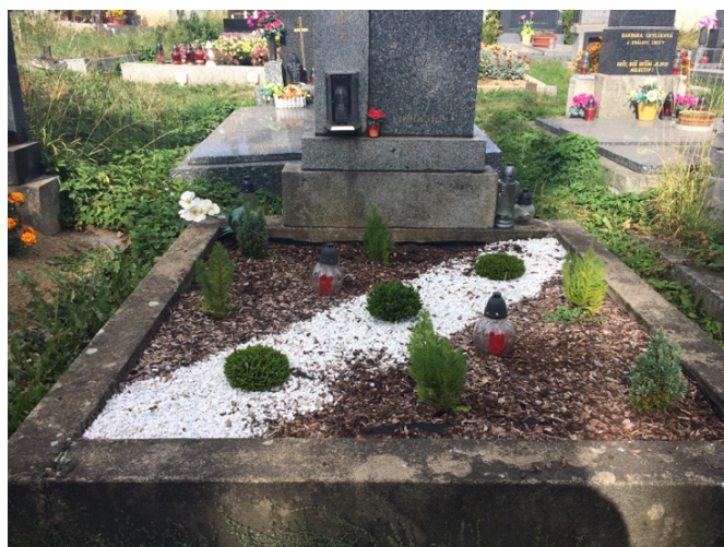
Obr. 10 Dvojhrob, hřbitov v Pečicích