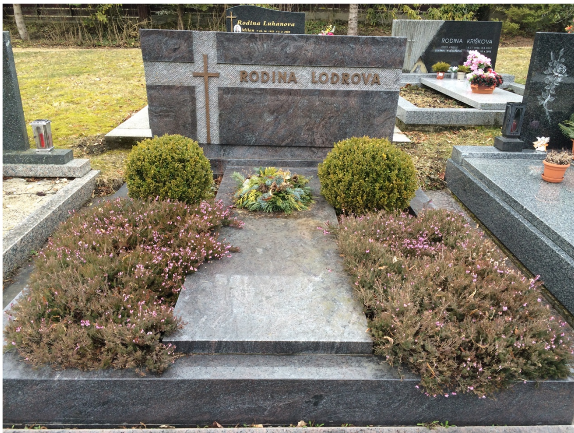
Obr. 11 Rodinný hrob, hřbitov v Mariánských lázních, 21.3.2016