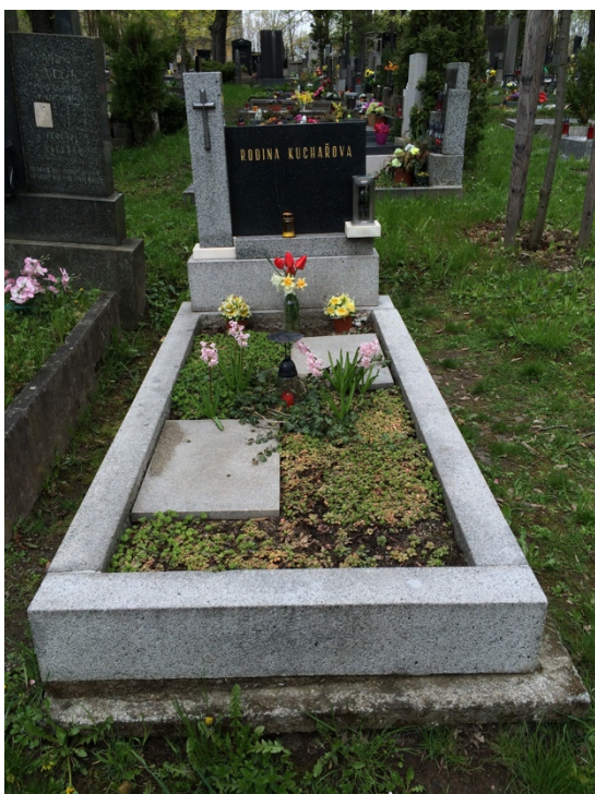
Obr. 26 Současná úprava hrobu, na který byl vypracován návrh č. 2