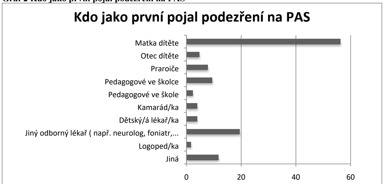
Graf 2 Kdo jako první pojal podezření na PAS