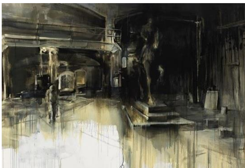
Obr. 18: Hrabě Andrrasy ve slévárně, BODONI, olej a akryl na plátně, 149,9 × 218,8 cm, r. 2009. 92

Maďarský malíř narozený v roce 1977, působící v Budapešti, která se řadí mezi umělce poválečné a současné. Jeho obrazy, mnohdy malované v kombinaci olejových a akverelových barev, vystavoval v mnoha galeriích a muzeích po světě. 90 Zaobírá se figurativní malbou, především žen, ale i koní, které vnímá s jistou symbolikou, proměnou či zasazením do neobvyklých scén a prostředí. Poukazuje na metamorfózu známých věcí v novém pojetí. 91 Jeho malby mě „vtahují“ dovnitř děje a nutí přemýšlet, vnímat celkovou kompozici, kterou podává zvláštním osobitým rozvržením v pochmurných barvách. Malíř se nevyhýbá tématu smrti a s plnou důstojností v kombinaci s jinými idoly opačného významu, dosahují jeho obrazy pro mne takové síly.