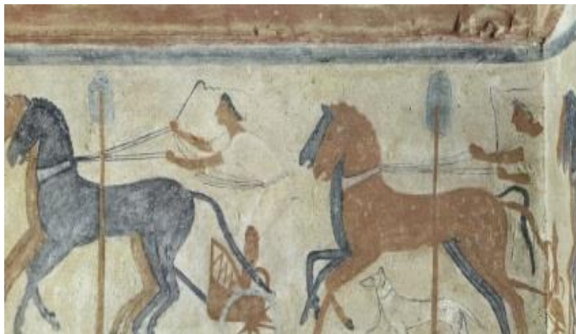
Obr. 9: Závod vozů, freska, š. 148 cm, hrobka colle Capuccini, Chiusi, okolo r. 450 př. K. 47

Etruský národ byl datován od 8. st. př. n. l. rozšířeným na území středu Itálie. Jejich umění se neslo po vzoru starořeckého, avšak postupně se přetvářející v prvky realismu. Navíc Etruskům nebyla cizí ani řecká mytologie, ačkoliv se do Itálie dovážely řecké vázy. Domníváme se, že právě proto se staly témata maleb oné keramiky inspirací pro malířství Etrusků. Především ja nám známe z nálezů ve hrobech, kde se dochovaly malby na zdech. 46