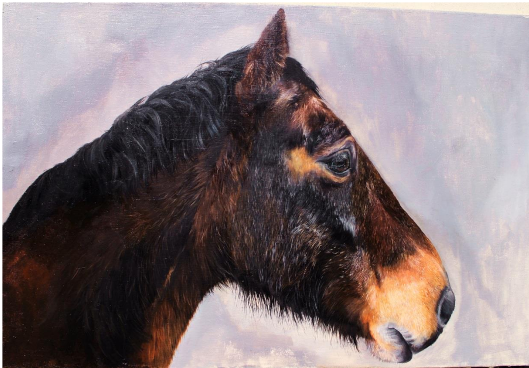
Obr. 20: Podobizna Juráška, 120 × 80 cm, olej na plátně, 2022.

Již staří egypt'ané věděli, že je vše pomíjivé, dnes to vím i já. Díky těmto malbám se žal uvnitř mne rozplynul a další jiné negativní dojmy odešly. Teď s vděčností vzpomínám a děkuji za vše zlé i dobré, co s sebou život přináší.