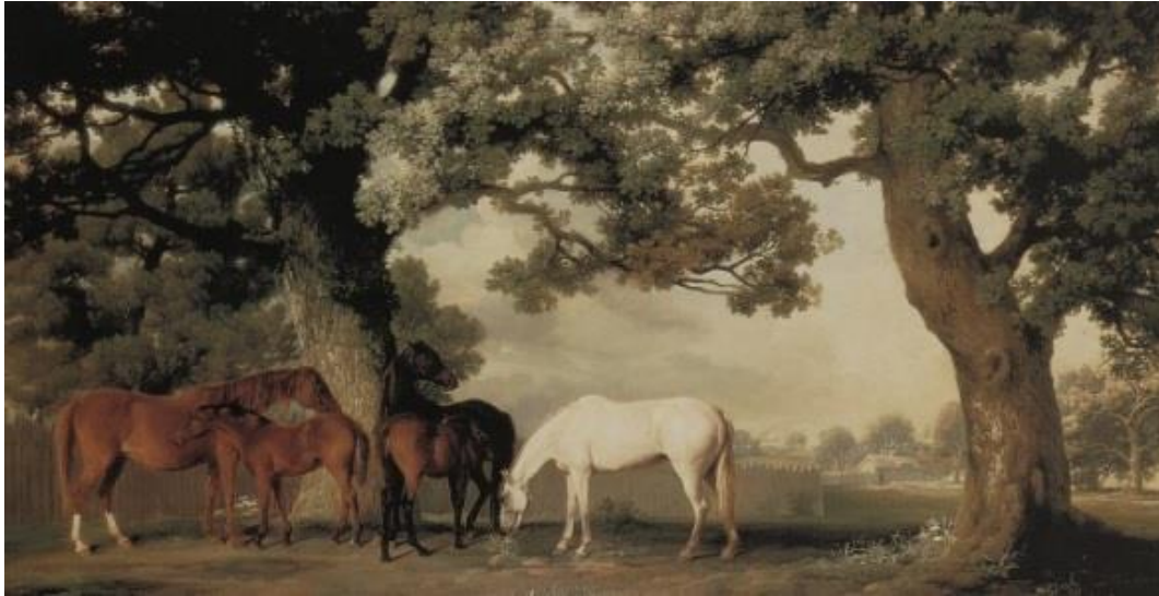
Obr. 16: Klisny a hříbata pod velkými duby, STUBBS, olej na plátně, 99 × 187 cm, soukromá sbírka, kolem r. 1764 – 68. 85

V roce 1911 vzniklo v Mnichově sdružení umělců pod názvem Der Blaue reiter, které v překladu znamená Modrý jezdec. Jedním z členů této skupiny byl Franz Marc, milovník zvířat, především koní, kteří se stali oblíbeným námětem pro jeho tvorbu. Přičemž si lze povšimnout, jak tento motiv vnímal zcela odlišně v porovnání s umělci, jež jsem zmínila výše v textu. Hledal podstatu ve tvarové formě, kterou opodstatňoval i jakousi symbolikou barevných tónů.