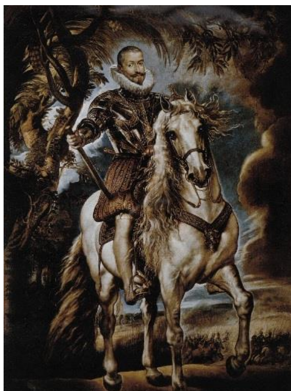
Obr. 13: Jezdecký portrét vévody z Lermy, RUBENS, olej na plátně, 283 × 200, Madrid, r. 1603. 73

Podobně i Rubens ve svých obrazech se věnuje jezdeckým sochám, tak tomu dosvědčuje jeho malba Vévody z Lermy, kde sedí na krásném bujném koni. Jako spousta umělců před ním se nadále ještě věnoval samotné symbolice koně v motivech řeckých bájí. Znamé jsou olejomalby jako Únos dcer Leukippových, Bitva Amazonek, atd. 72 Koně malované jeho rukou jsou plní vnitřní svobody, jež jsou znázorněni s rozevlátou hřívou a ocasem.