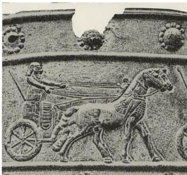
Obr. 5: Asyrský vozač na válečném voze zapřahnutý za dvěma páry koní. 22

Assyrské obyvatelstvo je hlavně známo pro jejich vojenské počínání ve válkách. Velkým vítězstvím pro ně bylo poražení Chetitů, čímž se jejich moc upevnila a rozšířila. Vzrostla tím i potřeba mít více koní pro jejich sílu k vojenským účelům. Ve své knize Dobroruka popisuje: „Z jejich realistických reliéfů poznáme, že jejich koně nebyli příliš vysocí, měli mohutné osvalené plece, suché štíhlé nohy s výraznými klouby a dost plochým kopytem a elegantní hlavy se štíchlým profilem, výrazným okem a poměrně silnými čelistmi.“ 21