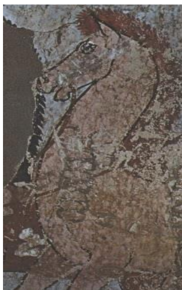
Obr. 4: Růžový kůň z Canineova hrobu, kolem r. 1420 př. K. 19

Představu o znázornění koně v malířství nám vymezuje dochovaná malba Růžového koně asi z roku 1 420 př. K. 18 Vyobrazení je velmi schematické a jednoduše pojaté, jasná černá čára určuje obrys koně, jako tomu podobně bývalo v malbách od pravěkých lidí. Z této fresky je zřejmé, že již v Egyptě lidé používali ke zkrocení a vedení koně železná udidla. Otevřená huba koně a rozzuřený jeho výraz nám dává najevo, jak nepříjemné to pro koně bylo.