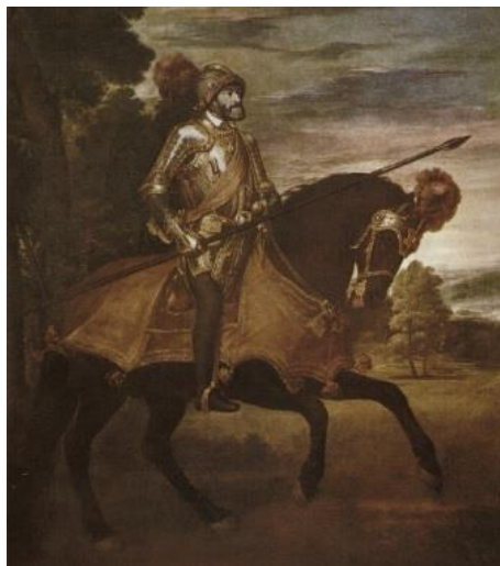
Obr.12: Jezdecký portrét Karla V., TIZIAN, olej na plátně, 332 × 279, Madrid, r. 1548. 71

Velký malíř Tizian byl požádán německým císařem a králem španělska Karlem V., aby jej portrétoval. Namaloval pro něj jezdecké portréty, jež zpodobňovaly císaře s koněm vždy v podobné fázi postoje koně. Na jednom obraze je císař vyobrazen, jak jede na černém, bujném vraníkovi a na druhém jej zachycuje na bělošouvi. Kůň zpodobňuje dokonalost, krásu a pýchu těchto vysoce vládnoucích vrstev ve společnosti, jež takto dávají okolí naodiv. 70