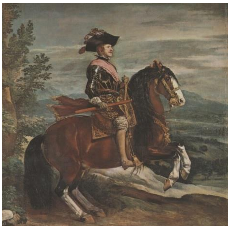
Obr. 14: Jezdecký portrét Filipa IV., VELAZQUÉZ. 76

Pozoruhodným malířem jezdeckých portrétů byl i A. van Dyck, jehož prvky zabíhaly až k manýristické malbě, a to především na obraze s výjevem jezdeckého portrétu Karla I. 75