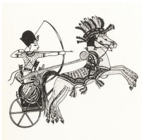
Obr. 3: Zobrazení bojovného výjevu, jež ukazuje krále Tutanchamona. 17

Představu o znázornění koně v malířství nám vymezuje dochovaná malba Růžového koně asi z roku 1 420 př. K. 18 Vyobrazení je velmi schematické a jednoduše pojaté, jasná černá čára určuje obrys koně, jako tomu podobně bývalo v malbách od pravěkých lidí. Z této fresky je zřejmé, že již v Egyptě lidé používali ke zkrocení a vedení koně železná udidla. Otevřená huba koně a rozzuřený jeho výraz nám dává najevo, jak nepříjemné to pro koně bylo.