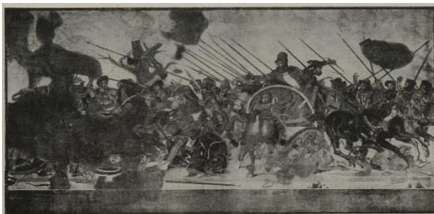
Obr. 8: Alexandrova bitva u Issu, Mosaika z Casa del Fauno v Pompejích, Mus. v Neapoli. 38

Značně důležitý obraz pro dobu antického Řecka je scéna bitvy Alexandra Velikého s Dareiem u Issu. Původní obraz maloval umělec známý pod jménem Filoxenos. Tento slavný obraz je nám znám především z jeho kopie mozaiky, kterou dnes nalezneme v museu v Pompejích. V obraze je zachycen moment, kdy Alexandr sedí na jeho mohutném koni a společně tak napadají Darea, který přijel ve voze, jež se poté snaží zachránit a uprchnout na koni. Tento kůň je v obraze natočený pozadím k divákovi a lze si povšimnout, jak koně zadržuje před útekem člověk – podkoní. Je to ohromující scéna plná emocí a „živosti“ ve tvářích hrdinů. Kůň zde symbolizuje sílu, vítězství, svobodu a rychlost uniknout před nebezpečím. „Kolorit obrazu však nebyl asi závislý na originálu, nýbrž byl vytvořen v duchu pozdní doby, v souhlase s novým materiálem a technikou nového díla.“ 37