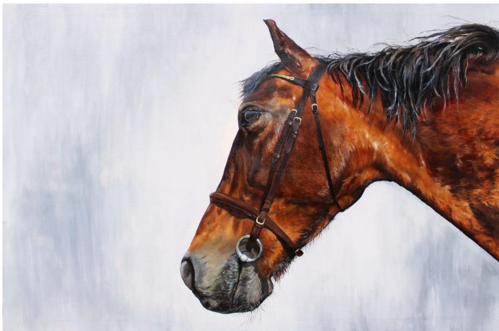
Obr. 19: Portrét s uzdečkou, 80 × 120 cm, olej na plátně, 2022.

I dnes se s těmito potřebami či výbavou setkáváme, ovšem doba to považuje za „normální“. V této moderní době se tyto bolestivé pomůcky skrývají za ideou falešné krásy. Lidé chtějí mít svého koně barevně sladěného, a to díky postrojům a umělým doplňkům a nejlépe i s oblečením jejich jezdců. To všechno je jen povrchové, ta hlavní vnitřní propojenost koně a člověka se téměř vytratila. Dnes koluje mezi lidmi lživá iluze, o tom, co je kůň, původně potomek divokého koně. Avšak je třeba zmínit, že stále existuje několik lidí, kteří pracují s koňmi na přirozené úrovni a hovoří s nimi jejich jazykem a řečí těla. Obdivují jejich přirozený temperament a podstatu duše.