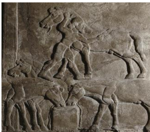
Obr. 6: Reliéf zobrazující koně při napájení vodou a člověka kartáčujícího srst, 9. stol. př. K. 29

Výjev, který představuje péči o koně, nepatří mezi často zobrazované. Podle tohoto reliéfu je zřejmé, že se koním dostávala i pozornost, prostřednictvím kartáčování jejich srsti a napájení vodou. Ačkoliv koně vypadají robustně a do značné míry mají znázorněné i svaly na těle, může se jednat právě o koně válečného typu, a toto opečovávání předcházelo tažením s nimi do války.