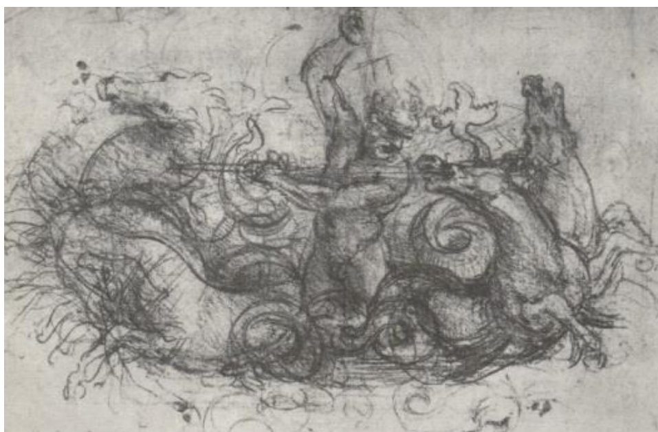
Obr. 11: Návrh Neptuna a čtyřspřeží koní, LEONARDO DA VINCI, úhel na bílém papíře, r. 1504. 66

Leonardo da Vinci patřil mezi mistři ve znalosti a provedení anatomického těla, což se projevilo například u studie obrazu znázorňující bitvu u Angihari či skici Boha Neptuna s jeho čtyřspřežím vynořující se z moře. J. Dušek dále ve své knize uvádí: „... studie k pomníku Gian Giacoma v Trivulzii (r. 1511), v níž v několika proměnách hledá původnost i symboliku určujícího motivu.“ Snad jeho prvotní vyobrazení koní bylo v obraze Klanění tří králů. Jiné návrhy odkazují i na jezdeckou sochu Francesca Sforzy. 65 Koně v jeho obrazech dominují často dramatickým výrazem, což vyjadřuje umělcův osobitý rukopis.