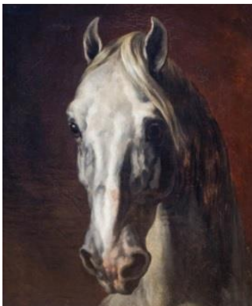
Obr. 15: Hlava koně, GÉRICAULT, olejomalba. 81

S podobným citem k malbě koní přistupoval i jeho současník, přítel a malíř Eugène Delacroix, který rovněž patřil k předním představitelům francouzského romantismu. Jeho motivy koní se vyznačují, taktéž vášní, zuřivostí a dramatickostí ve scénách, v nichž zároveň figurují elegantně a nespoutaně prostřednictvím pohybu jejich těl či často rozevláté hřívy. 82