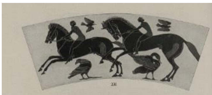
Obr. 7: Malba Chalkidské vazy. 35

Nepatrné množství maleb a rytin ukazuje, že jezdci seděli přímo na holém hřbetu koně či měli pod sebou jen slabou podušku. Jezdci jsou zobrazováni s bosíma nohama a koně mají nad hlavou ohlávky nebo mnohokrát i uzdy. Jak zmiňuje ve své knize Dobroruka: „... roubíky po stranách huby koně přidrží udidlo a výraz koně ukazuje, jak je mu to nepříjemné. “ 34 Avšak to není první zmínka, o těchto bolestných „pomůckách“ pro lepší ovladatelnost, jelikož jak popisují výše v textu, již v Egyptě jsou na obrazech znázorněny tyto udidla v hubách koní.