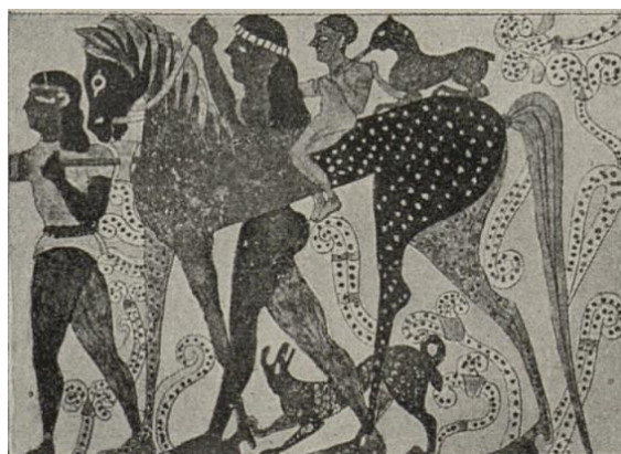
Obr. 10: Nástěnná malba, hrobka Campana ve Vejích. 48