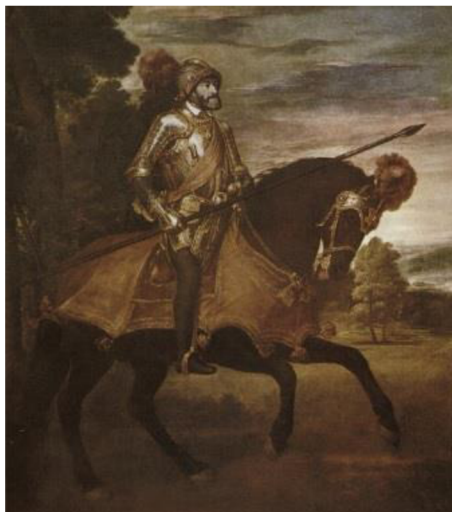
Obr.12: Jezdecký portrét Karla V., TIZIAN, olej na plátně, 332 × 279, Madrid, r. 1548. 71

Velký malíř Tizian byl požádán německým císařem a králem španělska Karlem V., aby jej portrétoval. Namaloval pro něj jezdecké portréty, jež zpodobňovaly císaře s koněm vždy v podobné fázi postoje koně. Na jednom obraze je císař vyobrazen, jak jede na černém, bujném vraníkovi a na druhém jej zachycuje na bělošouvi. Kůň zpodobňuje dokonalost, krásu a pýchu těchto vysoce vládnoucích vrstev ve společnosti, jež takto dávají okolí naodiv. 70