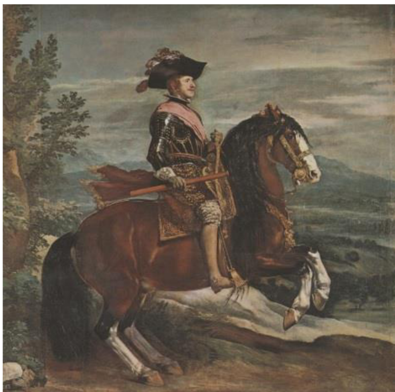
Obr. 14: Jezdecký portrét Filipa IV., VELAZQUEZ. 76

Pozoruhodným malířem jezdeckých portrétů byl i A. van Dyck, jehož prvky zabíhaly až k manýristické malbě, a to především na obraze s výjevem jezdeckého portrétu Karla I. 75