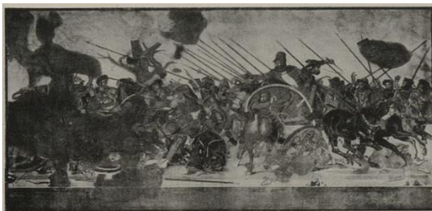
Obr. 8: Alexandrova bitva u Issu, Mosaika z Casa del Fauno v Pompejích, Mus. v Neapoli. 38

Značně důležitý obraz pro dobu antického Řecka je scéna bitvy Alexandra Velikého s Dareiem u Issu. Původní obraz maloval umělec známý pod jménem Filoxenos. Tento slavný obraz je nám znám především z jeho kopie mozaiky, kterou dnes nalezneme v museu v Pompejích. V obraze je zachycen moment, kdy Alexandr sedí na jeho mohutném koni a společně tak napadají Darea, který přijel ve voze, jež se poté snaží zachránit a uprchnout na koni. Tento kůň je v obraze natočený pozadím k divákovi a lze si povšimnout, jak koně zadržuje před útekem člověk – podkoní. Je to ohromující scéna plná emocí a „živosti“ ve tvářích hrdinů. Kůň zde symbolizuje sílu, vítězství, svobodu a rychlost uniknout před nebezpečím. „Kolorit obrazu však nebyl asi závislý na originálu, nýbrž byl vytvořen v duchu pozdní doby, v souhlase s novým materiálem a technikou nového díla.“ 37