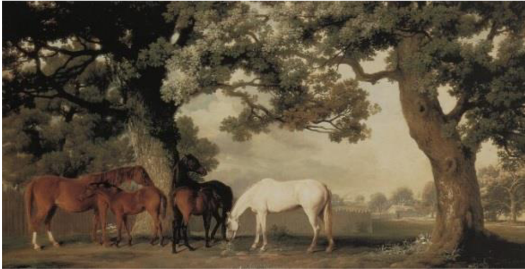
Obr. 16: Klisny a hřibata pod velkými duby, STUBBS, olej na plátně, 99 × 187 cm, soukromá sbírka, kolem r. 1764 – 68. 85

V roce 1911 vzniklo v Mnichově sdružení umělců pod názvem Der Blaue reiter, které v překladu znamená Modrý jezdec. Jedním z členů této skupiny byl Franz Marc, milovník zvířat, především koní, kteří se stali oblíbeným námětem pro jeho tvorbu. Přičemž si lze povšimnout, jak tento motiv vnímal zcela odlišně v porovnání s umělci, jež jsem zmínila výše v textu. Hledal podstatu ve tvarové formě, kterou opodstatňoval i jakousi symbolikou barevných tónů.