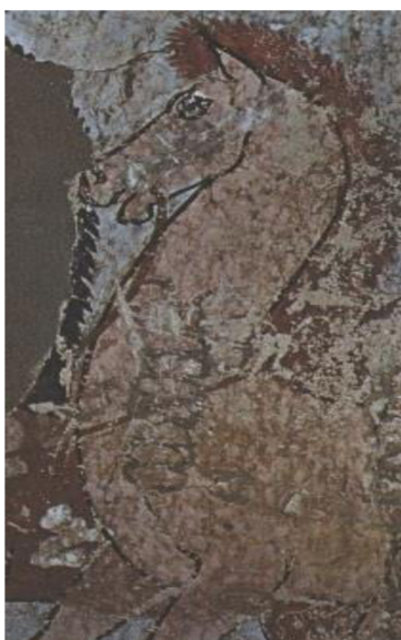
Obr. 4: Růžový kůň z Canineova hrobu, kolem r. 1420 př. K. 19

Představu o znázornění koně v malířství nám vymezuje dochovaná malba Růžového koně asi z roku 1 420 př. K. 18 Vyobrazení je velmi schematické a jednoduše pojaté, jasná černá čára určuje obrys koně, jako tomu podobně bývalo v malbách od pravěkých lidí. Z této fresky je zřejmé, že již v Egyptě lidé používali ke zkrocení a vedení koně železná udidla. Otevřená huba koně a rozzuřený jeho výraz nám dává najevo, jak nepříjemné to pro koně bylo.