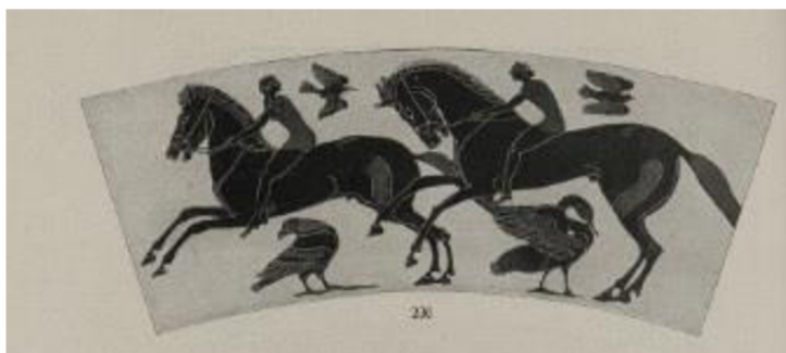
Obr. 7: Malba Chalkidské vazy. 35

Nepatrné množství maleb a rytin ukazuje, že jezdci seděli přímo na holém hřbetu koně či měli pod sebou jen slabou podušku. Jezdci jsou zobrazováni s bosíma nohama a koně mají nad hlavou ohlávky nebo mnohokrát i uzdy. Jak zmiňuje ve své knize Dobroruka: „... roubíky po stranách huby koně přidrží udidlo a výraz koně ukazuje, jak je mu to nepříjemné. “ 34 Avšak to není první zmínka, o těchto bolestných „pomůckách“ pro lepší ovladatelnost, jelikož jak popisují výše v textu, již v Egyptě jsou na obrazech znázorněny tyto udidla v hubách koní.