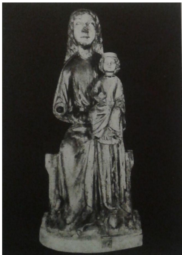
12 Madona z Tuřan, ca 1240 – 1260, kostel Zvěřování Panny Marie, Brno - Tuřany.