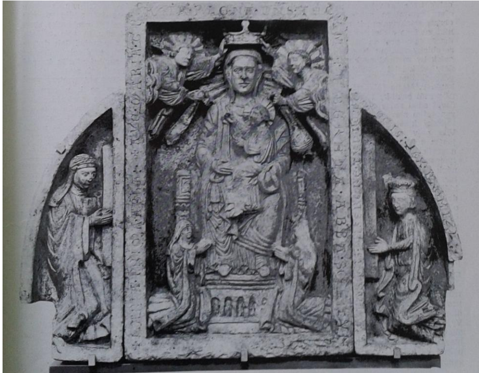
8 Trůnící madona na reliéfu z kostela sv. Jiří na Pražském hradě, před 1228, Národní galerie v Praze.