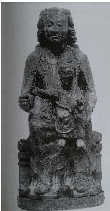
11 Madona z Lomnice u Tišnova, ca 1220 – 1250, dnes nezvěstná.