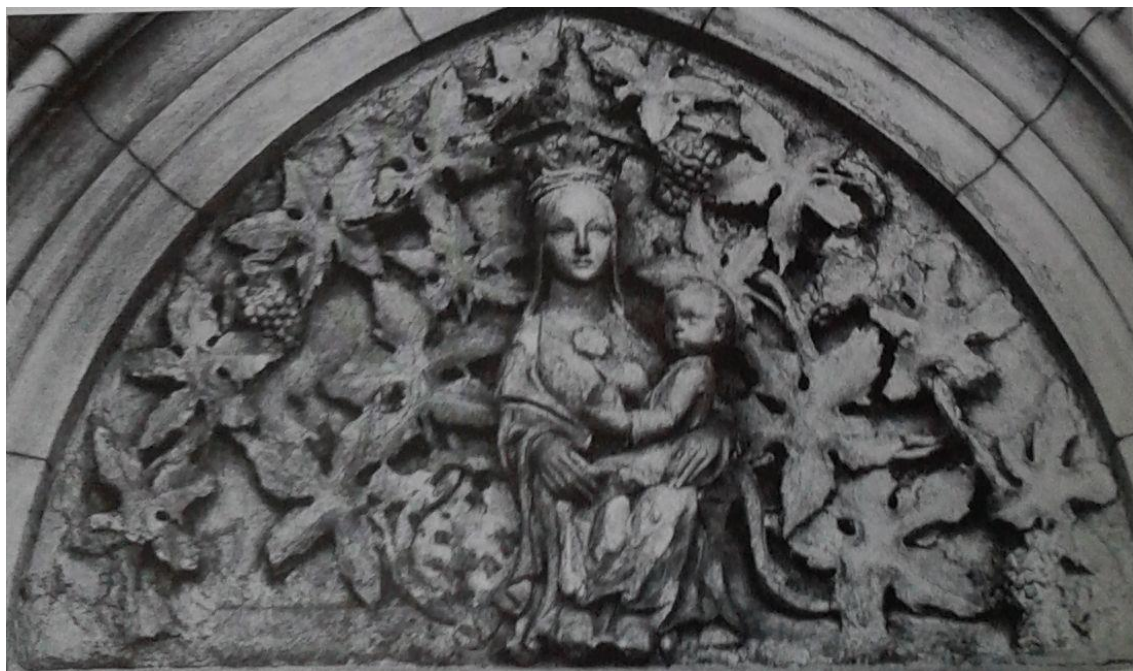
19 Trůnící madona z tympanonu kaple na hradě v Českém Šternberku, 2. polovina 13. století.