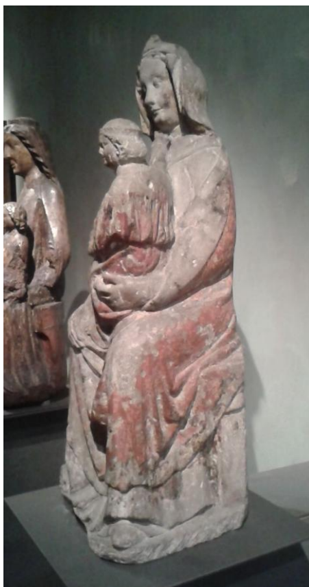
5 Madona z okolí Mladé Boleslavi, ca 1260, Národní galerie v Praze.