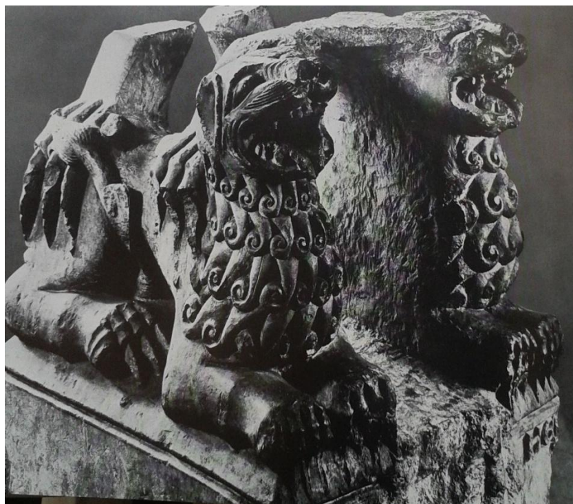
15 Torzo podstavce s dvojicí lvů z Kouřimi, ca 1220 – 1230, Lapidárium národního muzea v Praze.