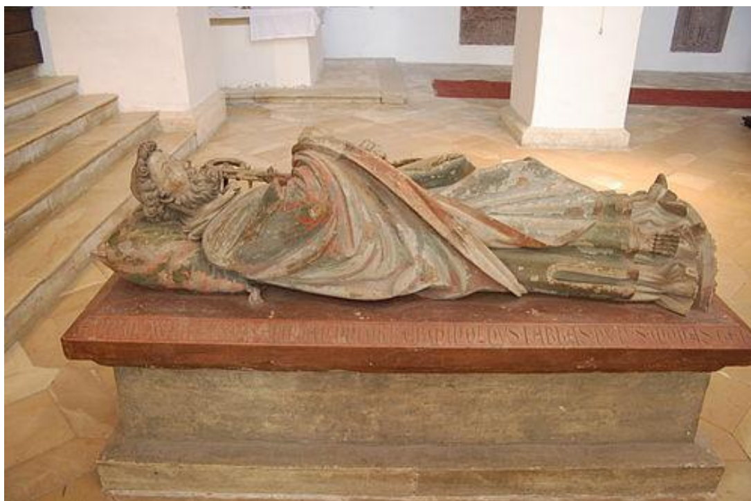
23 Náhrobek sv. Erminolda z Prüfeningu, ca 1280, benediktinský klášterní kostel v Prüfeningu, Řezno.