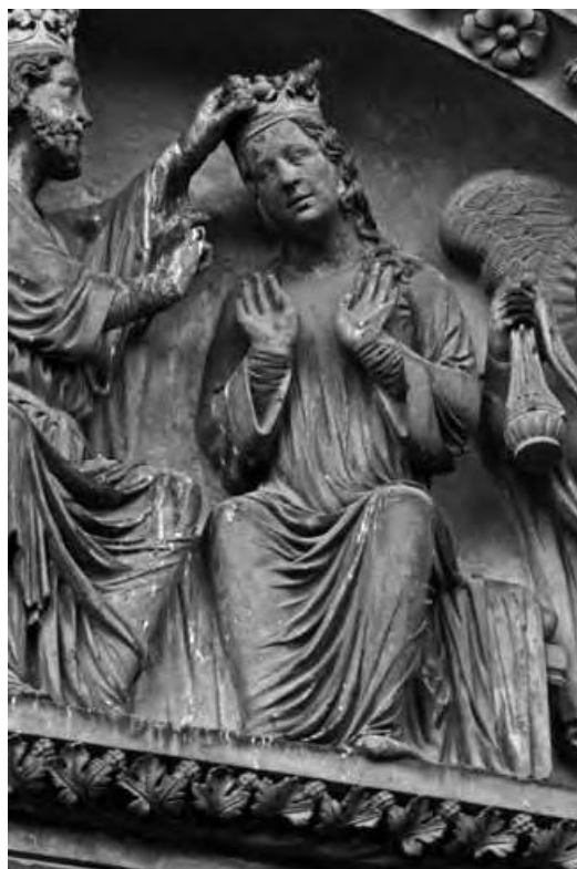
28 Panny Marie z Korunování na tympanonu jižního portálu transeptu štrasburské katedrály, ca 1230.