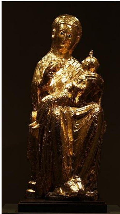
9 Madona z Essenu, ca 990, katedrála v Essenu.