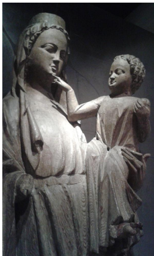
29 Madona Strakonická, ca 1300, Národní galerie v Praze.