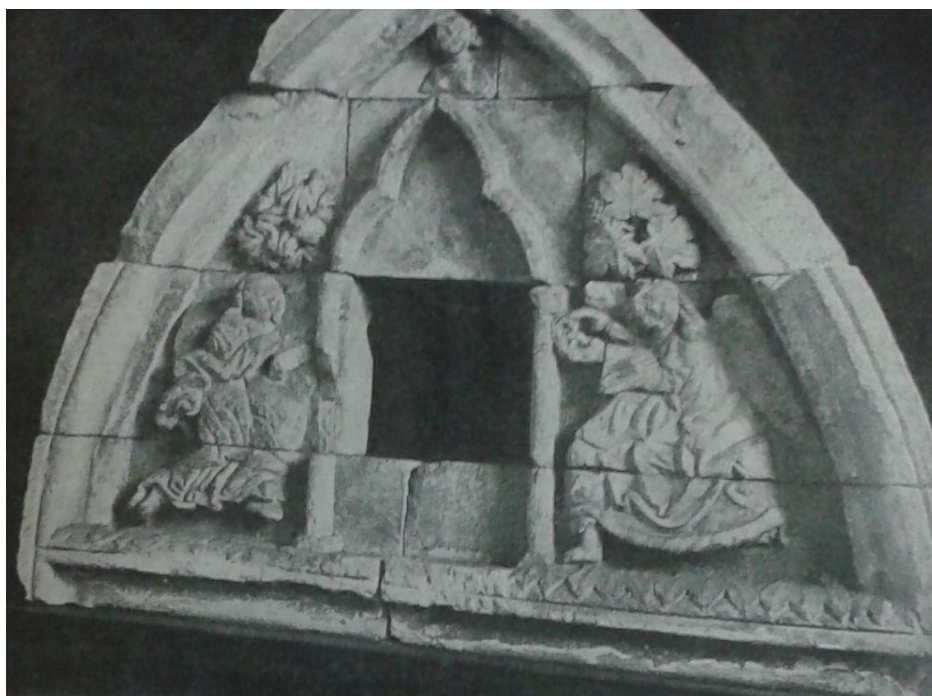
17 Předpokládaná trůnící madona ve scéně Zvěstování na tympanonu severního portálu kostela sv. Bartoloměje v Kolíně nad Labem, 2. polovina 13. století, Lapidárium Národního muzea v Praze.