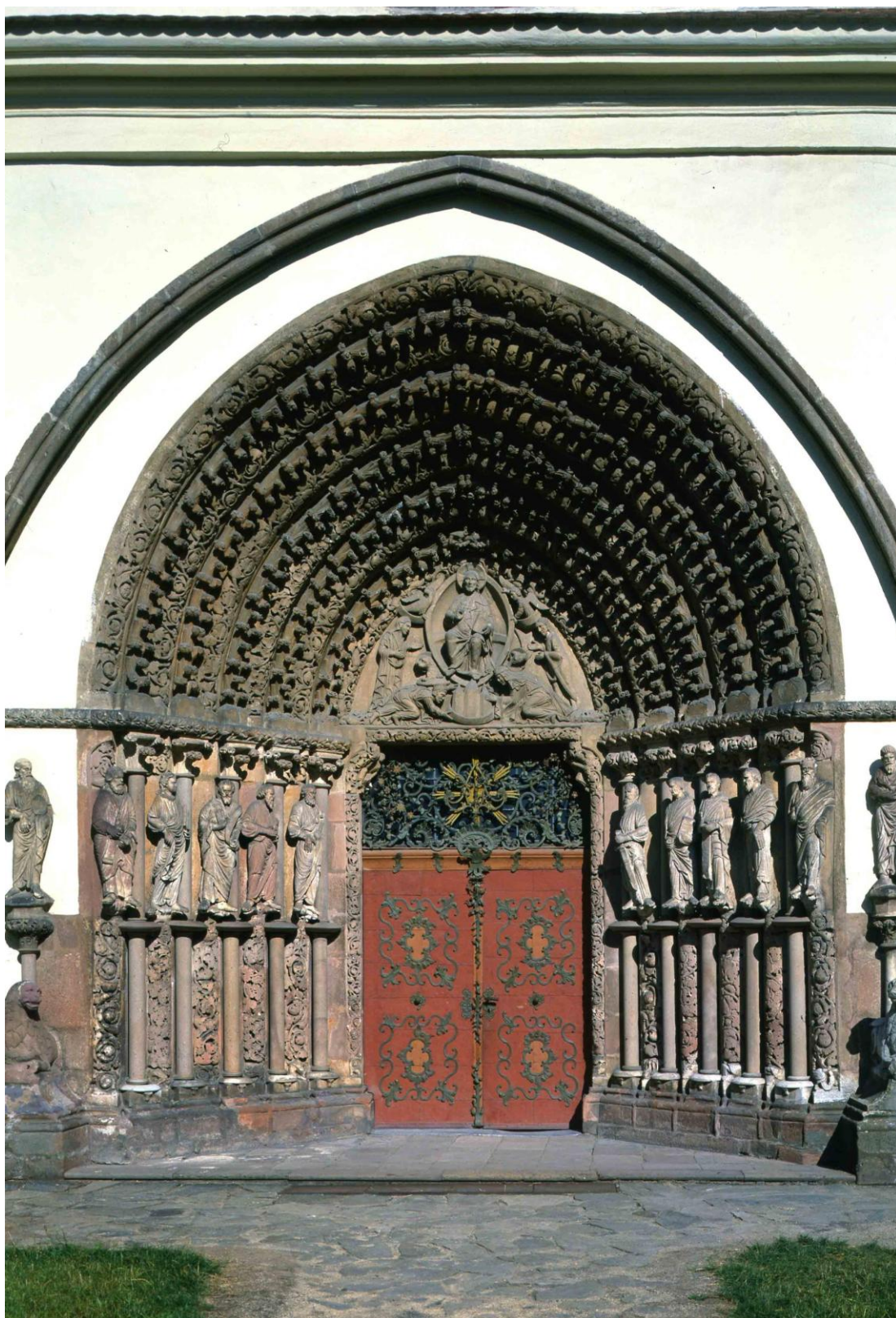
27 Západní portál kláštera cisterciáček v Tišnově, před 1240.