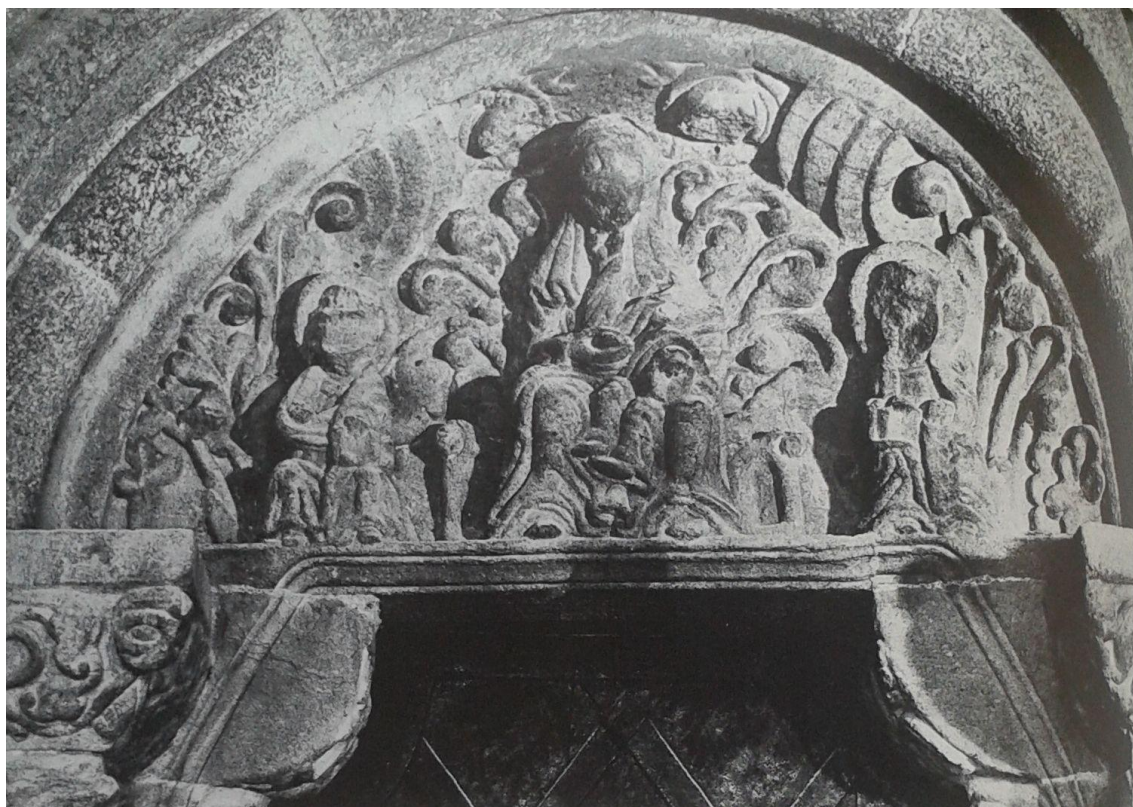
16 Trůnící madona na reliéfu ze západního portálu farního kostela sv. Jana Křtitele v Měříně, pol. 13. století.