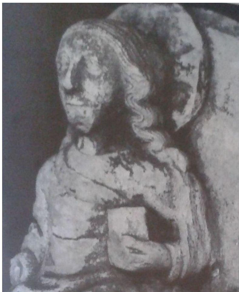
25 Klenební svorník s motivem Krista, 2. polovina 13. století, Lapidárium Národního muzea v Praze.