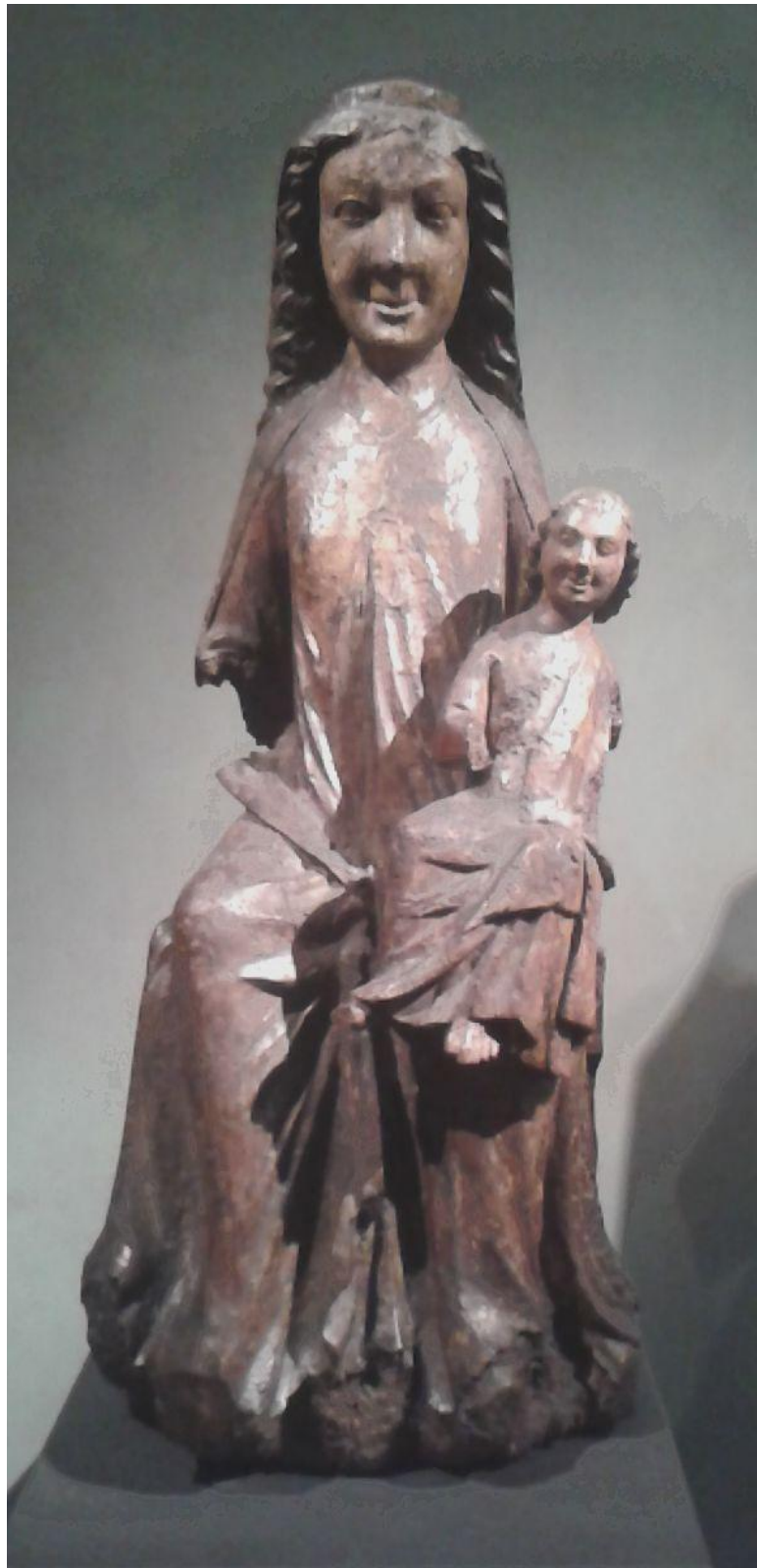
1 Madona z okolí Strakonice, 1220 – 1250, Národní galerie v Praze.