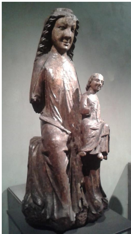
3 Madona z okolí Strakonice, 1220 – 1250, Národní galerie v Praze.