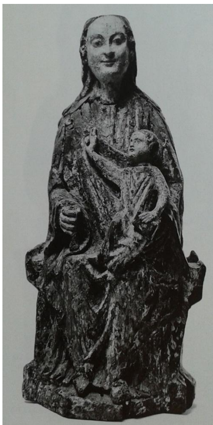
10 Madona z Klobouk u Brna, ca 1220 – 1230, Národní galerie v Praze.