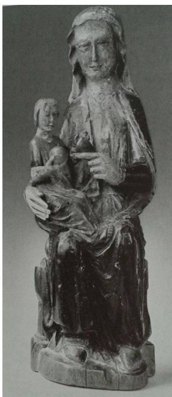
13 Madona z Mariazellu, 50. léta 13. století, poutní bazilika Narození Panny Marie v Mariazellu.