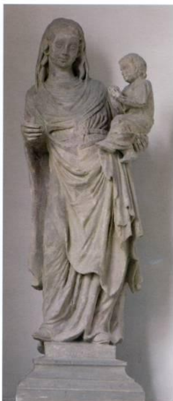
Brno, katedrála sv. Petra a Pavla; Madona (poslední čtvrtina 13. století).

20 Madona, 1. polovina 14. století, kostel sv. Petra a Pavla v Brně.