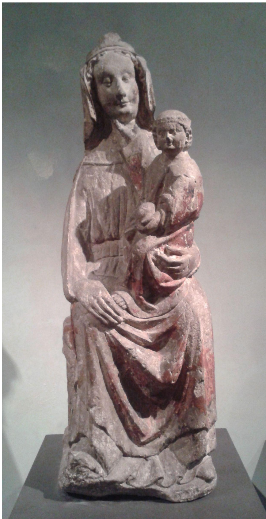
4 Madona z okolí Mladé Boleslavi, ca 1260, Národní galerie v Praze.