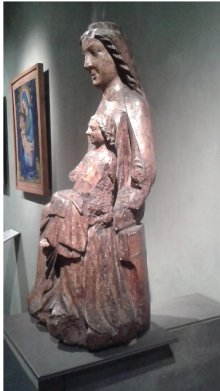
2 Madona z okolí Strakonice, 1220 – 1250, Národní galerie v Praze.