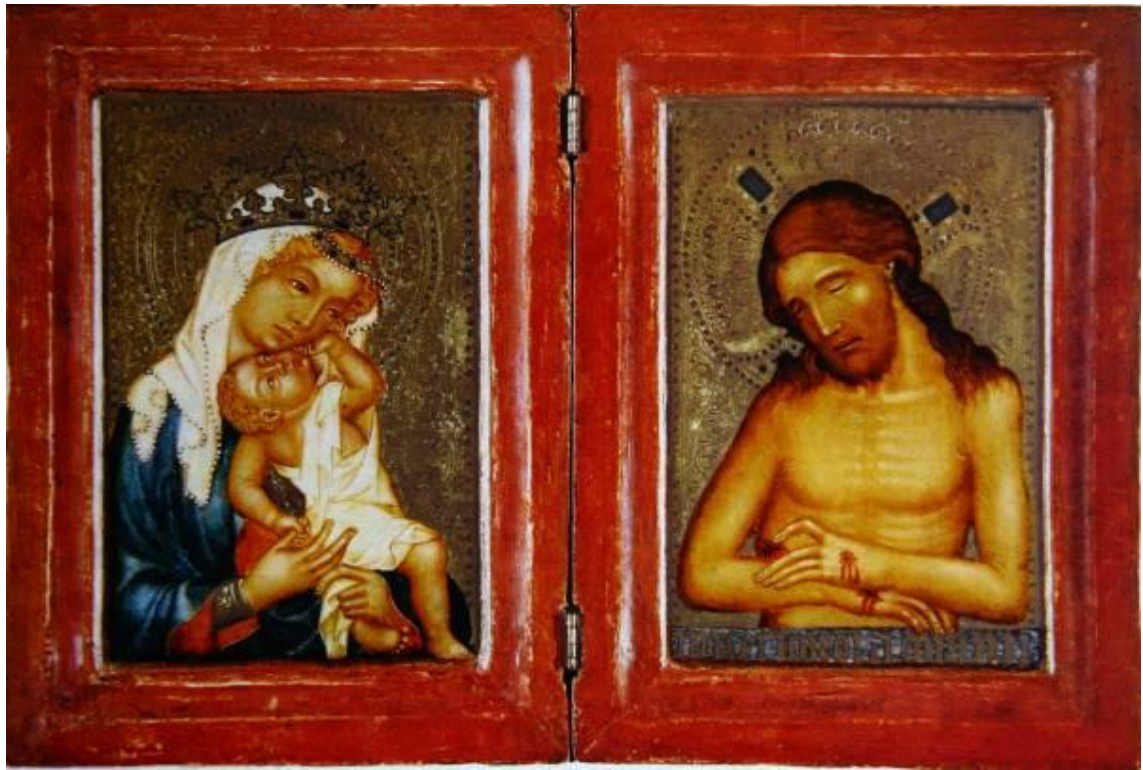
30 Diptych z Karlsruhe, ca 1360, Staatliche Kunsthalle, Karlsruhe.