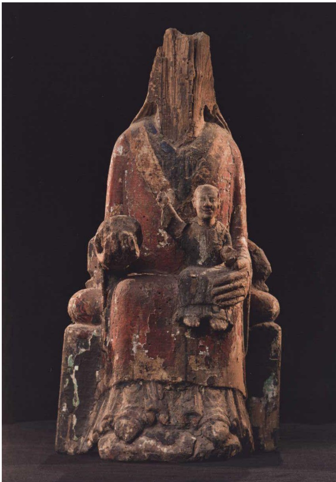
7 Madona z Osíka u Litomyše, 2. polovina 12. století, soukromá sbírka.