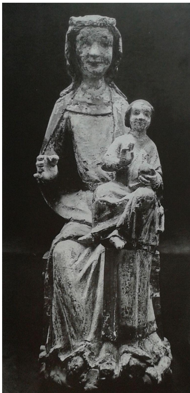
26 Madona z vídeňské soukromé sbírky II, 50. léta 13. století.