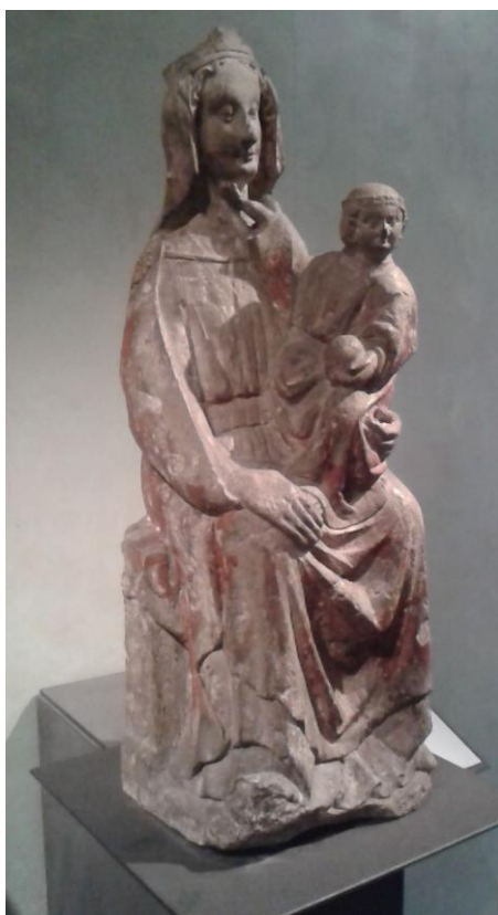
6 Madona z okolí Mladé Boleslavi, ca 1260, Národní galerie v Praze.