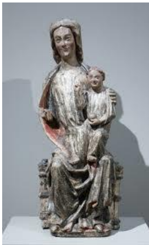
22 Trůnící madona od Mistra náhrobku sv. Erminolda (?), ca 1290, Museum Kunstpalast Düsseldorf.