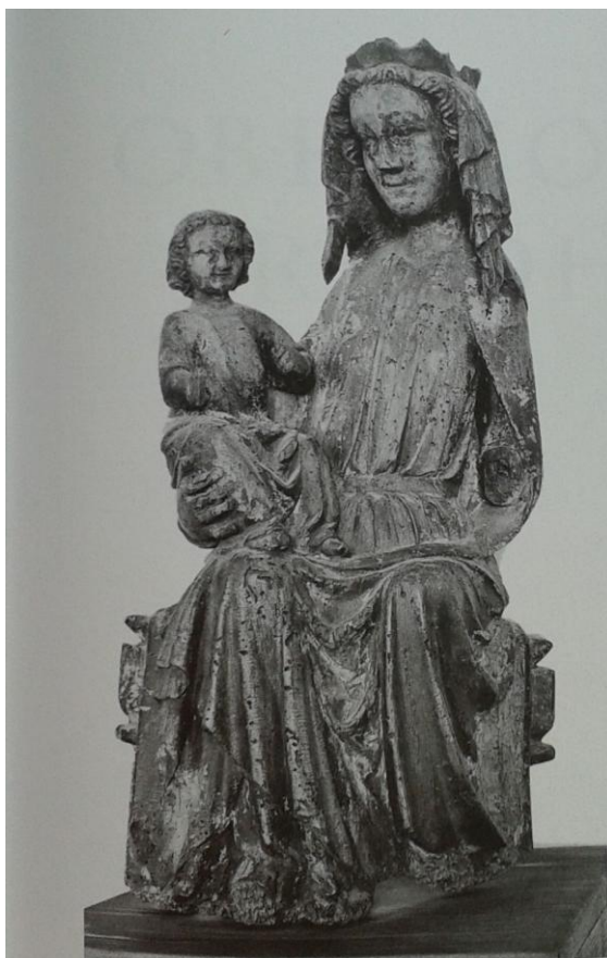
14 Madona ze Sankt Lambrechtu, ca 1280 – 1300, benediktinské opatství, Stiftmuseum.