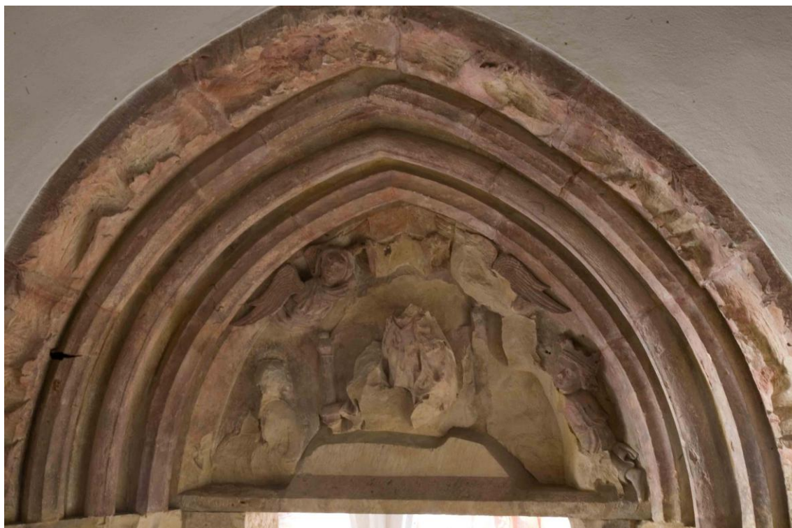
18 Trůnící madona z tympanonu hradní kaple na Zvíkově, ca polovina 13. století.