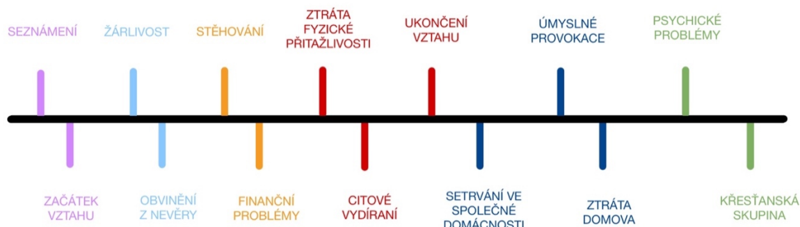
Obrázek 1: Časová osa, příběh Kristýny

Rozhovor s Kristýnou jsme započali jejím pohledem na fenomén toxicity, poté Kristýna pokračovala vyprávěním své zkušenosti s partnerským vztahem, který považovala za toxický. Své vyprávění doplňovala o detailní popis událostí, které se netýkaly jejího partnerského vztahu, ale považovala je v příběhu za důležité. Příběh byl hodně spletitý, proto byl rozdělen do dílčích kapitol, které sledují důležité momenty jejího partnerského vztahu.