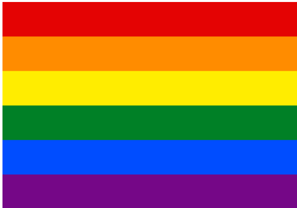
Obrázek 2 Duhová vlajka

V dnešní době je ale spíše všem známa duhová vlajka. Původní duhová vlajka obsahovala osm barevných pruhů. Růžová symbolizovala sex, červená život, oranžová zdraví, žlutá sluneční svit, zelená přírodu, tyrkysová magii a umění, indigová harmonii a fialová ducha. Když byl v roce 1978 zavražděn veřejně činný gay Harvey Milk, vzrostla poptávka po duhových vlajkách. Nebylo ale možné průmyslově vyrobit růžovou barvu a tak byla z vlajky odstraněna. O rok později byla odstraněna i tyrkysová barva, na vlajce zůstalo šest barev, což se do současnosti nezměnilo. 12