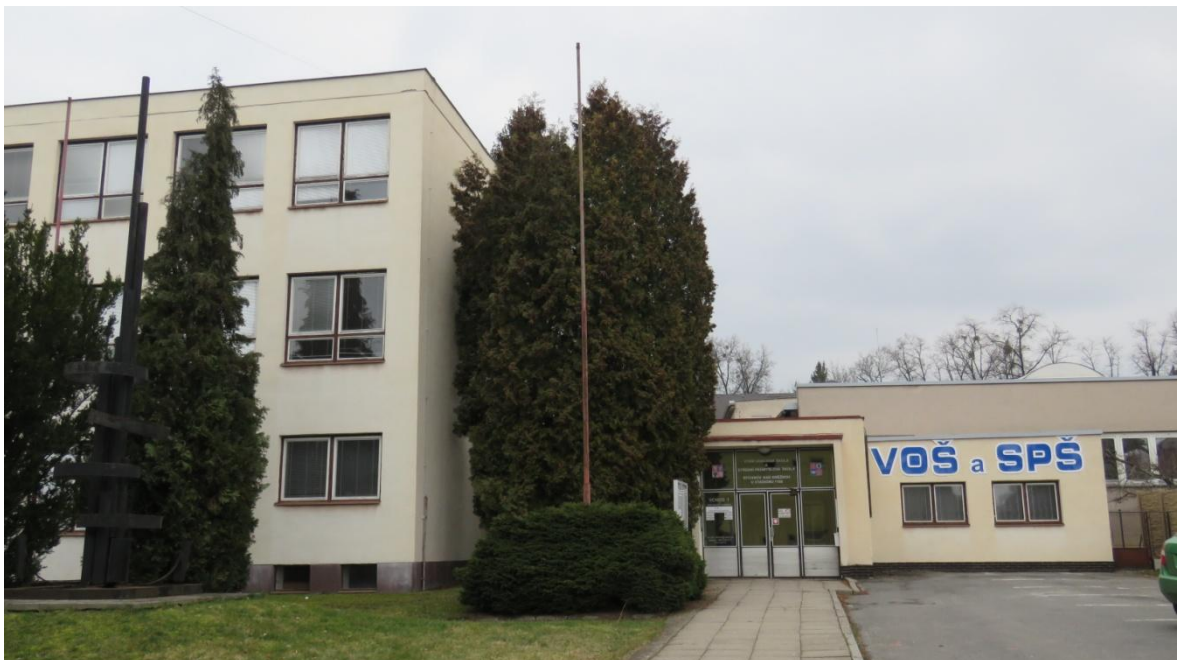
Obr. 2: Vyšší odborná škola a Střední průmyslová škola