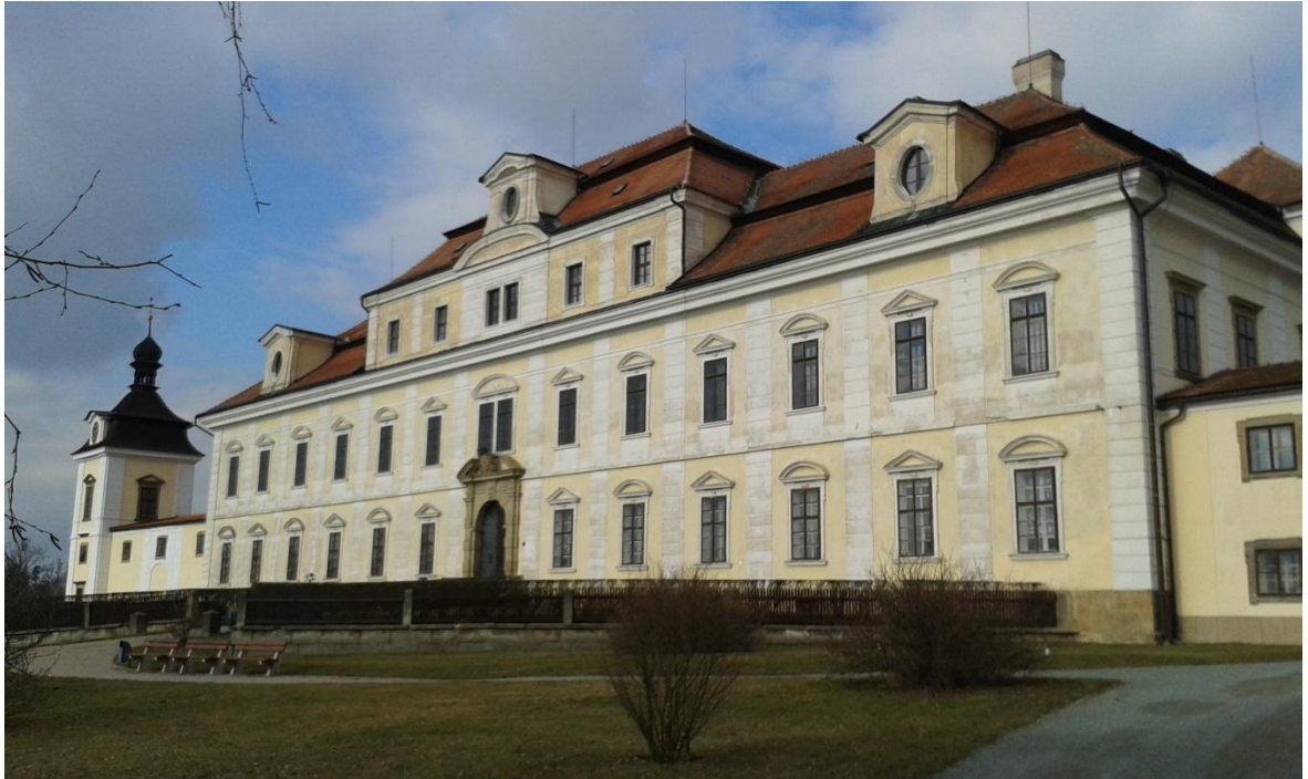
Obr. 1: Kolowratský zámek