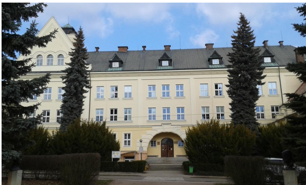
Obr. 5: Gymnázium F. M. Pelcla