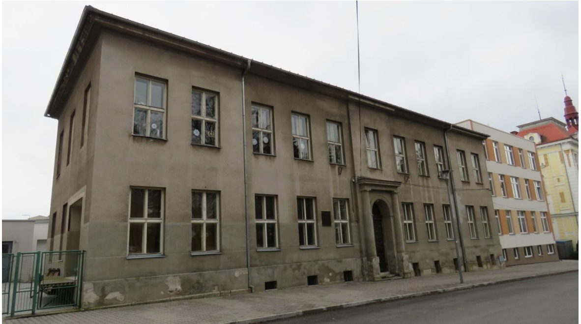
Obr. 3: Budova bývalé Státní odborné školy tkalcovské