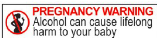
Obrázek 1 Schválený povinný výstražný štítek pro balené alkoholické produkty v Austrálii a ve společenství na Novém Zélandu

Je nezbytné, aby se společnost zaměřila především na prevenci, protože jeden z problémů pro včasnou detekci a léčbu dětí matek s abusem alkoholu v těhotenství je potíž s potvrzením pravidelného užívání alkoholu. Vzhledem k tomu, že není k dispozici spolehlivý biomarker, který by toto potvrdil. Kombinace několika různých biomarkerů zvyšuje přesnost detekce užívání alkoholu, ale řádné otestování kombinací jednotlivých hodnot biomarkerů u těhotných nebylo ověřeno (Lehikoinen et al., 2020, s. 1). V některých zemích se zaměřily na prevenci požívání alkoholu u těhotných pomocí varovných štítků na etiketách produktu obsahujících alkohol. Na Novém Zélandu a v Austrálii jsou tyto štítky od roku 2020 dokonce zavedeny jako povinné. V alkoholovém průmyslu se varovné štítky objevily již v roce 2011, ty byly ale pro firmy dobrovolné. Pro nedávné povinné zavedení ochranných štítků ještě pochopitelně není dostatek důkazů o prospěšnosti tohoto typu varování, a proto zůstává otázkou času, zda budou mít etikety význam, či nikoliv (Heenan et al., 2022, s. 1–2).