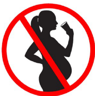
Obrázek 2 Oficiální francouzský piktogram, který se umísťuje na nádoby na alkohol

Velkou roli v populaci pro prevenci užívání alkoholu v těhotenství by měli hrát zdravotničtí pracovníci, především tedy gynekologové a porodní asistentky. Směr prevence by měl být zaměřen na příčiny pití alkoholu v těhotenství a rizikové faktory. Za jeden z nejsilnějších prediktorů pro příjem alkoholických nápojů v těhotenství bývá uváděna častá konzumace před otěhotněním. Z čehož vyplývá, že pro zdravé těhotenství je nejlepší pokud dojde ke změně životního stylu již nekonceptně. Preventivním faktorem je tedy správná edukace o nebezpečí alkoholu během těhotenství. Edukace by měla být zaměřena individuálně s ohledem na rizikové faktory, věk či vzdělání konkrétní klientky/pacientky. Právě úroveň vzdělání bývá uváděna jako důležitý ukazatel výskytu požívání alkoholu u těhotných. Model stanovuje, že čím vyšší je úroveň vzdělání, tím nižší bývá spotřeba alkoholu během těhotenství. Jako vysvětlení se uvádí, že ženy s vyšším vzděláním jsou schopny vyhledávat kvalitní a pravdivé informace ohledně tématu a ty následně využít. Zdravotníci by se měly zaměřit při edukaci na jasné a srozumitelné doporučení a zdůraznění,