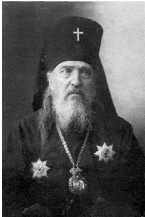
Obr. 1 – Portrét Mikuláše Kasatkina, 1905