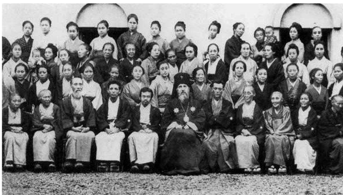
Obr. 4 - Mikuláš Kasatkin a jeho následovníci, rok neznámý