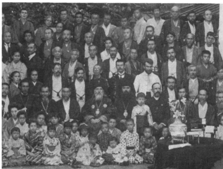
Obr. 3 – Slavnostní sebrání na počest příjezdu Sergija Tichomira, 1908