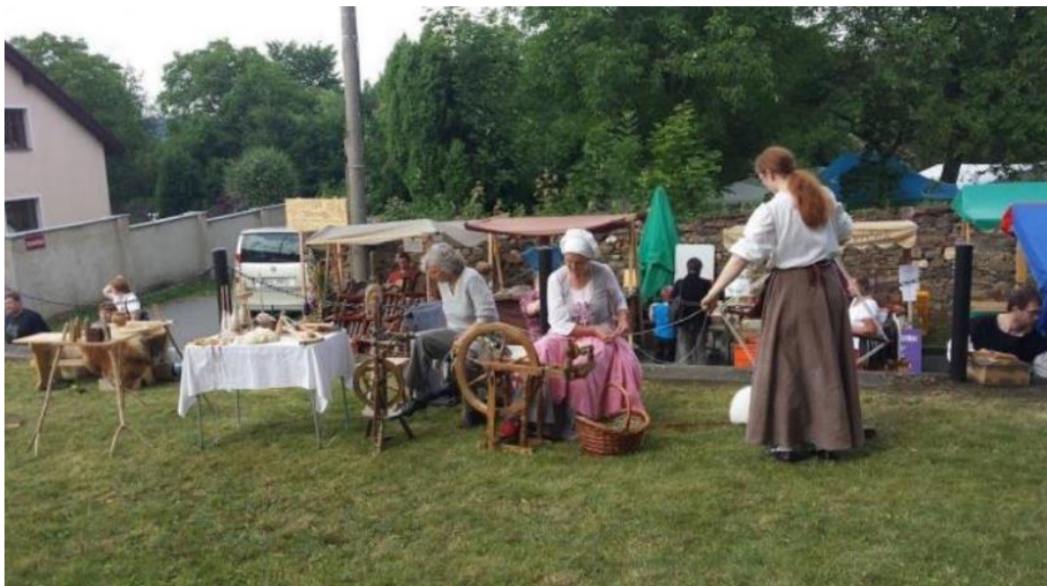
Obrázek č. 7 - Ševcovský, staročeský jarmark pořádaný spolkem Živé tradice Podblanicka Načeradec z.s.