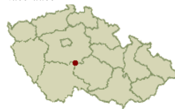
Obrázek č. 3 - Mapa polohy městysu Načeradce

Načeradec je od roku 2003 městskou památkovou zónou a status městys mu byl udělen 17. října 2012. Načeradec má deset spádových obcí: Daměnice, Dolní Lhota, Horní Lhota, Novotinky, Olešná, Pravětice, Řísnice, Slavětín, Vračkovice a Zdiměřice. Městys Načeradec leží ve Středočeském kraji okresu Benešov poblíž města Vlašimi. Jihovýchodní část Benešovska leží v Táborsko-vlašimské pahorkatině. Dominantou je Velký Blaník (o výšce 638 m n.m.) a Malý Blaník (o výšce 576 m n. m.). Oba se nachází v Blanické Brázdě, kterou obklopují i další vrchy např. Křížovská hůra, vrch Cikán u Načeradce či Pravětický vrch u Daměnic. Nyní Blanickou Brázdou protéká řeka Blanice. K jejím přítokům patří i potok Brodec protékající jižní částí Načeradce a spádovou obcí Olešná. Ke 31. 12. 2016 v Načeradci a spádových obcích žije 1033 obyvatel s průměrným věkem 50,92 let. Samotný Načeradec má 641 obyvatel z toho 84 děti do 15 let.