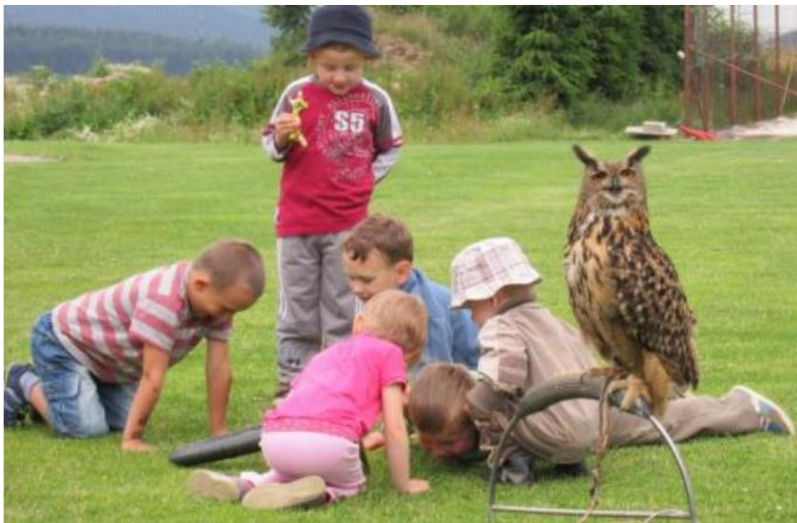
Obrázek č. 9 - Na lovecké stezce, aktivita pořádaná Mysliveckým spolkem Načeradce.