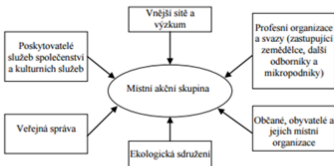
Obrázek č. 2 - Subjekty MAS

Mezi další uskupení založené pro lepší rozvoj obce patří místní akční skupiny (dále jen MAS). MAS jsou financovány 100 % z dotací a to z 80 % evropských a 20 % českých. Forma financování je tzv. zpětná, kdy se peníze získávají po doložení dokladů za předchozí období. Dalšími zdroji mohou být členské příspěvky, sponzorské dary či výtěžky z provozování např. infocentra. Možní členové MAS jsou uvedeni v následujícím schématu.