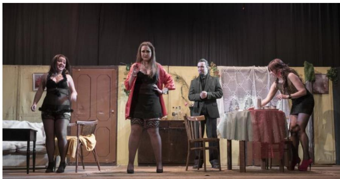
Obrázek č. 10 - Ochtotnický spolek Blaník Načeradec ve francouzské komedii Monsieur Hamed.