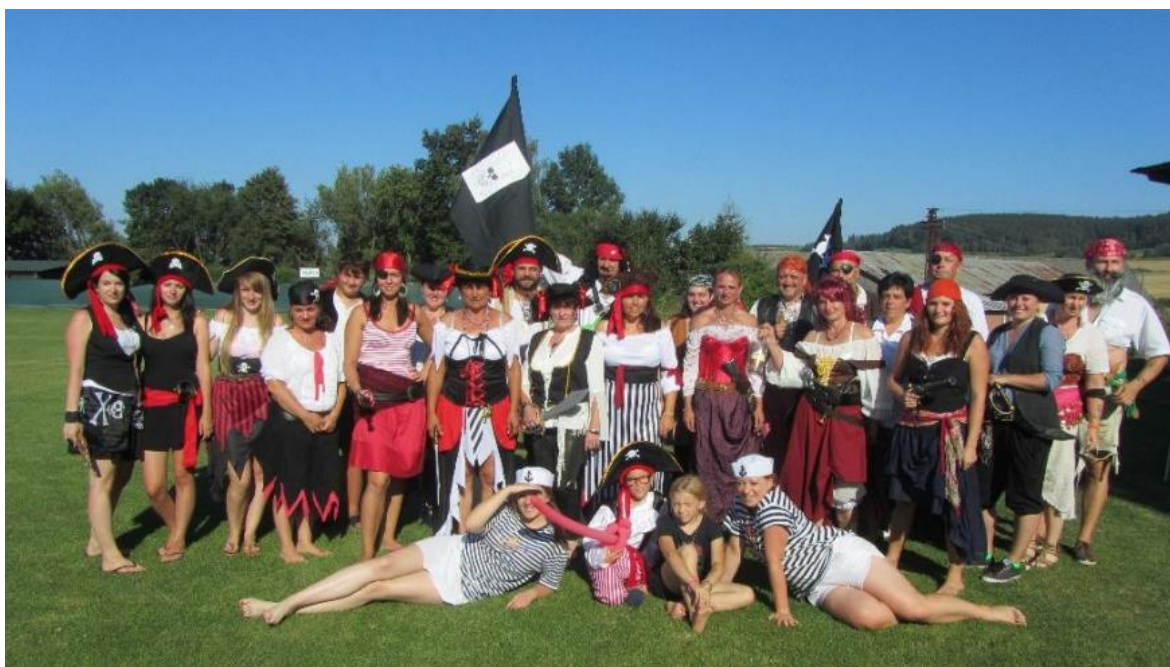
Obrázek č. 8 - Loučení s prázdninami s tématem Piráti a pirátky pořádané spolkem Kamarádi Načeradce.