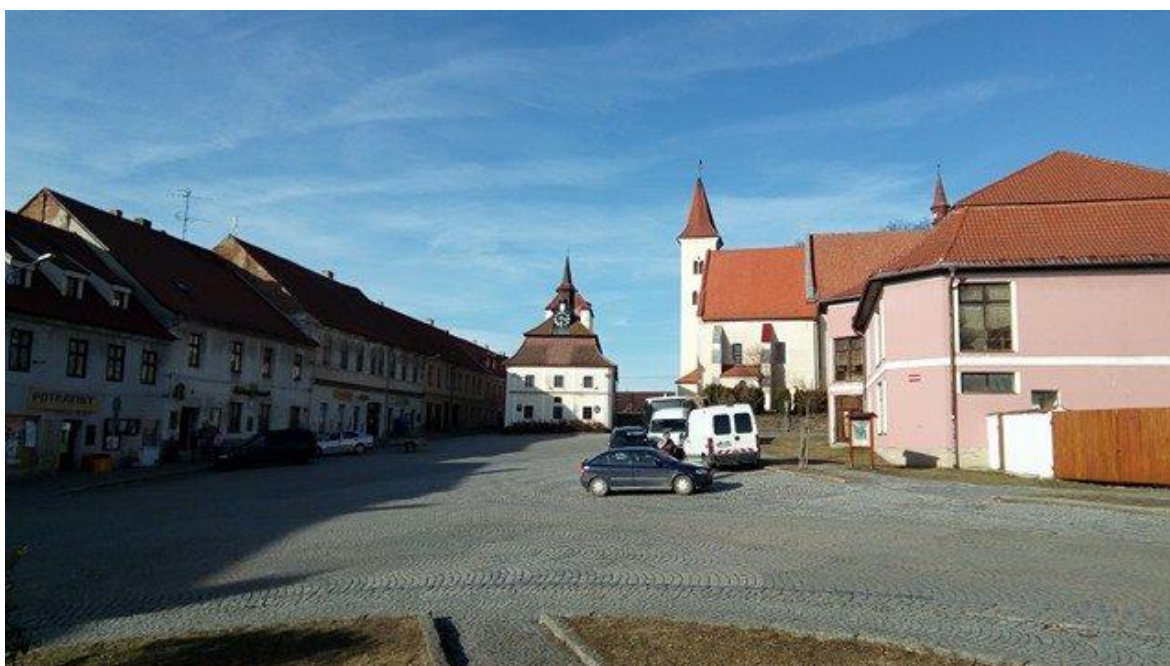
Obrázek č. 6 - Náměstí v Načeradci s radnicí a místním kostelem.