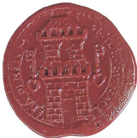
Obrázek č. 1 - Novodobý otisk městského pečetidla.