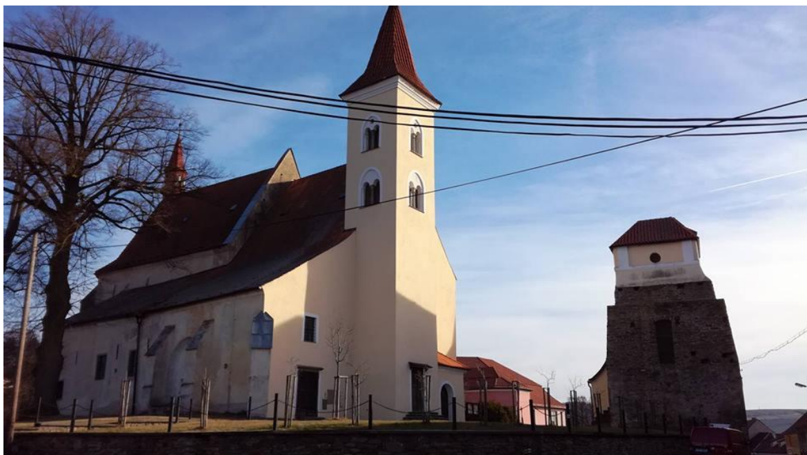
Obrázek č. 5 - Kostel sv. Petra a Pavla, vpravo stará bašta se zvonící.