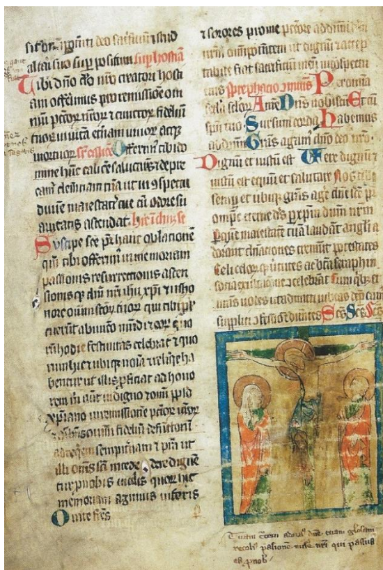
Obrázek č. 3 - Hlavní oltář sv. Petra a Pavla z poloviny 18. století. Foto: Načeradec, Dějiny městečka a okolních obcí str. 268.