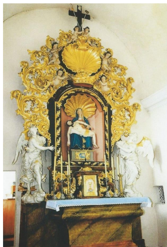
Obrázek č. 4 - Miniatura Ukřižování Ježíše Krista v načeradském misálu z konce 13. století.