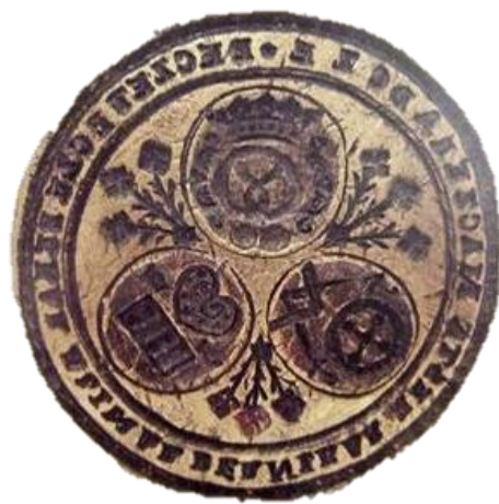
Obrázek č. 2 - Mosazné pečetidlo pekařského, pernikářského a mlynářského cechu. Foto: Načeradec, Dějiny městečka a okolních obcí, str. 271