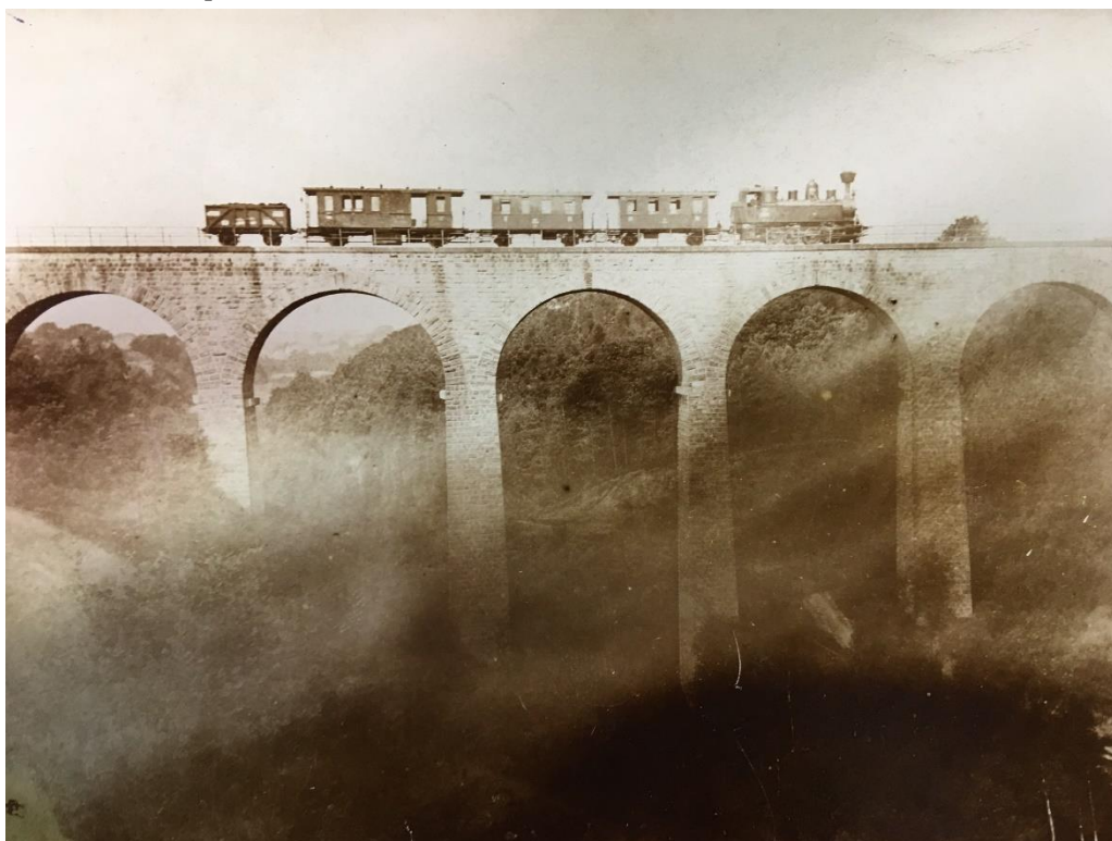
Obrázek 3 - Viadukt u Mšena; Zdroj: SOkA Mělník 3

V roce 1902 žádal Kyndr Václav z Kokořína v Časopise turistů o doporučení čtenářům, což se pak i stalo 17 .