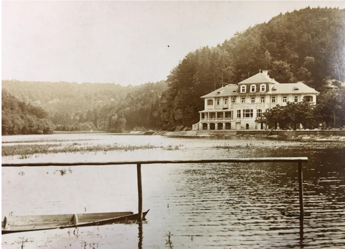
Obrázek 5 - Hotel Harasov; Zdroj: SOkA Mělník 5

Už během vzniku stezky musely probíhat u Harasovské tůně stavební práce, protože v roce 1912 se otevřel světu hotel Harasov (facebook.com/hotelharasov, 2018). Svě jméno nese podle hradiště či tvrzi, která stála na vrcholu skály nad Harasovskou tůň (Šestáková, 2018; mistopis.eu, 2018). Pozemky kolem hotelu byly rozlehlé. Konkrétní čísla dohledatelná nejsou, avšak pozemky jsou rozsáhlé dodnes. Podle paní Šestákové (2018) patřily k hotelu rozsáhlé lesy za hotelem a před hotelem patřilo k panství budoucí zahradnictví (dnes parkoviště) a celá skála s rozpadlým hradištěm. Podle různých zdrojů byl hotel velmi oblíbenou destinací, a