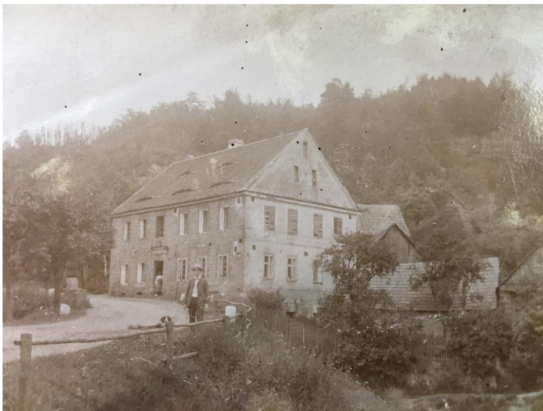
Obrázek 2 - Hospoda v Ráji; Zdroj: SOKA Mělník 2

koupi přidával dodatek, že koupě domu s cukrárnou proběhne pouze i s přepsáním licence, živnostenského listu. 14