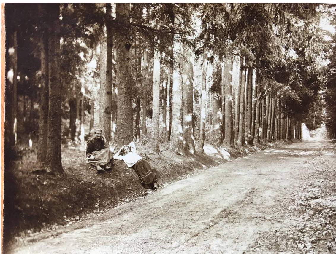
Obrázek 6 - Cesta ze Mšena na Kokořín

roklí Močidla je značená, ale od Jiskry (1932:41) se nedozvíme jakou barvou. Na Pokličky dovede červeně značená trasa a Jiskra (1932) dodává spoustu tipů na odpočívadla a možnosti občerstvení na malinových nebo borůvkových plantážích. Dnes atypická značka červená s bílým pruhem uprostřed, pak „ modrá s hnědou nahoře “ mohla návštěvníky dovést přes Boudeckou roklí do Kokořínského dolu (Jiskra, 1932:42). Poté nabízí výlety ze Mšena do Liběchova (4 hodiny), na Horní Vidim (12 km), na vrch Nedvězí (12 km), na hrad Houska (7-8 km), na horu Vráteňskou (4 km) a na Bezděz (17 km ze Mšena, což uvádí jako asi 4 a půl hodiny pěší chůze).